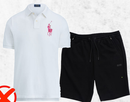
Toute forme courte