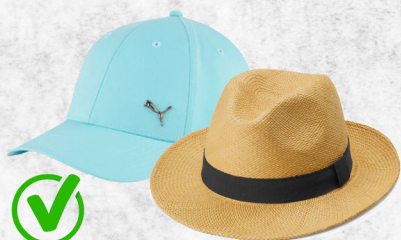
Chapeaux et casquettes