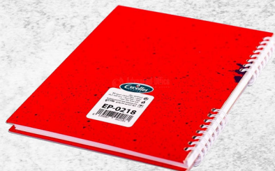
Carnet de terrain ( registre A5)