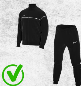
vêtements facilitant le mouvement