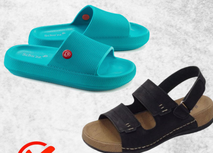
Claquettes et sandales