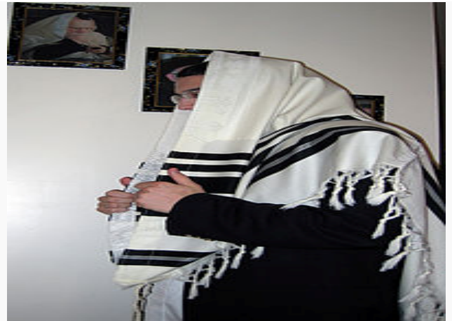
Judío portando un