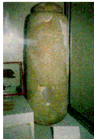
Jarrón del mismo tipo donde los Pergaminos del Mar Muerto fueron encontrados. Ahora en el museo de Citadel en Jordan.