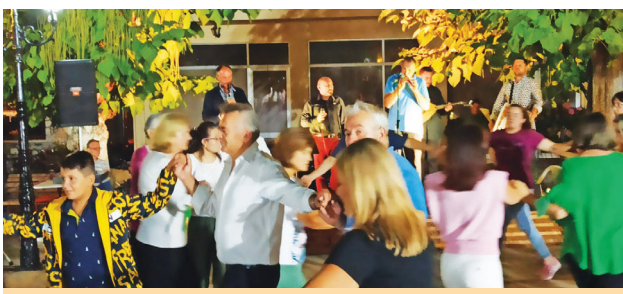
Το «φεστιβάλ μελιού»

ρισσότερο ελεύθερα με τη δυνατότητα πραγματοποίησης των καλοκαιρινών εκδηλώσεων, τις οποίες είχαν προγραμματίσει οι τοπικοί σύλλογοι και ο δήμος. Έτσι φέτος έγινε η ετήσια εκδήλωση του πολιτιστικού συλλόγου, το Βυτινώτικο «αντάμωμα» του συλλόγου των απανταχού Βυτιναιών, το φεστιβάλ μελιού του δήμου, προγραμματισμένες δραστηριότητες του «ομίλου» κυριών, η θρησκευτική πανήγυρης της Αγίας Παρασκευής από τον σύνδεσμο φιλοπροόδων και αρκετές άλλες μικρότερης έκτασης δράσεις και συναντήσεις. Το δίμηνο Ιουλίου- Αυγούστου