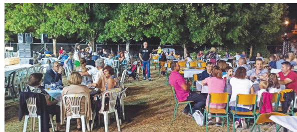
Από τη γιορτή του πολιτιστικού συλλόγου

νεοί, οι οποίοι παρέμεναν μέχρι τις απογευματινές ώρες. Πρέπει να τονίσουμε ότι η πίσνα αυτή, ολυμπιακών διαστάσεων, προσφέρει πολλά στην ψυχαγωγία και άθληση όχι μόνο των καλοκαιρινών επισκεπτών της Βυτινίας αλλά και της ευρύτερης Γορτυνίας.