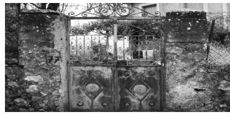
Το πατρικό σπίτι του «Βυτινίαιου» πάνω από το πάρκιγκ στον «Ντρούλα». Ο ίδιος είχε γράψει ως λεζάντα τη συμβολική έκφραση

ΓΡΑΦΕΙ: Ο «Βυτινίαιος» από τα Βυτιναιίκα του Πύργου (το κείμενο δημοσιεύτηκε στην ιστοσελίδα «Βυτιναιίκα» στις 29-12-2008)