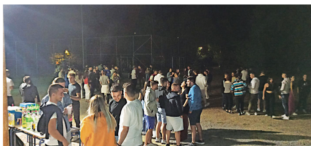
Από το «πάρτυ» νεολαίας

Το τελευταίο καλοκαίρι, που πέρασε ο επισκέπτης αλλά και ο ντόπιος σε κανονικές Βυτινώτικες συνθήκες ήταν αυτό του 2019. Μετά ήρθε η διετία της πανδημίας, που όλα ήταν περιορισμένα και επιφυλακτικά, ενώ ματαιώθηκαν οι μαζικές ψυχαγωγικές εκδηλώσεις, οι οποίες πραγματοποιούντο κάθε καλοκαίρι. Μετά λοιπόν τη διετία των περιορισμών φέτος τα πάντα λειτούργησαν πε-