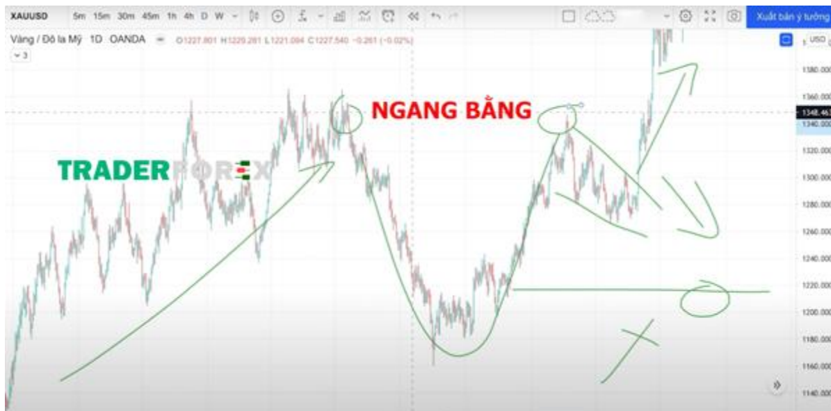
Các vùng kháng cự trong cup and handle

Bên cạnh đó, các phần mép của cốc phải bằng nhau không nên nghiêng quá. Nếu không các vùng này sẽ rất có thể trở thành các vùng kháng cự. Thời gian hình thành 2 phần nửa cốc quá lâu sẽ khiến cho vùng kháng cự rất mạnh và giá khó có thể phá vỡ được.