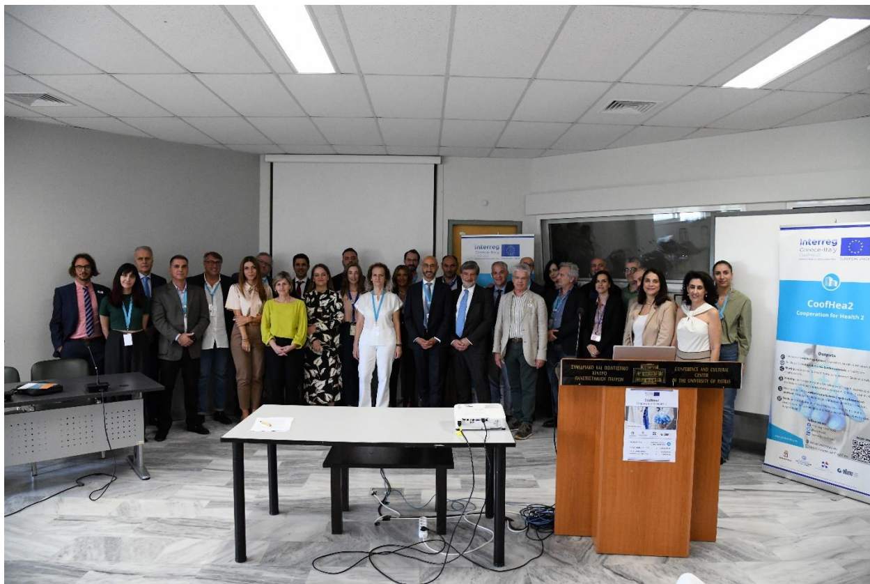
Εικόνα 1: Συμμετέχοντες στο τελικό συνέδριο του έργου