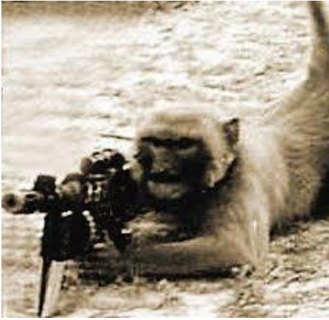
(BinbaŐı Cezar 1959)

Ama bu savař maymunlara çok Őey ğretmiŐti, gçlenmeden gçlüye saldırmamayı, gçlnn neye sahip olduėunu ve daha nicesini. Fotoėraf makinesini o dnem yeni keŐfeden maymunların çektiėi bazı fotoėraflar: