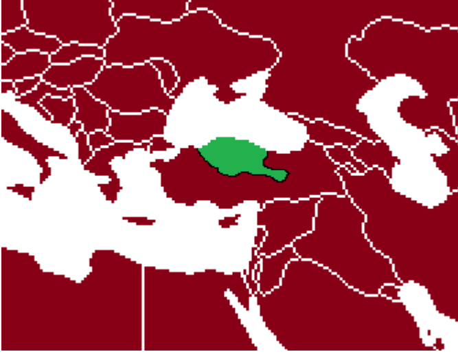
2016 Orta Doğu

10 Yıl önce küresel güç olan maymunlar, artık sıradan bir Orta Doğu ülkesi olmak üzereydi. Belki de Mısırlı Maymunları hiç dinlemeyip Orta Doğu bok çukuruna yerleşmemeleri gerekiyordu.