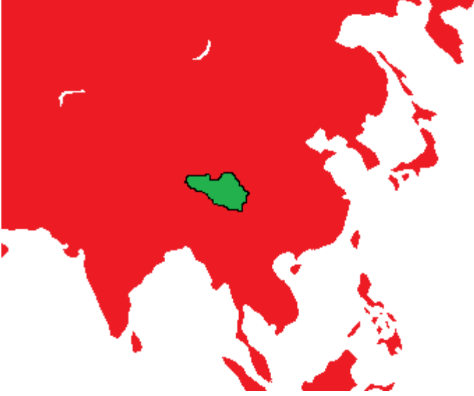
1962 Asya Haritası

Ama bu savař maymunlara çok Őey ğretmiŐti, gçlenmeden gçlüye saldırmamayı, gçlnn neye sahip olduėunu ve daha nicesini. Fotoėraf makinesini o dnem yeni keŐfeden maymunların çektiėi bazı fotoėraflar: