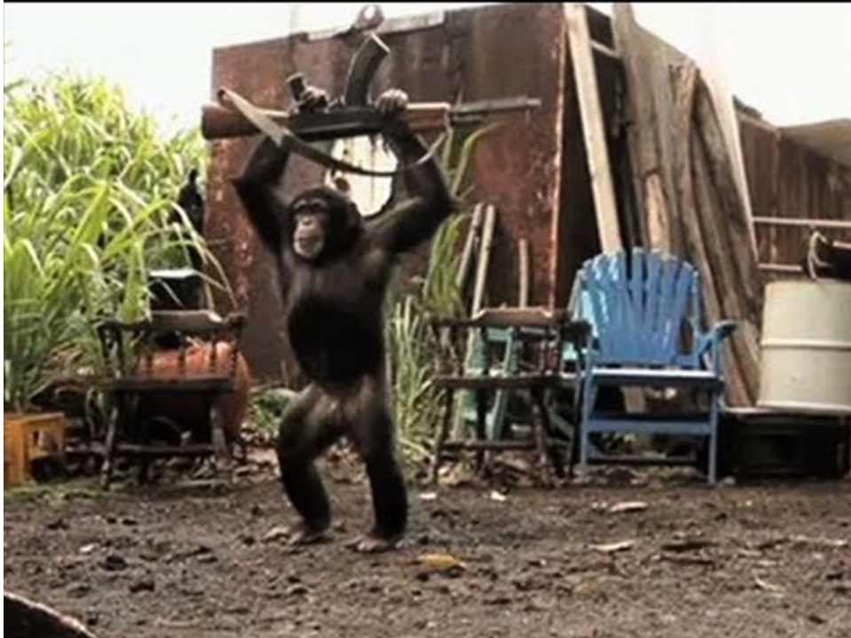
Savaşa ait bir fotoğraf (Renklendirilmiş 1974-1978)

Topraklarını büyük ölçüde geliştiren maymunlar, teknolojiyi de geliştiriyordu. Zırlı araçlara bile sahiptiler.