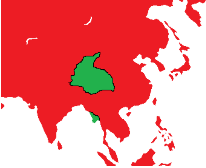
1976 Asya Haritası

Asya Harekatlarında büyük bir ilerleme kateden maymunlar artık bir ülke büyüklüğündeydi. Onları gören köylüler direnmeden teslim oluyordu. İnsanları çalıştırıp elde ettikleri ürünü satıyorlardı, böylece ekonomide ilk 50 ye girmeyi başardılar.