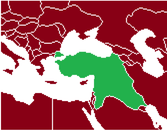
2003 Orta DoĐu

Neredeyse Türkiye'nin tamamında yönetimi devralan maymunlar, 2002 yılına gelindiĐinde ülkenin tamamına hükmetti. En zeki maymunlarını yarışmalara koyup maymun ününü dünyaya yaydı.