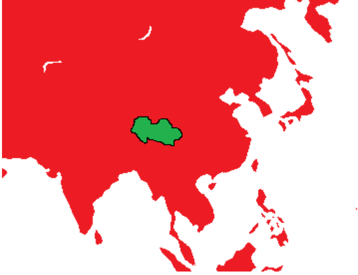
1958 Asya Haritası

İnsanlar için maymunlar artık büyük bir tehlikeydi, öldürdükleri askerlerden topladıkları silah ve malzemelerle birlikte çok daha güçlenmişlerdi. Askerlerden duydukları rütbe kavramını kendilerine de geçirmeye başladılar ve rütbeli sisteme geçiş yaptılar. Bu savaş iki taraf içinde yıpratıcı olduğu için iki tarafta barış yaparak 1952'den 1958'e kadar 7 yıl hiç savaşmadı. Bu barış sürecinde küçük çatışmalar olsa da çok büyük sonuçlar doğurmamıştı.