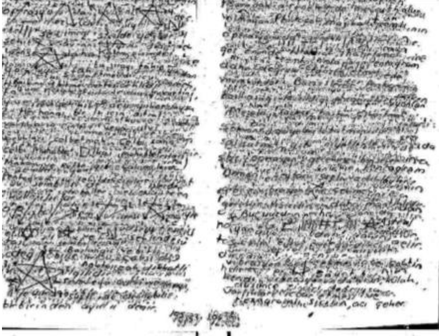
Barış anlaşmasının çekilmiş tek fotoğrafı (1963)

İki tarafında yaralarının sarılması ve daha fazla kayıp vermemek için barış yoluna gidildi. Ormanda diplomatlar ve maymunlar arasında yapılan anlaşma sonucu 10 yıl savaş yapmama kararı alındı. Bu bilgiler Avrupa ve diğer dünya devletlerine teröristlerle anlaşma olarak lanse edildi, çünkü insanların paniğe kapılıp maymunlardan korkması istenmiyordu.