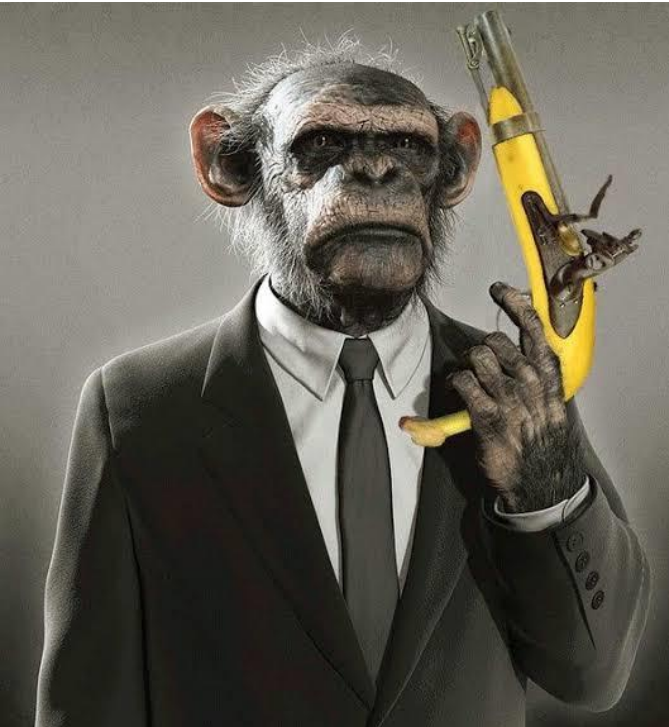
(Peter Honkie 19*?*-2019)

Büyük bir araştırmacı olan ve teknolojinin ilerlemesinde büyük önem sağlayan Peter Honkie (Yaşa) suikasta kurban gitmişti, 2007'de öldürülmemesi için öldü süsü verilen Honkie, nasıl oldu da öldürüldü bilemiyorduk. Bu olsa olsa Middle East Killer'in işi olmalıydı.