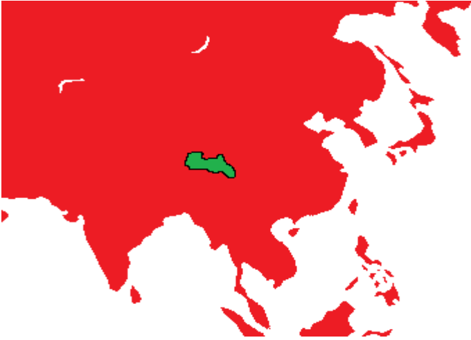
1943 Asya Haritası

İnsanlara kendilerini göstermeden gelişen maymunların hedefi bir gün dünyaya hükmetmektir. 1943 yılının başına gelindiğindeyse, küresel çapta maymunlar irtibat halinde ve her an çatışmaya hazır bir pozisyondaydı.