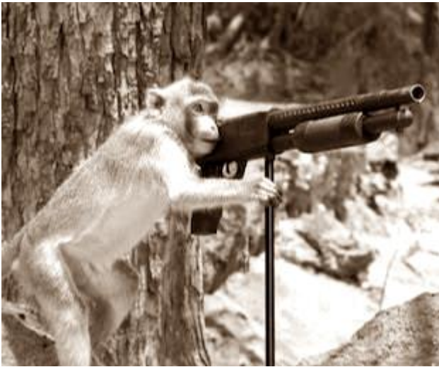
(Albay HabeŐob McMonaki 1959)