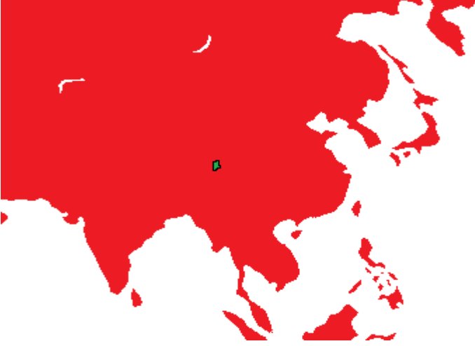
1941 Asya Haritası

1939 yılının bahar aylarında Doğu Asya'nın muson ormanlarında kendilerini geliştiren Asya şempanzeleri bölge çiftçileriyle anlaşmaya başladı. Bir süre sonra insanlar onları köleleriymiş gibi kullanmaya başlayınca, bazı maymunlar isyan etmeye kalkıştı. 2 şempanzenin ölümüyle sonuçlanan ayaklanma sonucu maymunlar insanlara küstü ve muson ormanlarına geri döndü. İntikam ateşiyle yanıp tutuşan maymunlar bambuyla yaptıkları silahlarla tarlaya geri döndü. Çıkan arbedede 1'i çocuk 3 insan ölüncen, 8 şempanze maalesef vefat etti. Daha fazla dikkat çekmek istemeyen maymunlar 1940 yılının son aylarına kadar ormanda kendilerini bilime adadı.