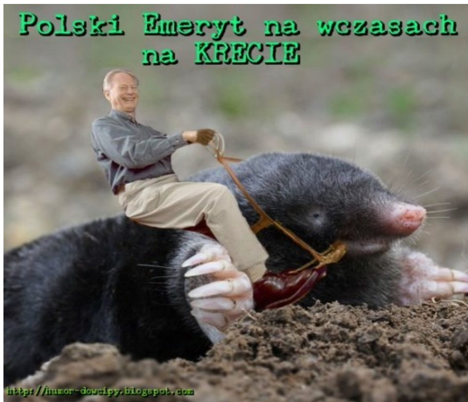
Polski Emeryt na wczasach na KRECIE !