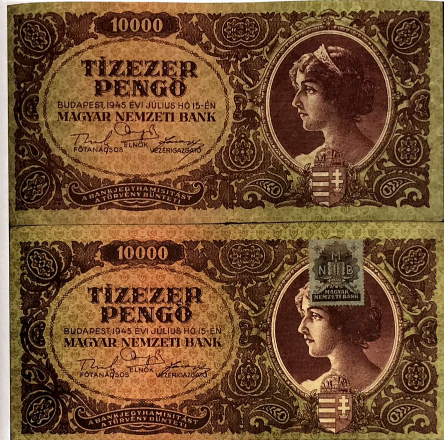
Tízezer-pengősök: bélyeg nélküli a negyed-részt érte

Noha a kormány is tudta az intézkedés korlátait, azt azért nem gondolták, hogy csak néhány hé-