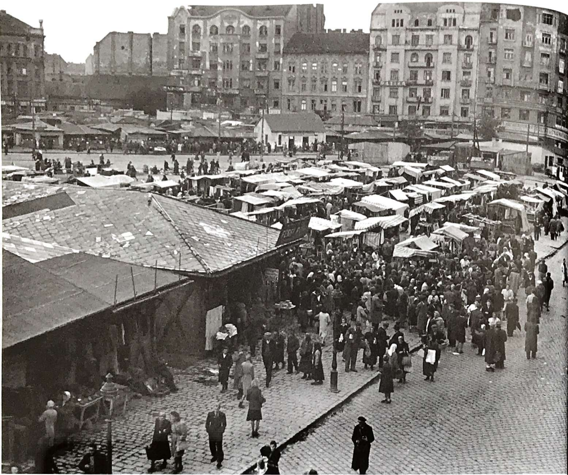
A Teleki tér a cserekereskedelem központja

A Teleki tér mint a különböző csereüzletek országos központja fogalommal vált. Teljesen valós képet mutatott az Eldorádó című film az ott uralkodó életről és farkastörvényekről. Ha vidékről valaki Pestre ment, akkor ott kötött ki. A pengő használata 1945-ben még jellemző volt, de az infláció fokozódásával egyre inkább beszűkült, és virágzott a cserekereskedelem. Mivel a boltokban alig volt áru, és azoknak az ára is naponta emelkedett, főleg a piacokra jártak vásárolni az emberek. Használtak is sokan vettek holmikat, például ruhákat, ingeket, ismerősöktől vagy a Teleki téren. Az áruhiány és a beszerzési nehézségek hihetetlen kreatívá tették a kereskedőket. A felső középosztály legtöbb tagja politikai okok miatt elvesztette