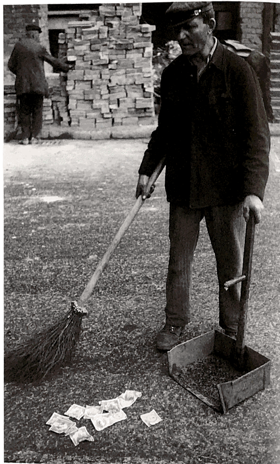
Söprik az utcán a bankjegyeket Budapesten 1946. július elején

váltak (az adópengőhöz képest) a csak elméletben létező valutát. A ténylegesen forgalomban lévő adópengő inflációja pedig nem is volt világsúcot érő, „mindössze” 300-szorosára emelkedtek az árak júliusban.