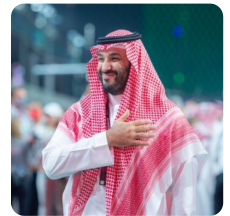
هيا خالد السبيعي: جدة

في لحظة دخول ولي العهد في سباق الفورمولا قبل انطلاق السباق النهائي حدث موقف طريف وأثار ضجة في وسائل التواصل الاجتماعي، في وسط زحام الجمهور تحديداً من صدر شمالي أتت صرخة بلهجة حائلية قائلاً "يا بعد حيي يا محمد" بلا تكلف من القلب إلى القلب، الجملة الحائلية التي لم تصدر من شخص واحد فقط، بل عن الشعب بأكمله مُعبّرة عن مدى الحب والفخر والاعتزاز لولي العهد، ويلبها بلحظات تساؤل ضيف أجنبي عن معنى الكلمة التي شدّت انتباه ولي العهد والهتاف الذي حدث بعدها وطلب ترجمتها، وبعد نشر المقطع في وسائل التواصل الاجتماعي صعد هاشتاق #يا بعد حيي يا محمد إلى "التريند" العالمي.