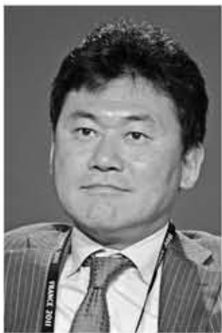
Rakuten တည်ထောင်သူနှင့် အမှုဆောင်အရာရှိချုပ် မစ္စတာ Hiroshi Mikitani