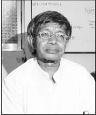
လှမြင့်(ရန်ကုန်တက္ကသိုလ်)