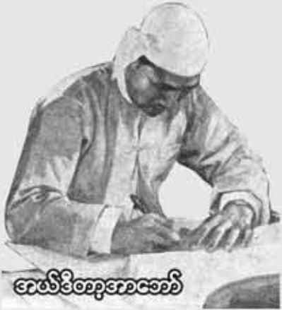
တော်ဦးဆောင်ရေး

မြန်မာဒီမိုကရေစီရေးကြိုးပမ်းမှုသည် လက်ရှိအထိ မရေရာမသေချာမှုများထဲတွင် စမ်းတမ်းပါးပါးဖြစ်နေရသော်လည်း သို့သော် ယခင်ထက်နှိုင်းစာလျှင် ပြည်သူတို့၏ပေးပေါင်းပါဝင်မှု ပိုမိုမြင့်မားလာခဲ့ပြီး အားတက်စရာအခြေအနေများကိုလည်း တွေ့မြင်နေရပါသည်။ ဥပမာအားဖြင့် ဒီမိုကရေစီစနစ် ပီပီပြင်ပြင်ဖြစ်ထွန်းလာစေရေးအတွက် အဓိကအကျဆုံးဖြစ်သော ၂၀၀၈ အခြေခံဥပဒေပြင်ဆင်ရေးနှင့်ပတ်သက်၍ ပြည်သူတို့၏ ထောက်ခံပါဝင်မှုနှင့် ဆန္ဒထုတ်ဖော်ပြသမှုများကို ကျယ်ကျယ်ပြန့်ပြန့် မြင်တွေ့ကြားသိနေရပါသည်။ ဒီမိုကရေစီအင်အားစုများဘက်က လည်း ဖွဲ့စည်းပုံ ပြင်ဆင်ရေးလမ်းကြောင်း ကို နည်းလမ်းအမျိုးမျိုးဖြင့် တွန်းအားပေး လာနေသည်ဟု ယူဆရပါသည်။