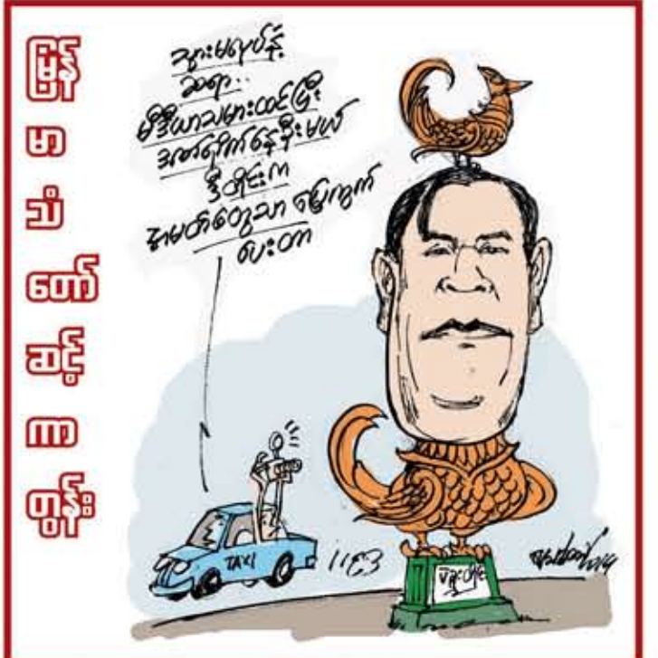
စာမျက်နှာ ၁၂ သို့ >

ဥက္ကဋ္ဌ ဦးတင်ထွတ်နှင့် စုံစမ်းရေး အမတ်များ လယ်မြေကော်မရှင်မှ နုတ်ထွက်သင့်ဟု ဆန္ဒထုတ်ဖော် ပြောကြား