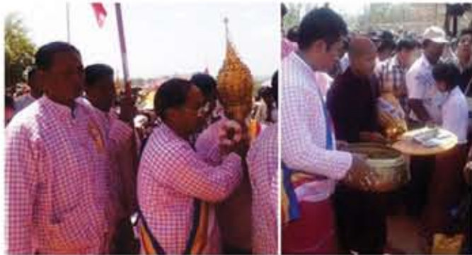
စာမျက်နှာ ၂၂-၂၃ သို့ >

ကိုရင်လေးဆရာတော် ဘဒ္ဒန္တပုပ္ဖရမ္မ၏ အကြီးဆုံးစေတီထီးတင်ပွဲ ကြံ့ခိုင်ရေးဝန်ကြီးချုပ်နှစ်ဦး တက်ရောက်ဆင်နွှဲ