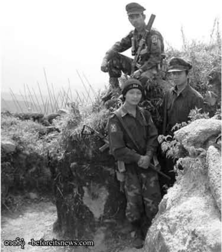
စစ်စစ်ရဲ့ -beforeitsnews.com

“၁၈ နှစ်၊ ၁၉ နှစ်အရွယ်ရှိတဲ့ လက်နက်ကိုင်တိုင်းရင်းသားလူငယ်တွေက ပြောကြတယ်။ ကျွန်တော်တို့လည်း လက်ဝဲတော့တော့ ကွန်ပျူတာတွေကိုင်ချင်တယ်ဆိုတဲ့ စကားဖြစ်ပါတယ်။ ကျွန်တော်တကာယကွန်ပျူတာပဲ စိတ်မကောင်းဖြစ်ရပါတယ်။ ကျွန်တော် အပိုင်အမာသန့်ဌာနချထားပါတယ်။ ကျွန်တော်တို့ အစိုးရလက်ထက်မှာ ဒီလိုမယုံမရဲဖြစ်နေတဲ့ စိုးရိမ်ပူပန်မှုပျောက်ပျောက်အောင်ပျောက်ပစ်ရပါမယ်။ ဒါဟာ ကျွန်တော်တို့ အစိုးရရဲ့ ခံယူချက်လည်း ဖြစ်ပါတယ်။ ကျွန်တော်တို့ တိုင်းရင်းသားတွေ ခံစားနေကြရတဲ့ ခါးသီးတဲ့ဒဏ်ရာတွေ၊ စူးနစ်တဲ့အတွေ့အကြုံတွေ၊ ပျောက်ဆုံးနေတဲ့ အိမ်မက်တွေ ကျွန်တော်တို့အားလုံး ဖြည့်ဆည်းပေးဖို့ တာဝန်ရှိပါတယ်။ ဒါဟာ ကျွန်တော်တို့အားလုံးအတွက် သမိုင်းပေးတာဝန်တစ်ရပ်လည်း ဖြစ်ပါတယ်။ ကချင်တိုင်းရင်းသားအဖွဲ့အစည်းတွေနဲ့ ပတ်သက်ပြီး ပြည်တွင်း၊ ပြည်ပက မေးမြန်းကြတာတွေ ရှိပါတယ်။ ဒီတပြည်သူတွေလည်း သိချင်နေကြပါလိမ့်မယ်။ ကျွန်တော်ကိုယ်တိုင် တစ်ဖက်ကို မိမိကိုယ်ကိုယ်ခံကာကွယ်ရုံကလေးပဲ။ ထိုးစစ်ဆင် တိုက်ခိုက်မှုတွေ မလုပ်ဖို့ ညွှန်ကြားထားပြီးတဲ့အနေအထားမှာ ဘာဖြစ်လို့ ပစ်ခတ်တိုက်ခိုက်မှုတွေ မရပ်သေးတာလဲဆိုတဲ့ မေးခွန်းပဲဖြစ်ပါတယ်။ တစ်ဖက်က ကာကွယ်ရေးဦးစီးချုပ်ကိုယ်တိုင် လက်အောက်ခံတပ်ရင်းတပ်ဖွဲ့တွေကို ဆက်လက် ညွှန်ကြားပြီးလည်း ဖြစ်ပါတယ်။ တစ်ဖက်မှာ အမိန့်နဲ့ ညွှန်ကြားချက်ဟာ အသက်သွေးကြောဖြစ်ပါတယ်။ ယနေ့ မပြီးပြတ်သေးတဲ့ တိုက်ပွဲတွေနဲ့ ပတ်သက်ပြီး တစ်ဖက်နဲ့တစ်ဖက် လက်ညှိုးထိုး အပြစ်တင်ရုံနဲ့ ပစ်ခတ်တိုက်ခိုက်မှုတွေ ရပ်စဲသွားမှာ မဟုတ်ပါဘူး။ နိုင်ငံရေးအရ ဆွေးနွေးညှိနှိုင်းနိုင်ဖို့အတွက် ပထမဦးဆုံး နှစ်ဦးနှစ်ဖက် ပစ်ခတ်တိုက်ခိုက်မှုတွေ ရပ်စဲဖို့ လိုပါတယ်”