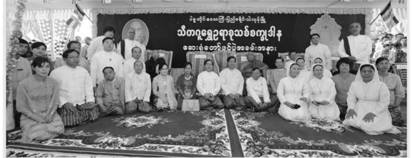
သီတဂူဆရာတော်၊ ဗိုလ်ချုပ်ကြီးဟောင်း ဦးခင်ညွန့်တို့နှင့်အတူ ပြည်ထောင်စုဝန်ကြီးဦးလှထွန်း၊ တိုင်းဒေသဝန်ကြီးချုပ်ဦးညွှတ်ဝင်း၊ ကြံ့ခိုင်ရေးမဟာမိတ်မတီဝင် (ပဲခူးတိုင်းတာဝန်ခံ) ဒေါက်တာမြဦးတို့ကို ဖေဖော်ဝါရီ ၁၄ ရက် ဆေးရုံဖွင့်ပွဲအခမ်းအနား၌ တွေ့ရစဉ်

အထူးကြေညာအပ်ပါသည်- ပဲခူးတိုင်းဒေသ၊ အနောက်ခြမ်း၊ ပြည်ခရိုင်၊ သဲကုန်းမြို့၊ တပ်ရွာ၊ တပ်အလယ်ကျောင်း၊ သီတဂူစကျီဒါန ဆေးရုံတော်၊ သီတဂူ သာသနာပြု အဖွဲ့က အထူးကြေညာအပ်ပါသည်- ဤစကျီဒါန ဆေးရုံတော်ကို ဖေဖော်ဝါရီလ (၁၄)ရက်နေ့က ဖွင့်လှစ် ခဲ့ပြီး ထိုနေ့မှ စတင်၍ မျက်စိဝေဒနာရှင်များကို လက်ခံစာရင်းပြုစုခဲ့ကာ ဝေဒနာရှင်ပေါင်း(၄၀၀၀)ကျော် လာရောက်ခဲ့ပါသည်။ ထို (၄၀၀၀) ကျော် ကို စမ်းသပ်စစ်ဆေးခဲ့ရာ (၁၈-၂-၂၀၁၄) ယနေ့ထိ ခွဲစိတ်ကုသရမည့် လူနာပေါင်း ၈၀၀ ခန့် ရှိခဲ့ပါသည်။ ပထမအကြိမ် ခွဲစိတ်မှု အစီအစဉ်၌ လူနာပေါင်း (၅၅၀)ကို ခွဲစိတ် ကုသပေးမည်ဟု သီတဂူအစိပတ်ဆရာတော်ကြီးကဆုံးဖြတ် သတ်မှတ် ပေးခဲ့ပါသည်။ (၇) ရက်ခန့် ခွဲစိတ် ကုသပြီးလျှင် ရက်သတ္တပတ် (၂) ပတ်ခန့် အနားယူရပါမည်။ ဆရာဝန်များနှင့်အခြားဝန်ထမ်းများကိုအလှည့်ကျလဲလှယ်ပြီး ဆေးရုံ နှင့် ဆေးရုံသုံးပစ္စည်းများကို သန့်ရှင်းရေးဆောင်ရွက်ပြီးသောအခါ မတ် လ (၄)ရက်နေ့မှစ၍ ဒုတိယအကြိမ် သဲကုန်းမြို့သီတဂူစကျီဒါန ဆေးရုံ တော်တွင် စမ်းသပ်စစ်ဆေး ခွဲစိတ်ကုသမှု အစီအစဉ်များ ဆက်လက် ဆောင်ရွက်သွားမည်ဖြစ်ကြောင်း အထူးကြေညာအပ်ပါသည်။ ထိုဒုတိယအကြိမ်၌လည်း လူနာများ ကျန်ရှိနေသေးလျှင် ဧပြီလ နောက်ပိုင်းတွင်လည်း တတိယအကြိမ် မျက်စိစမ်းသပ် စစ်ဆေးခွဲစိတ်ကု သမှု လုပ်ငန်းများစီစဉ်ဆောင်ရွက်သွားရန် ရည်မှန်းထားကြောင်း ကြေ ညာအပ်ပါသည်။ အလိုဆန္ဒ မပြည့်ဝသည့် ရဟန်းရှင်လူတို့အတွက်အထူးပင် တောင်း ပန်ပါသည်။ မျက်စိဝေဒနာရှင်များ၏ အလိုဆန္ဒကို အတတ်နိုင်ဆုံး ပြည့်ဝအောင် ဆောင်ရွက်နိုင်ပါစေဟု ဆုတောင်းပါသည်။