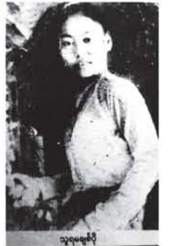
သူရမမုခ်ပို