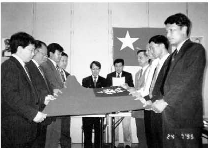
စင်ပြိုင်အစိုးရ ပြင်ဆင်ဖွဲ့စည်းသည့်အခမ်းအနားတွင် စင်ပြိုင်အစိုးရဝန်ကြီးချုပ် ဒေါက်တာစိန်ဝင်းနှင့် အစိုးရအဖွဲ့ဝင်ဝန်ကြီးများ ကတိသစ္စာပြုနေစဉ်

၂-၁၀-၂၀၀၀။ အိုင်ယာလန်နိုင်ငံ၊ ဒဗလင်မြို့တွင် ပြည်သူ့လွှတ်တော်ကိုယ်စားလှယ်များအဖွဲ့ ညီလာခံနှင့် NCGUB အား ပြင်ဆင်ဖွဲ့စည်းသည့် အစည်းအဝေးတို့ကို ကျင်းပသည်။