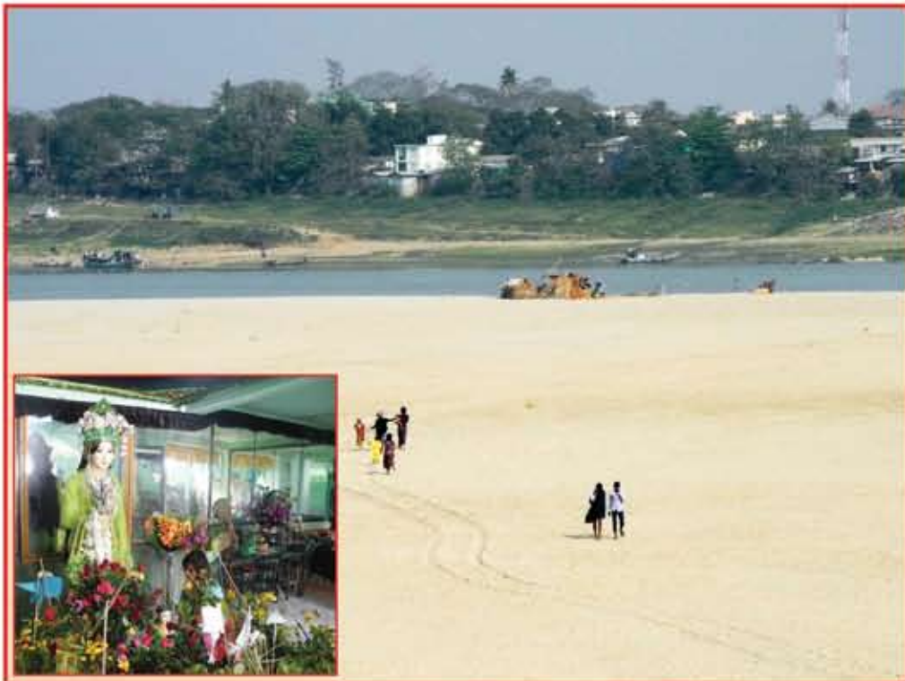
ပြည်၊ ဖေဖော်ဝါရီ ၁၄

မြန်မာနိုင်ငံ မြောက်ပိုင်းဒေသရှိ မြစ်မ်းမင်းသမီး မြစ်မြို့၊ ရောဂါမြစ်ကမ်းသောင်ပြင်နှင့်တစ်ဖက်ကမ်းရှိမြစ်မ်းမင်းသမီးနတ်ကွန်းကိုဖေဖော်ဝါရီလအတွင်း ပုံပါအတိုင်းတွေ့ရသည်။