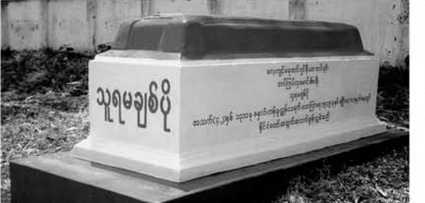
အပတ်စဉ်စနေနေ့တိုင်းထုတ်ဝေသည်