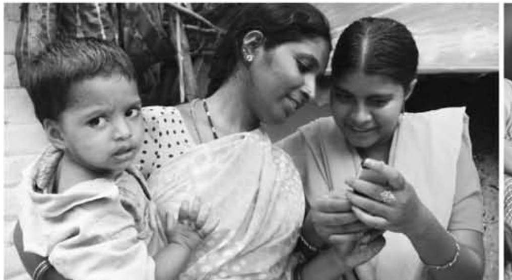
အပတ်စဉ်စနေနေ့တိုင်းထုတ်ဝေသည်