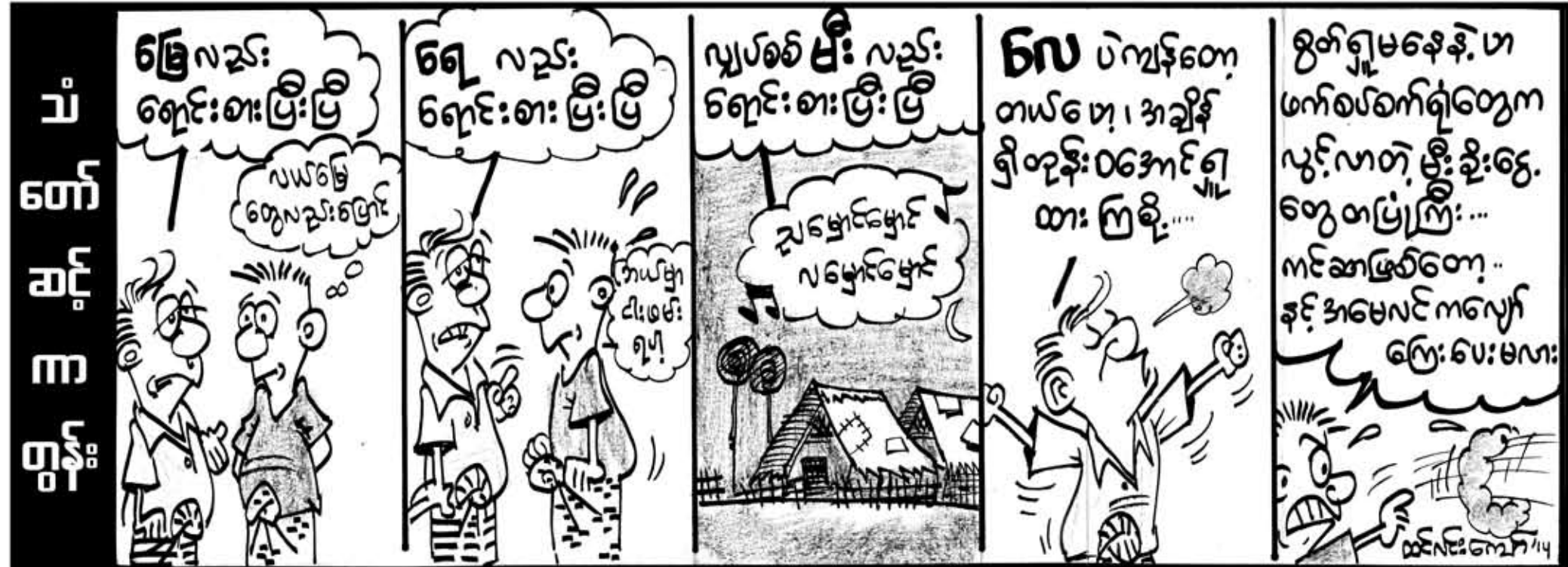
အပတ်စဉ်စနေနေ့တိုင်းထုတ်ဝေသည့်