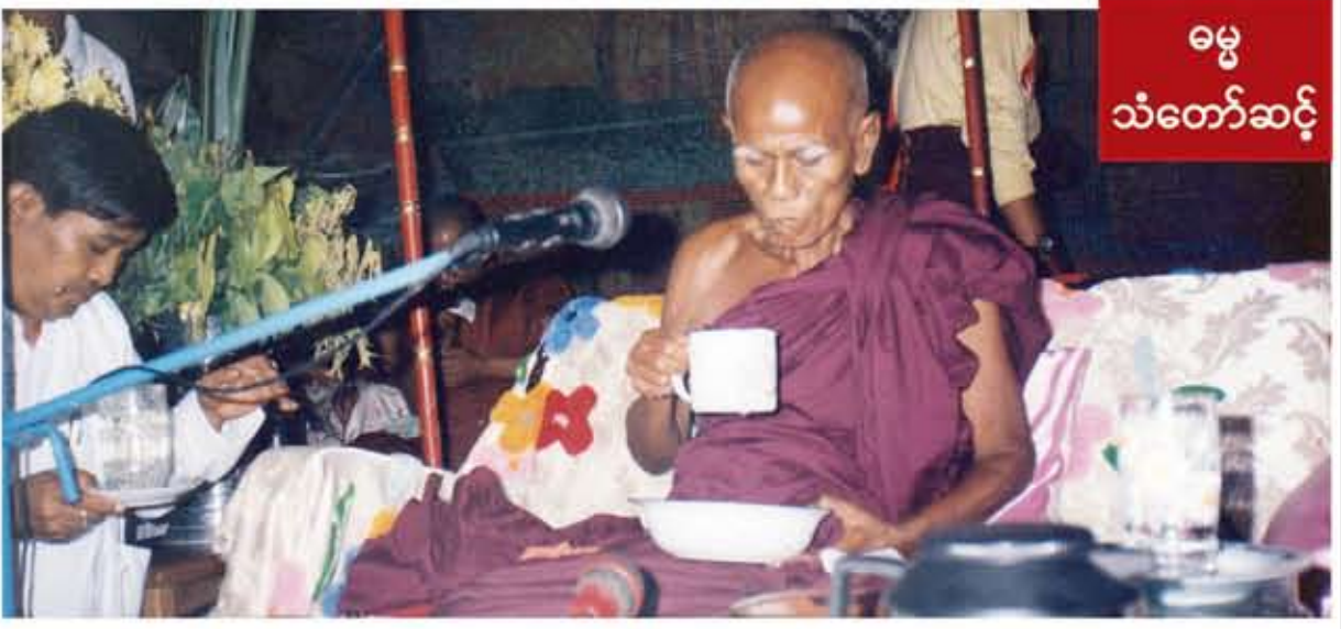
ဓမ္မသံတော်ဆင့်

ရွှေပေါ်ကျွန်းဆရာတော် အဂ္ဂဟာသဗ္ဗတေတိကဝေ ဘဒ္ဒန္တဗျေသိဒ္ဓိဗျဉာဏိက