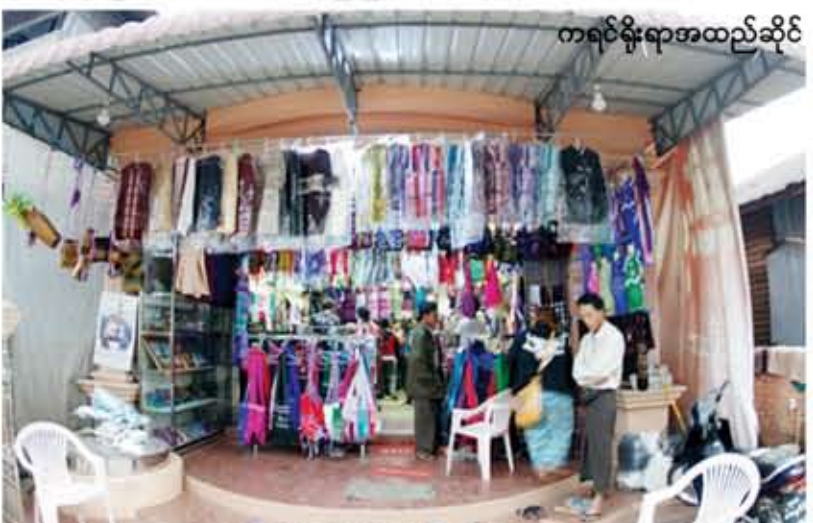
ကရင်ရိုးရာအထည်ဆိုင်

ထောက်အတွက် တည်းခိုသူများရှိကြသဖြင့် တည်းခိုခန်းများတော့ ပိုမိုများပြားလာသည်ကို တွေ့ရသည်။ မြို့လယ်တွင် ကြီးမားသည့်ဟိုတယ် တစ်ခု ဆောက်လုပ်ဆဲတွေ့ရသဖြင့် ကား ဆရာအားမေးကြည့်