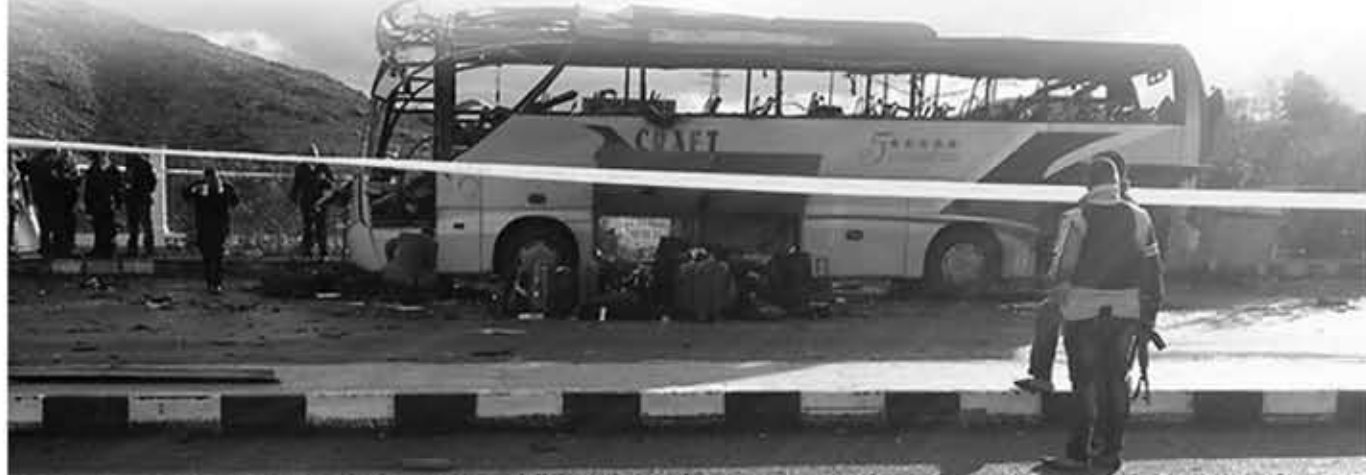
အပတ်စဉ်စနေနေ့တိုင်းထုတ်ဝေသည်

နှင့် အီဂျစ်လူမျိုးတစ်ဦးတို့ကိုတင်ဆောင်လာကြောင်း ဖေဖော်ဝါရီ ၁၇ရက်တွင် တောင်ကိုရီးယားနိုင်ငံခြားရေးဝန်ကြီးကပြောကြားသည်။ တိုက်ခိုက်မှုကြောင့် သေဆုံးခဲ့ရသူများမှာ အဆိုပါတောင်ကိုရီးယားလမ်းပြနှစ်ဦး၊ တောင်ကိုရီးယားကမ္ဘာ့လှည့်ခရီးသည်တစ်ဦးနှင့် အီဂျစ်လူမျိုးယာဉ်မောင်းတစ်ဦးတို့ဖြစ်ကြောင်းတောင်ကိုရီးယားနိုင်ငံခြားရေးဝန်ကြီးဌာန၏ ပြောကြားချက်ကိုကား၍ ယွန်ဟက်သတင်းဌာနကဖော်ပြသည်။ တိုက်ခိုက်မှုအတွင်း ထိခိုက်ဒဏ်ရာရရှိသွားခဲ့သော အခြားတောင်ကိုရီးယားနိုင်ငံသား ၁၄ဦးကို ဆေးရုံတင်ထားရသည်။