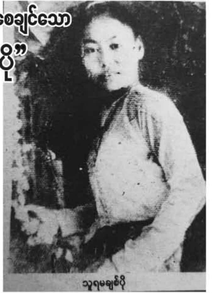
သူရမချစ်ပို

၂၈-၁၁-၂၀၁၄နေ့က ကြံ့ခိုင်ရေးပါတီဒုက္ခကူ-၂ သူရဦးအေးမြင့်သည် စစ်ကိုင်းတိုင်းဒေသကြီး၊ ကလေးခရိုင်၊ မင်းကင်းမြို့နယ်အတွင်းရှိ ရွာအတော်များကို သွားရောက်ပြီး သူစစ်ဗိုလ်ဘဝက စစ်တိုက်ခဲ့ရာ ဗိုလ်ကုန်ထိမှန်ပြီး ကျည်ဆန်မှန်ခဲ့ဖူးလို့ “သူရ”ဘွဲ့ ဆွတ်ခူးရရှိခဲ့ဖူးကြောင်း ရောက်လေရာအရပ်မှာ သူ့ကိုအထင်ကြီးအောင် ကျည်ဆန်ထိမှန်ခြင်းခံရသည့် ဗိုလ်ကုန်ထိမှန်ခဲ့လေသည်။ အမှန်မှာသူ့ရဘွဲ့ရရှိသူပေါင်းမှာ တပ်မတော်၊ ချဲ့ပြည်သူ့အရပ်သား အပါအဝင် (၆၀၀)ကျော်ရှိကြောင်း သိရပါသည်။ သူ့ရဘွဲ့ရရှိသူများအနက် မြန်မာ့သမိုင်းတွင် ပြင်ဦးလွင်မှ တစ်ဦးတည်းသော အမျိုးသမီးသူရဲကောင်း သူရမချစ်ပို တစ်ယောက်အပါအဝင် ဖြစ်ပါသည်။ ထို့ကြောင့် သူရဦးအေးမြင့် သူ့ရဘွဲ့ရသည်မှာ အဆန်းမဟုတ်ပါ။