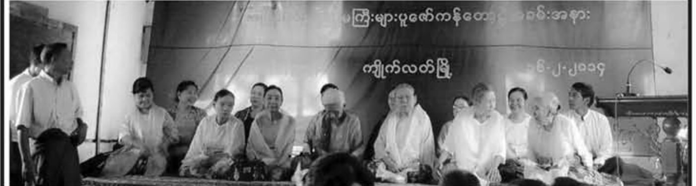
ဧရာဝတီတိုင်းဒေသကြီး၊ ကျိုက်လတ်မြို့နယ်၊ အမှတ်(၅)ရပ်ကွက်၊ ဦးသိန်းမောင်ပူလတန်းကျောင်း ပထမအကြိမ် သက်ကြီးဆရာ/ဆရာမကြီး များအား ပူဇော်ကန်တော့ပွဲကို ဖေဖော်ဝါရီ ၁၆ ရက်နေ့က ပြုလုပ်ခဲ့သည်ကိုတွေ့ရစဉ် (သတင်းတတ်ပုံ- ဖေဖော်ဝါရီ)