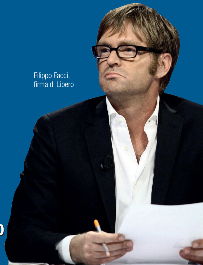
Filippo Facci, firma di Libero