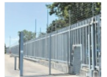
CPR Gradisca d'Isonzo