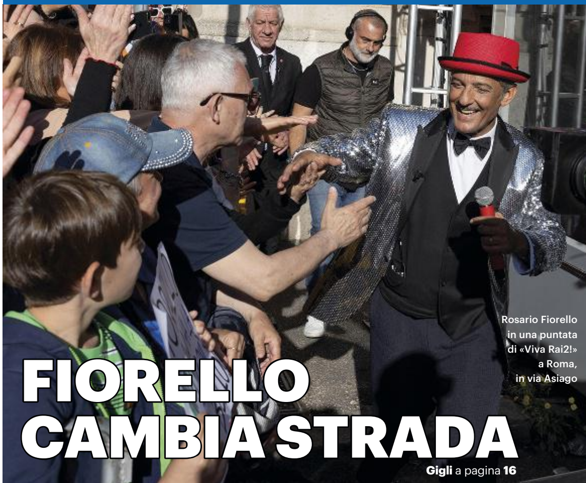
Rosario Fiorello in una puntata di «Viva Rai2!» a Roma, in via Asiago

LA TRASMISSIONE CULT «VIVA RAI2!» LAScerà VIA ASIAGO DECISIVE LE POLEMICHE CON I RESIDENTI PER IL RUMORE