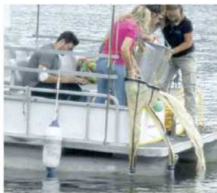
La raccolta delle plastiche a Piediluco