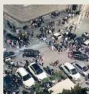
Movida in centro storico

Umbertide Chiuso il centro sfollati, ora tutti hanno una casa