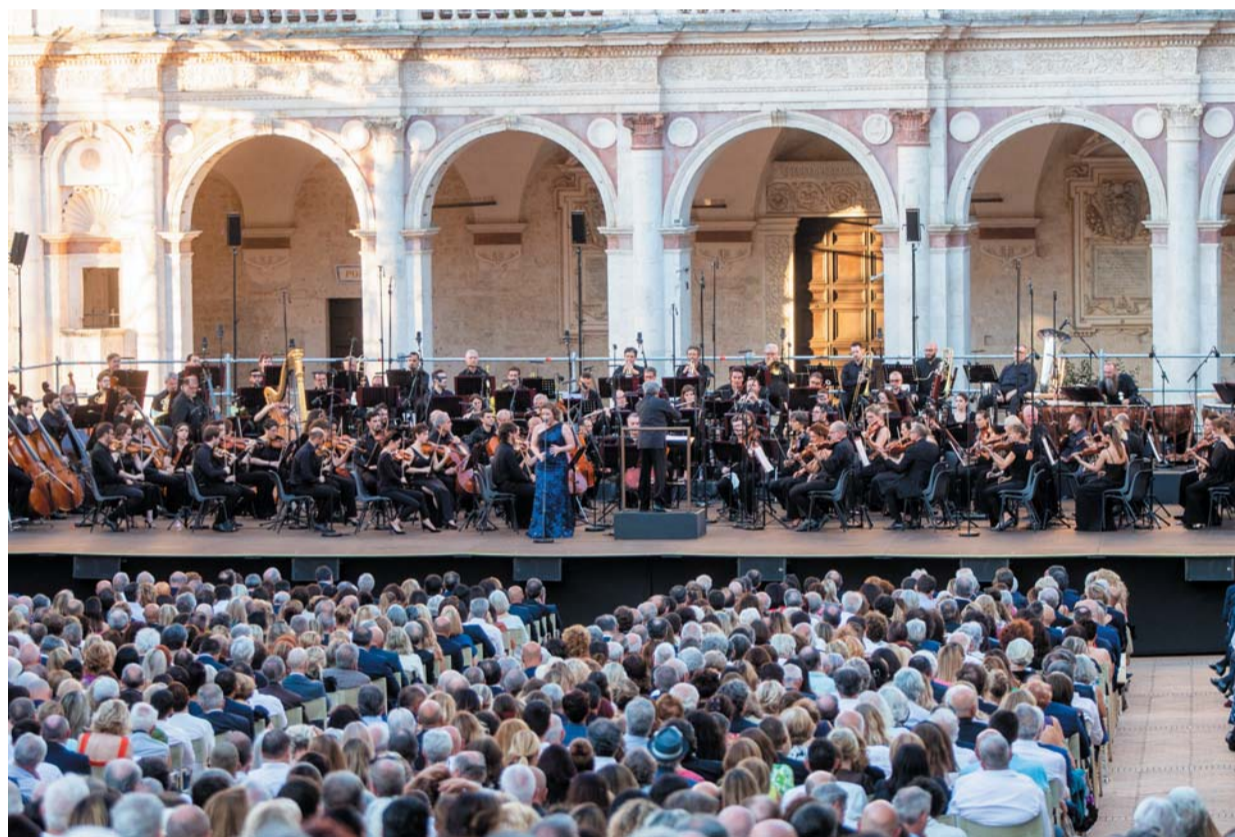
Concerto finale Il mezzosoprano Cooke e il maestro Pappano hanno eseguito due capolavori di Gustav Mahler