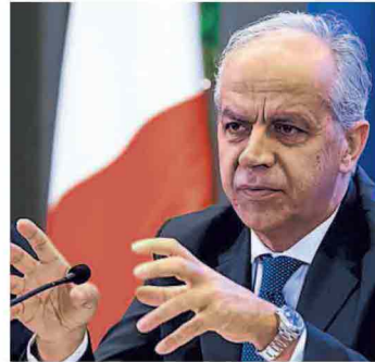
▲ Il ministro dell'Interno Matteo Piantedosi

● alle pagine 2 e 3 con i servizi di Candito, Ciriaco, Conte e Puledda ● alle pagine 6 e 7