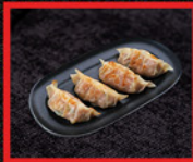
GYOZAS DE CERDO