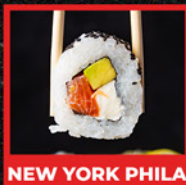
NEW YORK PHILA

Salmón, palta y queso crema envuelto en sésamo.