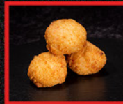
CROQUETAS DE CANGREJO

Pasta de cangrejo con un toque de salsa tártara, apanado en panko.