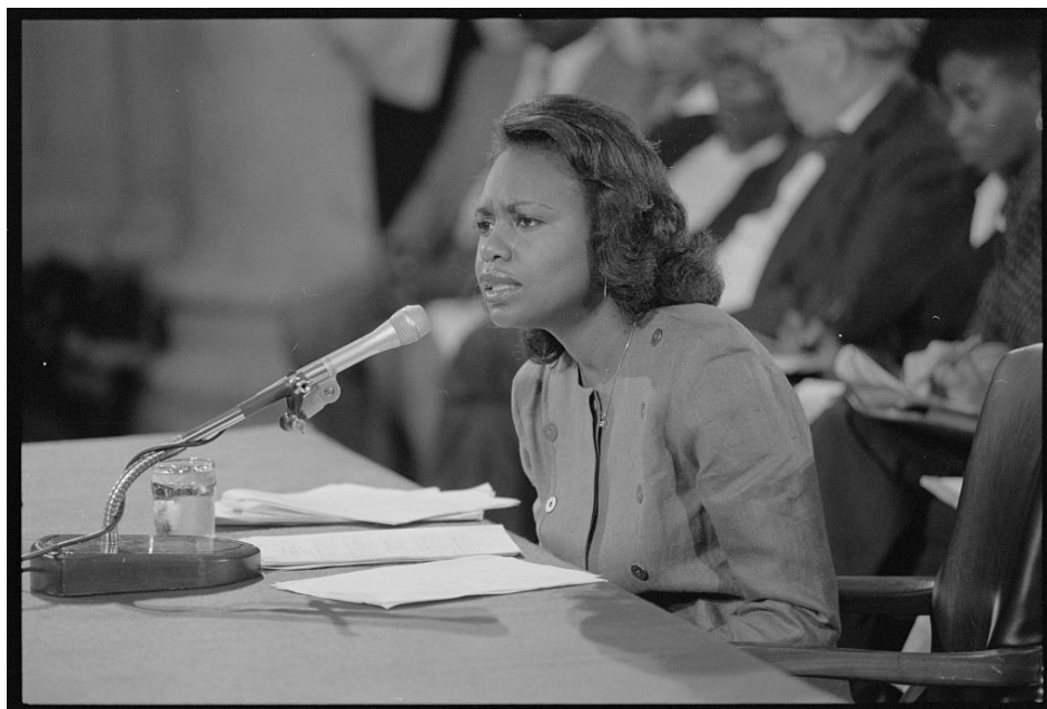
รูปภาพที่ 2: แอนนิตา ฮิลล์ขณะชี้แจงต่อคณะกรรมการยุติธรรมแห่งวุฒิสภา 29

อย่างไรก็ดี ช่วงการรับฟังความเห็นยุคนั้นถูกวิพากษ์วิจารณ์เรื่องความยุติธรรมในการเรียกพยานของทั้งสองฝ่าย ในขณะที่พยานของฝ่ายสนับสนุนความบริสุทธิ์ของผู้พิพากษาโทมัสถูกเรียกไปให้การต่อคณะกรรมการฯ และมีการถ่ายทอดสดทางโทรทัศน์ แต่พยานสองคนที่สนับสนุนฮิลล์กลับถูกคณะกรรมการฯ ปฏิเสธ โดยให้เหตุผลถึงความน่าเชื่อถือของพยานและความเป็นส่วนตัวของผู้พิพากษาโทมัส นอกจากนี้ องค์ประกอบของคณะกรรมการที่เป็นผู้ชายทั้งหมดและไม่มีวุฒิสภาผู้หญิง 30 ทำให้การตั้งคำถามของวุฒิสมาชิกชายต่อฮิลล์ได้สร้างความลำบากใจและมีการใช้คำพูดที่ไม่เหมาะสมและไม่คำนึงถึงตัวตนผู้กล่าวหาที่เป็นผู้หญิง ทั้งจากวุฒิสภาฝ่ายเดโมแครตที่คัดค้านโทมัสและฝ่ายรีพับลิกันที่สนับสนุนโทมัส เช่น วุฒิสมาชิกอาร์เลน สเปคเตอร์ (Arlen Specter) จากพรรครีพับลิกันกล่าวว่า “คำแถลงของคุณในช่วงเช้าเกี่ยวกับคำถามที่เกี่ยวข้องกับการคุกคามทางเพศมากที่สุด แท้จริงแล้วมันไม่ใช่เรื่องแย่งขนาดนั้น อย่างหน้าอกขนาดใหญ่ของผู้หญิง คำนี้เราใช้กันเป็นปกติตลอดเวลา นั้นเป็นแง่มุมคุกคามที่สุดที่ผู้พิพากษาโทมัสได้พูดกับคุณ” (“You testified this morning that the most embarrassing question involved — this is not too bad — women's large breasts. That is a word