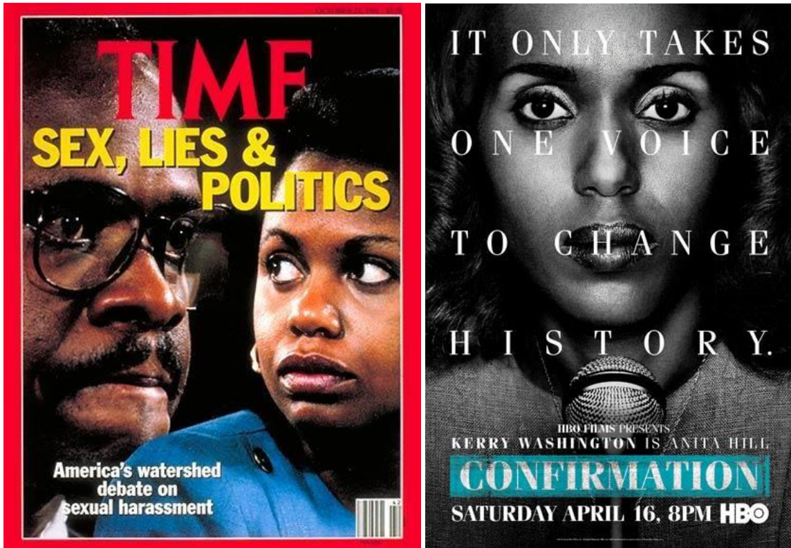
รูปภาพที่ 3: ภาพหน้าปกนิตยสาร Time ฉบับวันที่ 12 ตุลาคม ค.ศ. 1991 ลงภาพแอนนิตา ฮิลล์