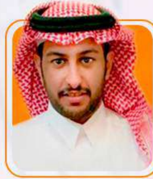
عضو سعود بن نايف الخالدي