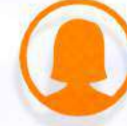
شاغر إدارة نظم المعلومات