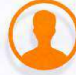
شاغر الرئيس التنفيذي