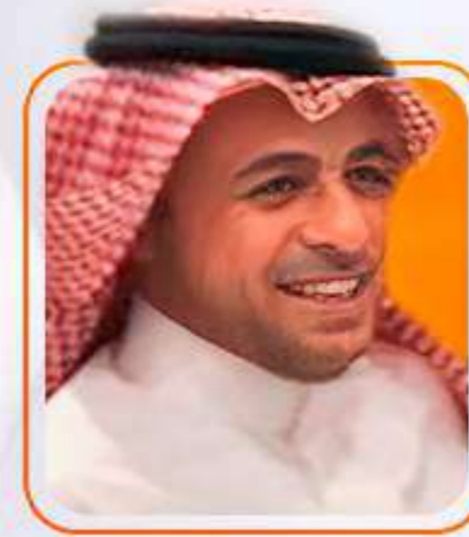
نائب الرئيس نواف بن صدي الخالدي