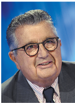
Carlo De Benedetti

Insomma, non è che De Benedetti porti sfiga, e neppure c'entra l'annebbiamento dovuto all'età (tra poco per lui sono novanta), no è proprio che non ha mai capito un tubo, nessuno dotato di un minimo di lucidità può passare da fan di Matteo Renzi a supporter di Elly Schlein. Per questo è una bella notizia che nella sua sfera di cristallo tarocca l'ingegnere veda l'imminente fine della «faccetta» Giorgia Meloni. Che poi in quanto a facce, bé con quel suo faccione di bronzo o se preferite di tolla, all'ingegnere già ufficialmente massone e poi imprenditore sempre sull'orlo del fallimento, che gli importa di ciò che succede in Italia visto che lui da tempo si è trasferito armi, bagagli e tasse in Svizzera? Suvvia ingegnere, lei è veramente una faccia di... (frase da completare a piacimento dai lettori in base alla propria sensibilità).