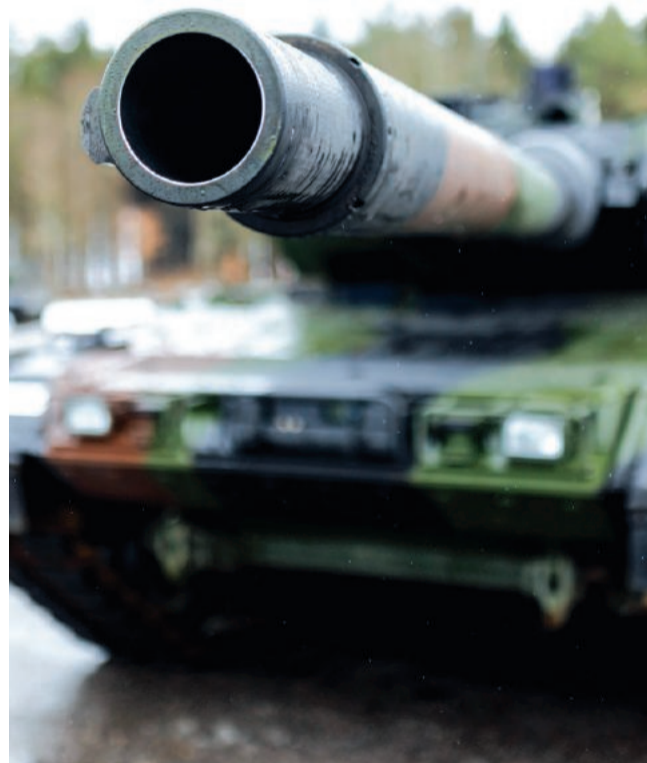
Attenti Pressing di industrie e politica sulla spesa militare

■ Dietro il voto-scandalo sull'Asap, il ruolo dell'Asd guidata da Profumo, gli amici di Crosetto, le porte girevoli fra aziende e cariche pubbliche, la disinvoltura del commissario Breton