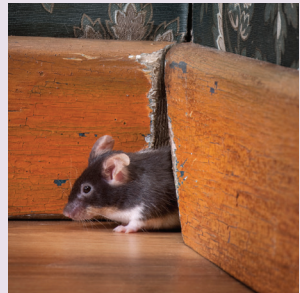
Șoarecele de casă ( Mus musculus )

Aceste rozătoare sunt cunoscute sub denumirea de rozătoare sinantropice comensale , ceea ce în mod literal înseamnă că „trăiesc de pe urma meselor oamenilor”. Și-au adaptat comportamentul și obiceiurile de hrănire pentru a putea supraviețui în satele, orașele și habitatele noastre umane.