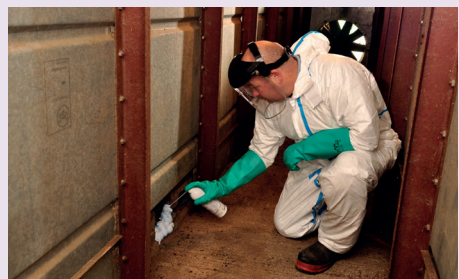
Racumin® FOAM aplicat într-un orificiu de intrare

8. Pentru ca rozătoarele să poată folosi în continuare intrările, nu sigilați complet orificiul cu spuma, lăsați o deschidere la vedere.