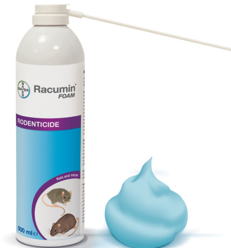
Imagine cu scop ilustrativ, recipientul poate avea caracteristici diferite

Racumin® FOAM este un rodenticid de ultimă generație, care are la bază ingredientul activ coumatetralyl, un anticoagulant din familia warfarinelor, ce și-a demonstrat, în timp, eficacitatea, dobândindu-și un bine-meritat renume în lupta împotriva rozătoarelor.