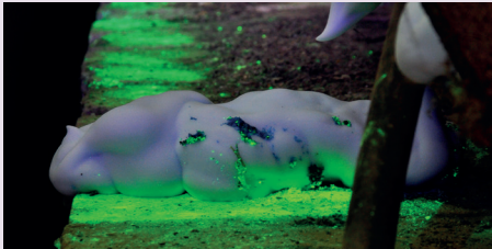
Gol inaccesibil în perete.