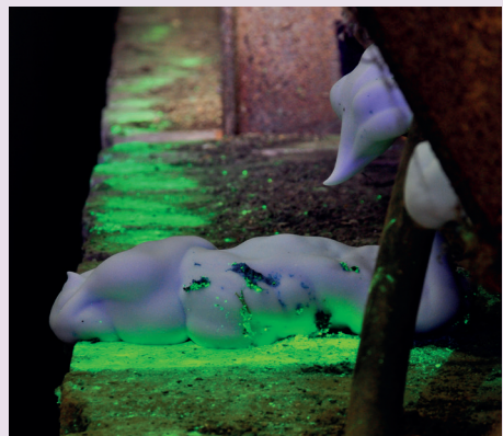
Racumin® FOAM aplicat într-un gol de perete inaccesibil