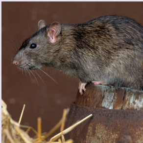
Șobolanul de canalizare ( Rattus norvegicus )