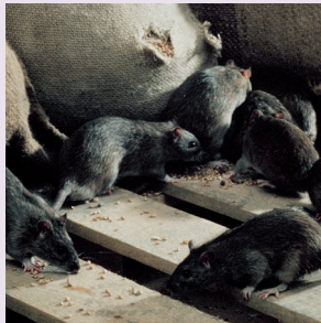
Șobolanul negru de casă ( Rattus rattus )