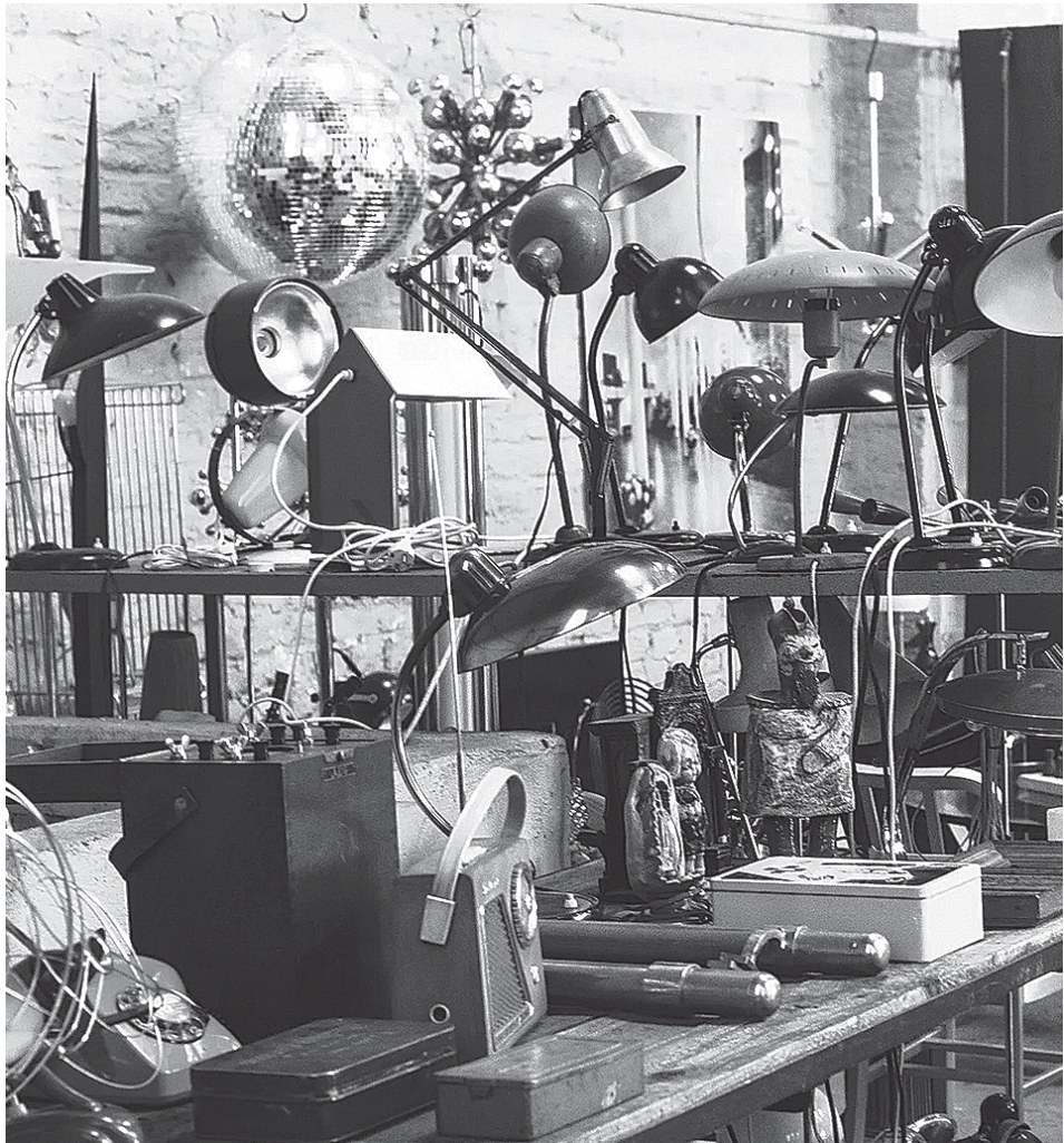
დასასრული მე-12 გვერდზე

— მე კურტკებზე ჩავიბრუნე, მერე რიგი დადგება, — დაიძახა ვაკომ. გავხედე და გაქრა.