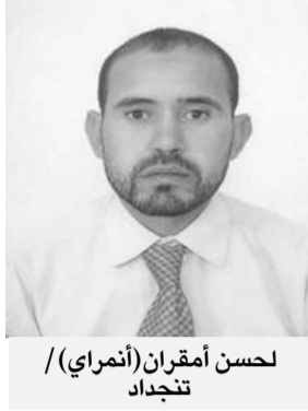
لحسن أمقران (أنماري) / تنجداد

أسس على باطل فمآله البطلان، عقيد جنا على مواطنيه كما جنا على جيرانه وأشقائه فمسخ وطننا الكبير و اصطنع أمورا واهية لخلق صراعات مفتعلة مقبته، رمز لأنذاب المستعمر الحقيقيين الذين لم يهتموا يوما لواقع و معاناة المواطن المغربي بل لزرع الفتنة والتضليل واختلاق كيانات وهمية في صفوف الشعب المغربي الموحد. إن هوية المغرب الكبير لم و لن تكون باللغة أو العرق، إنها هوية الأرض التي لا تنطق لكنها لا تموت، ألم يان لحكامنا، مفكرينا، ساستنا، متقفينا و عموم شعبنا المغربي أن يقول بصوت واحد: كفى من المسخ!!! كفى من التثقيب!!! كفى من الطمس!!! هويتنا المغاربية هي الكفيلة بضمان وحدتنا و تماسكنا و تكتلنا!!! لا تريد أيديولوجيات مستقدمة دخيلة، لا للشرقنة و لا للتغريب. لنمد أيدي بعضنا للبعض و نقول معا: عاش المغرب الكبير، عاش الشعب المغربي العظيم، سحقا لدعاة المسخ و الولاء المقبت لإيديولوجيات غريبة غريبة عنا في كل شيء، و أخرى شرقية تعاني في عقر دارها.