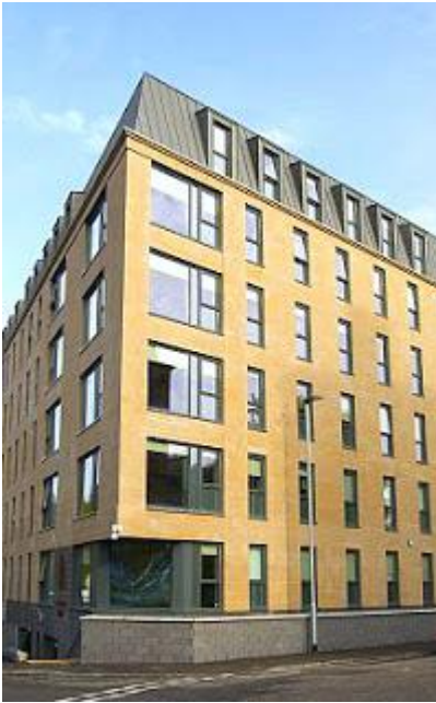
Woodside House à Glasgow, en Écosse.

Bakr est le président du Groupe Ben Laden Arabie (Saudi bin Ladin Group) qui possède beaucoup de propriétés.