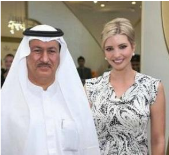
Ivanka et Shafiq ben Laden

◦ “Ivanka Trump a été bénie par un rabbin qui a dit que les femmes qui s’habillent impudiquement sont comme des animaux “