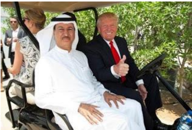
Donald Trump s'amuse avec son ami Shafiq ben Laden, un demi frère d'Oussama ben Laden

[Le frère d'Oussama ben Laden propriétaire de logements pour étudiants écossais – 2016]