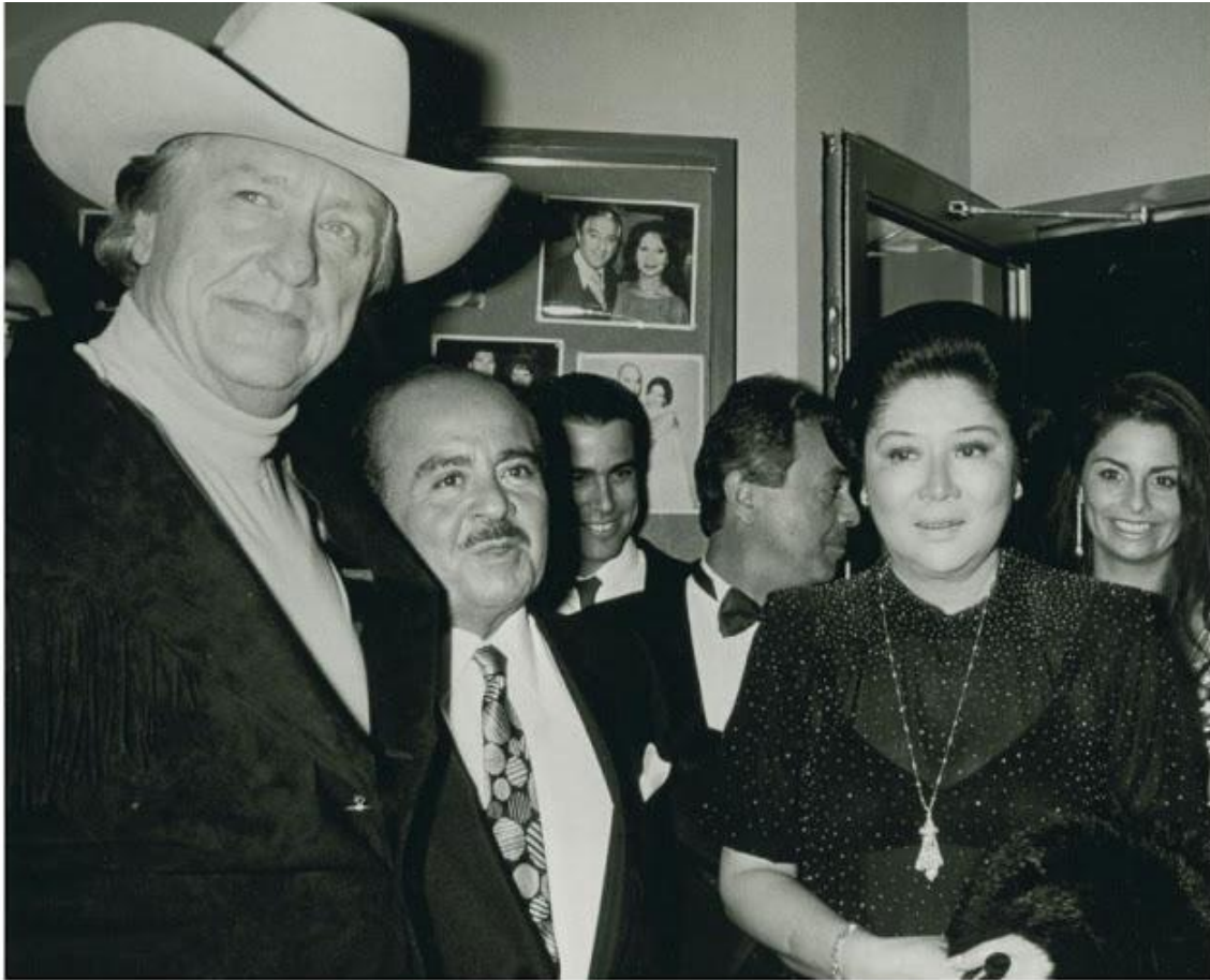
Avocat Gerry Spence, Arabe marchand d'armes Adnan Khashoggi et ancienne première dame des Philippines Imelda Marcos a posé pour une photo le 2 Juillet 1990 , au restaurant du Nil à New York City. Khashoggi était une figure centrale dans la pièce de Lombardi, "Oliver North, Lake Resources du Panama, et l'Opération Iran-Contra" , qui a regardé les connexions entourant le scandale Iran-Contra.