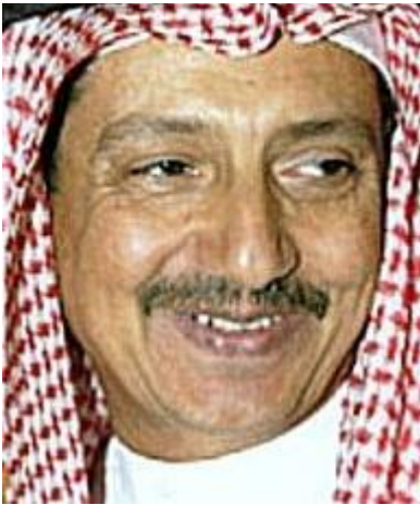
Bakr Mohammed ben Laden

Bakr Mohammed ben Laden est le frère d'Oussama ben Laden.