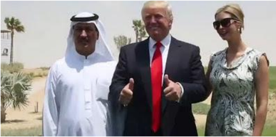
Trump s'amuse plus avec son ami Shafiq ben Laden (et sa fille Ivanka).