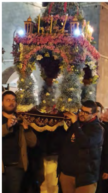
Η «περιφορά» του επιταφίου

Το φετινό μεγαλοβδόμαδο και το Πάσχα γιορτάστηκαν χωρίς καμία δέσμευση και περιορισμό εξαιτίας της πανδημίας, όπως συνέβη τα προηγούμενα τρία χρόνια, με αποτέλεσμα μεγάλος αριθμός επισκεπτών να κινηθεί προς την επαρχία και τα ολιγάνθρωπα χωριά της Γορτυνίας να «γεμίσουν» από απόδημους και επισκέπτες και να δημιουργηθούν εικόνες, οι οποίες θύμισαν τις δεκαετίες του πενήντα και του εξήντα, τότε που η Γορτυνία αριθμούσε τριπλάσιους κατοίκους από τους σημερινούς. Τη μεγάλη επισκεψιμότητα έδειχναν από νωρίς οι προκρατήσεις στα καταλύματα και ιδιαίτερα της Βυτίνας, η οποία διαθέτει τα μισά και πλέον ξενοδοχεία όλης της Γορτυνίας. Αυτό τον μεγάλο αριθμό των επισκεπτών ενίσχυσαν οι αφίξεις πολλών αποδήμων, οι οποίοι επέλεξαν να περάσουν τις πασχαλινές γιορτές κοντά στους συμπατριώτες τους, να ανοίξουν τα πατρικά τους σπίτια και να θυμηθούν τα παιδικά τους χρόνια.