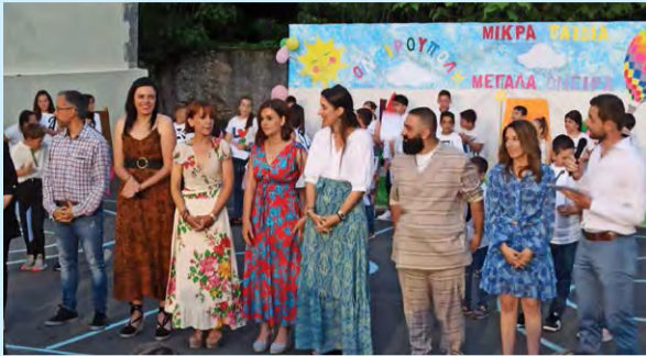
Το εκπαιδευτικό προσωπικό του σχολείου.