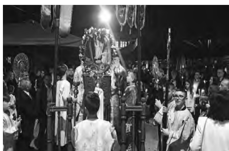
Η τελετή της Ανάστασης

Μετά την «Ανάσταση» πολλοί έφυγαν, αφού αντάλλαξαν τις пасχαλινές ευχές, για το σπίτι ή τα εστιατόρια, για να γευτούν την πατροπαράδοτη μαγειρίτσα, ενώ λιγότεροι επέστρεψαν στο εσωτερικό της εκκλησίας, για να παρακολουθήσουν την αναστάσιμη λειτουργία, η οποία ολοκληρώθηκε στις 02.00 μεταμεσονύχτια. Η Κυριακή ξημέρωσε με τους καπνούς να βγαίνουν από αρκετές αυλές, στις οποίες ετοιμάζονταν οι πασχαλινές ψησταριές και οι οποίες φέτος παρά τις προβλέψεις ήταν αρκετές. Η μεγάλη κίνηση άρχισε να σημειώνεται λίγο πριν από το μεσημέρι και τις μεσημβρινές ώρες δεν έβρισκες καρέκλα να καθίσεις στις καφετέριες, ενώ στα εστιατόρια παρατηρήθηκε το αδιαχώρητο! Να σημειώσουμε εδώ ότι εκτός από τα παραδοσιακά εστιατόρια και τις ταβέρνες, εορταστικό πασχαλινό γεύμα προσέφεραν και τα μεγάλα ξενοδοχεία ύπνου, τα οποία διαθέτουν εστιατόριο.