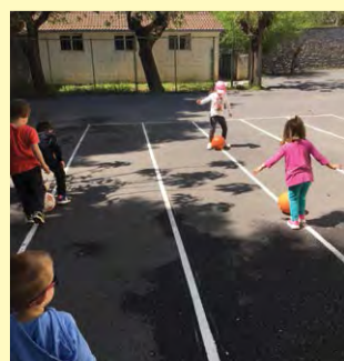
Σαββατιάτικες παιδικές δράσεις στο προάυλιο του δημοτικού σχολείου.

Οι «παιδικές δράσεις» όπως τις ονομάζει περιλαμβάνουν επιτραπέζια παιχνίδια, αθλοπαιδιές, ζωγραφική και άλλες παρόμοιες δραστηριότητες. Σε μια από τις αναρτήσεις του στο facebook ο όμιλος περιγράφει τις δράσεις αυτές ως εξής: «Σήμερα 3/6/23 οι παιδικές δράσεις έγιναν εξ ολοκλήρου στην αυλή του Δημοτικού σχολείου Βυτίνας, για να χαρούμε την λιακάδα. Ξεκινήσαμε με παιχνίδια με μπάλες, συνεχίσαμε με ψάρεμα και με το βαλιτσάκι των θησαυρών, παίξαμε jenga (παιχνίδι ισορροπίας με κύβους), παρατηρήσαμε τα έντομα στον τοίχο και μετά τις κατασκευές με τα αγαπημένα Lego, βάψαμε με κιμωλίες πλάκες της αυλής». Στις «δράσεις» αυτές παίρνουν μέρος αρκετά παιδιά και αποτελεί σημαντική ψυχαγωγική εκδήλωση για τους μικρούς «μπόμπιρες». Το Σάββατο 24 Ιουνίου, παραμονή των εκλογών, οι «παιδικές δράσεις» πραγματοποιήθηκαν στο δασάκι σε μια προσπάθεια να καλωσοριστεί το καλοκαίρι αλλά και να αποκτήσουν οι μικροί φίλοι του ομίλου οικολογική συνείδηση.