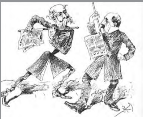
Χαρακτηριστική γελοιογραφία του τύπου της εποχής, η οποία δείχνει τον φανατισμό που επικρατούσε στις αναμετρήσεις Τρικούπη- Δεληγιάννη.

Από το 1843 μέχρι το 1863 που εκθρονίστηκε ο Όθωνας εκλογές διεξήχθησαν τα έτη 1844, 1847, 1850, 1853, 1856, 1859, 1861, και 1862. Την περίοδο αυτή μεσουράνησαν οι πολιτικοί Αλέξανδρος Μαυροκορδάτος, ηγέτης του Αγγλικού κόμματος, Ιωάννης Κωλέττης, ηγέτης του Γαλλικού κόμματος και Ανδρέας Μεταξάς ηγέτης του Ρωσικού κόμματος. (Μέχρι τότε τα κόμματα έπαιρναν την ονομασία τους ανάλογα με τον εξωτερικό προσανατολισμό τους προς τις Μεγάλες δυνάμεις). Οι εκλογές την εικοσαετία αυτή διεξάγονταν σε κλίμα φανατισμού, ενώ οι καταγγελίες για νοθείες και αλλοιώσεις του αποτελέσματος ήταν διαρκείς. Πρωθυπουργοί του διάστημα αυτό διετέλεσαν ο Ιωάννης Κωλέττης, ο Αντώνιος Κριεζής, ο Δημήτριος Βούλγαρης ή «Τζουμπές» (λόγω της μεγάλης καλπονοθείας), και ο Αθανάσιος Μιαούλης. Στις εκλογικές αναμετρήσεις ψήφιζαν μόνο οι άνδρες άνω των 25 ετών και η περίοδος σηματοδότηκε από τον Κριμαϊκό πόλεμο, τον αποκλεισμό του Πειραιά από τις μεγάλες δυνάμεις και την «υπόθεση Πατίφικο».