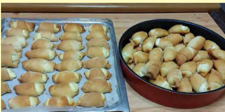
Το «κολασιό» της εκδρομής που ετοίμασαν μέλη του συνδέσμου