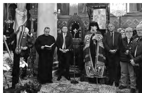
Η τελετή της Αποκαθήλωσης

την κωμόπολη, ενίσχυσαν οικονομικά την τοπική αγορά και δημιούργησαν ενθαρρυντικό κλίμα για τους μόνιμους κατοίκους, οι οποίοι ένιωσαν ότι ο τόπος τους έχει μέλλον και προοπτική. Στο ίδιο κλίμα πέρασε και η Δεύτερη μέρα του Πάσχα, ενώ η επιστροφή άρχισε από το μεσημέρι της Δευτέρας.