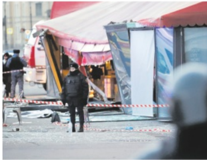
ESPLOSIONE L'esterno del locale dove ha perso la vita Vladen Tatarsky

Appunto, una politica sulle nuvole condita dalle campagne sui diritti civili e il ritorno alle polemiche sul fascismo: tutti argomenti che possono scaldare i militanti, recuperare il voto ideologico catturato dai 5stelle, ma esulano del tutto dai problemi della governabilità. Tant'è che la segretaria del Pd ha rimesso nel cassetto l'idea di un «governo ombra», anzi ne ha smentito ogni paternità. Magari la Schlein avrà fatto i suoi calcoli, visto che l'idea di entrare nella stanza dei bottoni è preclusa nei prossimi quattro anni, meglio dedicarsi alle piazze. Solo che rischia di lasciare orfana l'unica classe dirigente di governo che le è rimasta, quella che ha nei comuni.