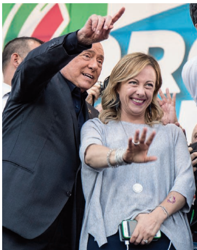
Impunità Silvio Berlusconi e Giorgia Meloni

■ Il ddl fatto presentare da Noi Moderati di Lupi abolisce, con la scusa della privacy, l'obbligo di allegare le condanne (e le interdizioni) alle candidature: è meglio che gli elettori non sappiano