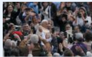
Marsico a pagina 11

Vaticano Abbraccio al Papa dopo lo spavento Domenica delle Palme tra i fedeli per Francesco Oltre 60mila a San Pietro