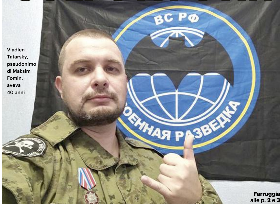
Vladlen Tatarsky, pseudonimo di Maksim Fomin, aveva 40 anni