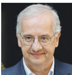
PENSATORE Walter Veltroni

Caro Veltroni, altro che maestro... riesce perfino a prevedere il futuro