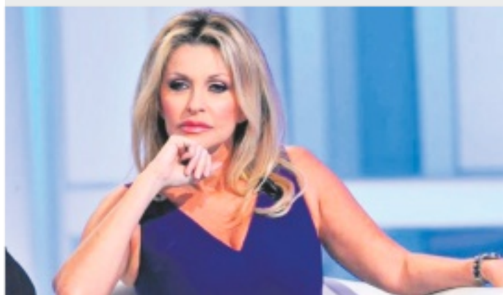
AGGUERRITA La giornalista Rai Paola Ferrari, 62 anni