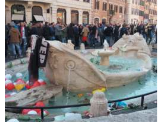
Zavatta a pagina 9

Allarme ultras del Feyenoord Paura dei negozianti «Vanno tenuti lontano dal centro storico»