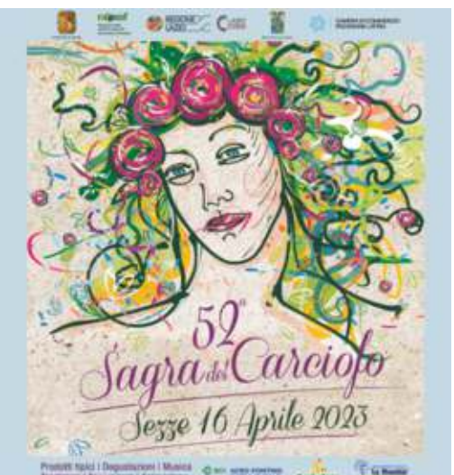
a pagina 8

COMMENTI DELL'ARIA La tecnologia non si può fermare Serve l'Onu VILLOIS Uguali attenzioni per partite Iva e dipendenti MAZZONI Un altro 25 aprile in trincea