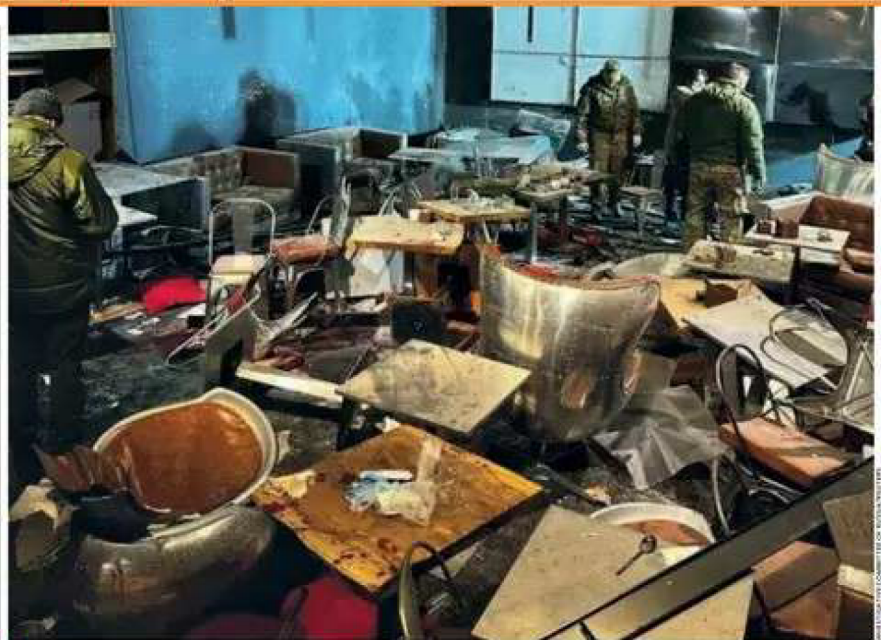
Il locale Lo "Street food bar 1" di San Pietroburgo dopo lo scoppio dell'esplosivo contenuto in una statuetta

a pagina 2 con un servizio di Daniele Raineri a pagina 4