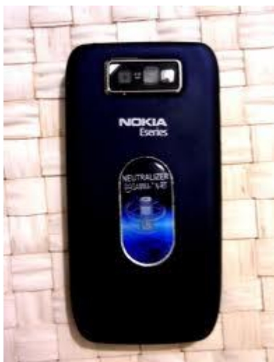
fig.4 NEUTRALIZATOR PENTRU MOBIL GAMMA –