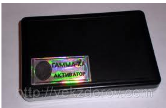
fig.3 ACTIVATOR GAMMA -7