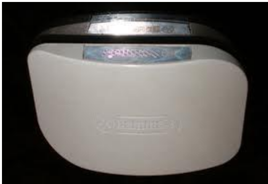
fig.2 Neutralizator GAMMA – 7

FIG. B – persoana aflata sub protectia aparatului GAMMA 7, campul energetic s-a marit de 3 ori, simetria de la 65% la 73,4%. Aparatele ofera persoanei protectie impotriva factorilor energo-informationali negative, vampirismului intentionat si inconstient, purificarea spatiilor, bauturilor, alimentelor, asigura rezistenta psihica impotriva stresului, ofera protectie impotriva campului electro-magnetic al aparatelor, asigura o buna functionare a partii electrice a autoturismelor.