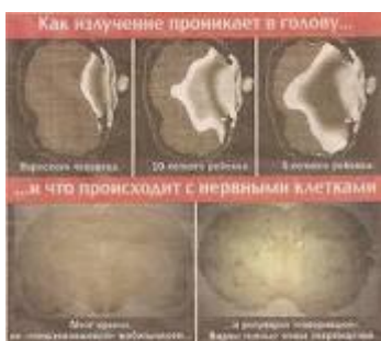
fig,6 partea de jos arata creierul de sobolan(

Creierul unui matur, copil de 10 ani, copil de 5 ani. Cu cat individul este mai tanar cu atat mai multe radiatii absoarbe creierul, datorita conductibilitatii electrice sporite.