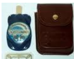
fig.5 NEUTRALIZATOR PENTRU AUTOMOBIL

GAMMA – 7-AC , elimina stresul in timpul conducerii automobilului, protejaza de zonele patogene, elimina oboseala, refacere rapida dupa effort fizic si psihic, reface sistemul simpatico-parasimpatic, imbunatateste parametrii functionali ale sistemului cardio-vascular. N a fost verificat in institutii de profil in Rusia si Germania.