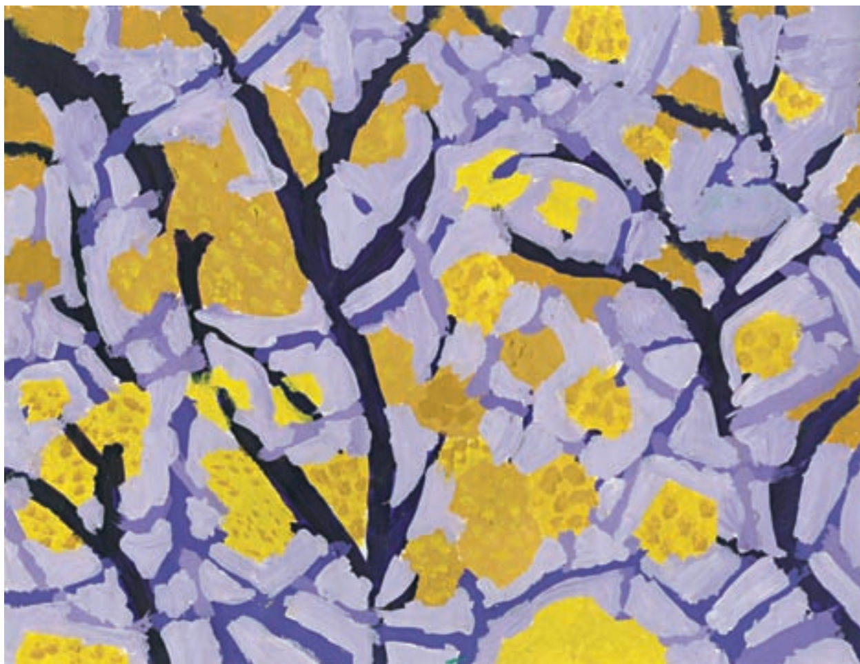
Diana Kajtazi , 5. razred, OŠ Obrovac, Obrovac, učiteljica: Vasiljenka Šoša