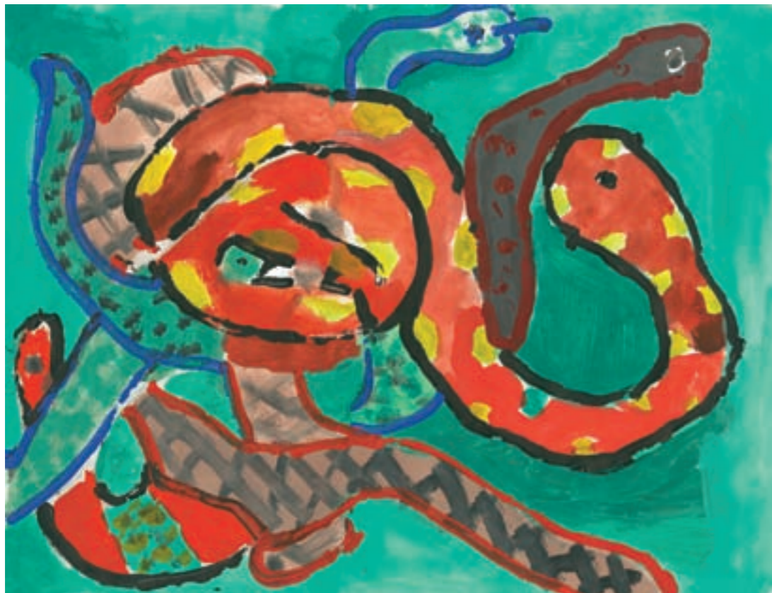
Marela Hrkač , 6. razred, OŠ Bedekovčina, Bedekovčina, učiteljica: Ljiljana Siketić