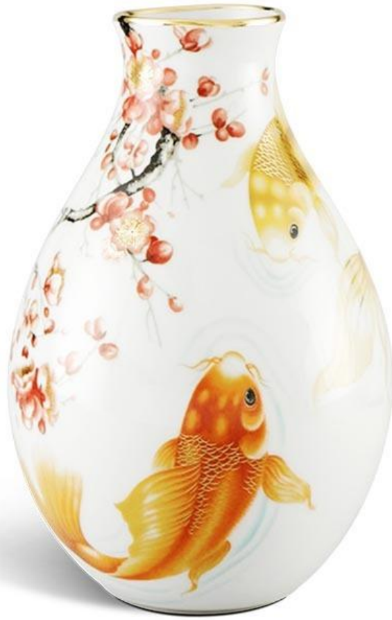
Bình hoa Minh Long Cá Chép