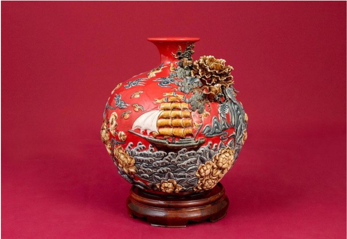
Bình Hoa Tài Lộc Men Rạn Đắp Nổi Thuyền Biển S2