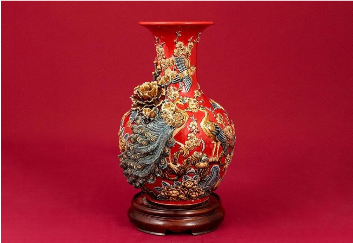
Bình Hoa Tài Lộc Men Rạn Đắp Nổi Chim Công Xanh S1

Đặc biệt vô cùng thích hợp trong việc trưng bày tại phòng khách, phòng làm việc của gia chủ phải phù hợp cho người mệnh Hỏa!