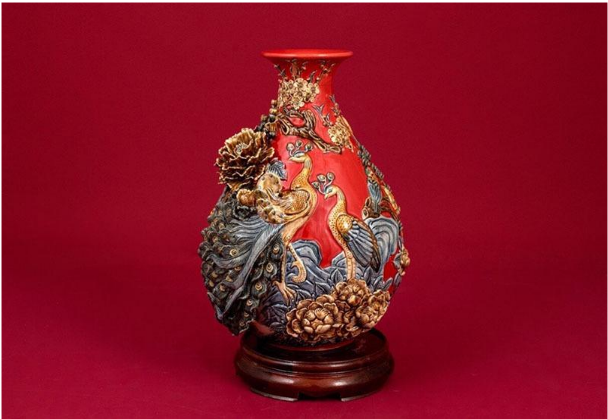
Bình Hoa Tài Lộc Men Rạn Đắp Nổi Chim Công Xanh S4