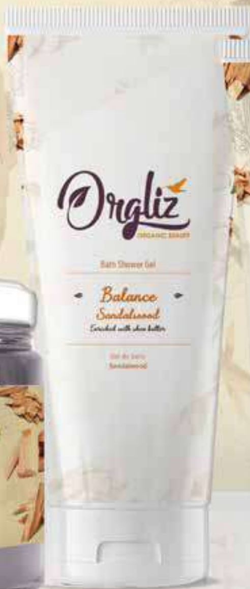
Bath Shower Gel