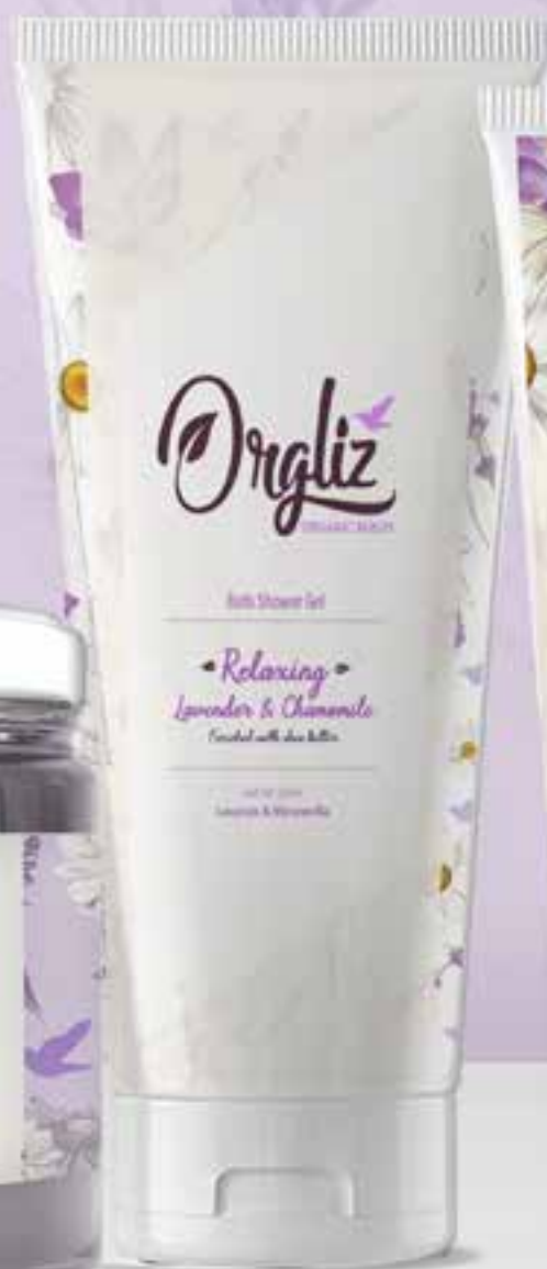
Bath Shower Gel