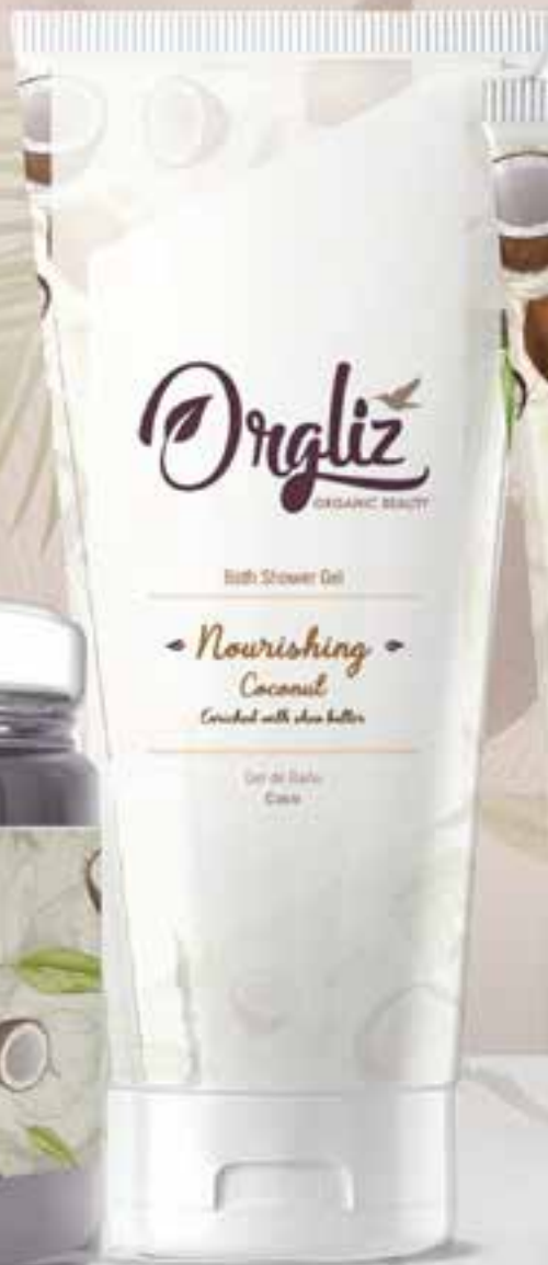
Bath Shower Gel