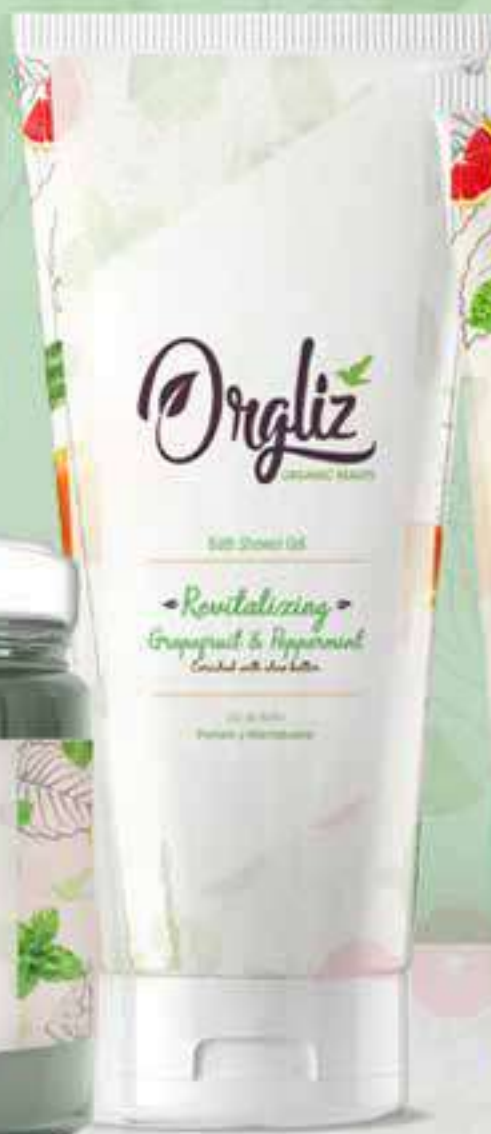
Bath Shower Gel