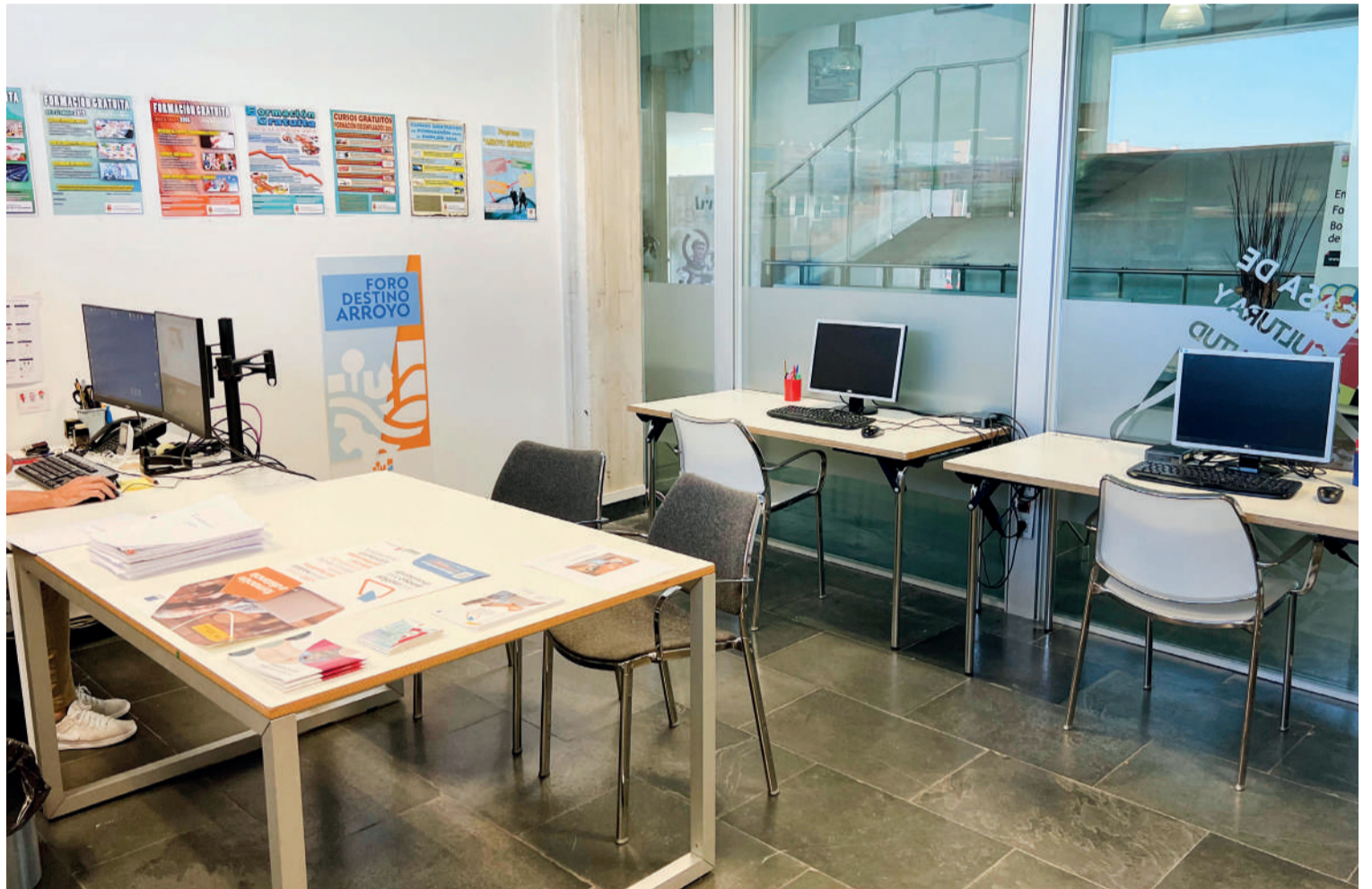
Instalaciones del Aula Mentor situadas en la Casa de la Cultura, en la calle Clavel. ENA

Se trata de formación online y tutorización personalizada sobre programación en redes y ciberseguridad, que se desarrollarán entre los meses de septiembre y enero