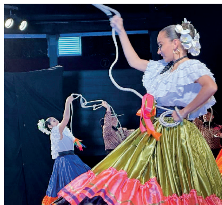
Sobre esta línea, un momento de la actuación del grupo de Bosnia. A la derecha, los grupos con el alcalde y abajo los bailarines del grupo de danza de Costa Rica. ENA