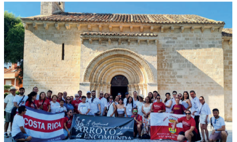
Los integrantes de la Asociación Bellavista y los grupos de danza invitados pasan unos días de convivencia compartiendo comidas y excursiones. ENA