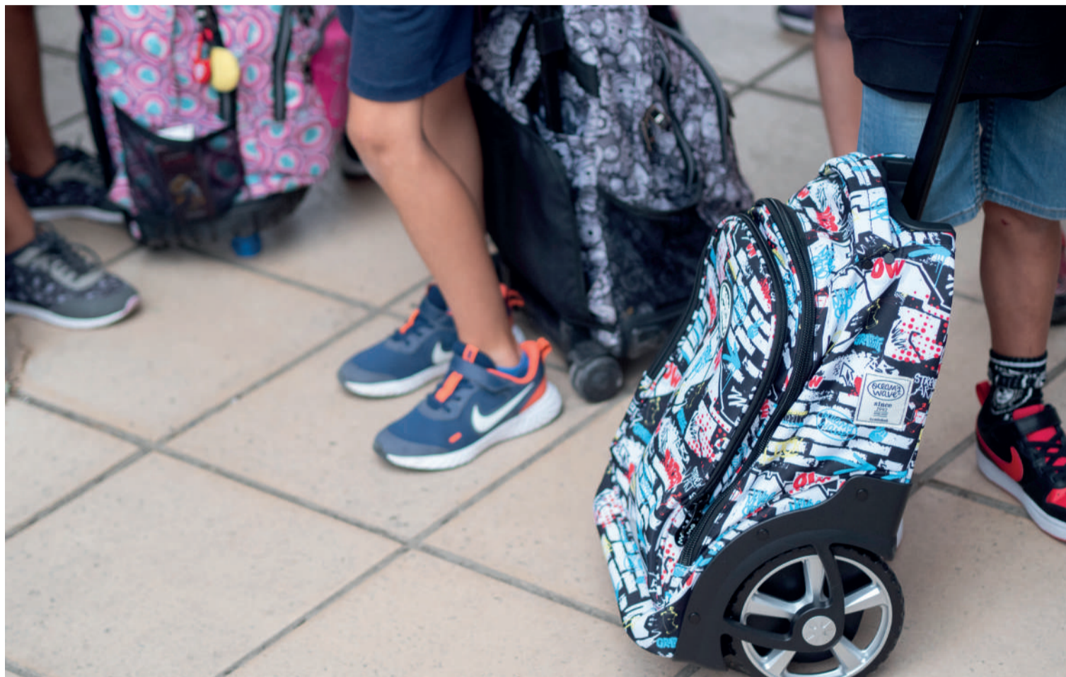
Foto de archivo de la entrada al cole de los alumnos de Arroyo durante el primer día de clase con sus mochilas nuevas.

El plazo para solicitar las ayudas se abre el 18 de septiembre hasta el 31 de octubre y las compras deben realizarse entre el 1 de julio y el 31 de octubre en comercios locales