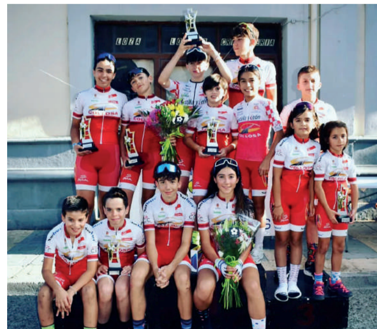
El equipo Collosa posa con las copas y medallas obtenidas en Carcedo de Burgos.