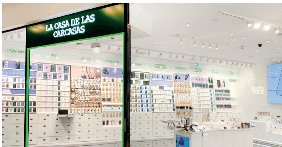
La marca extremeña de venta de accesorios para dispositivos móviles abrió sus puertas el 31 de julio. ENA

El nuevo establecimiento cuenta con más de 70 m 2 con el catálogo completo y su servicio de reparación de teléfonos