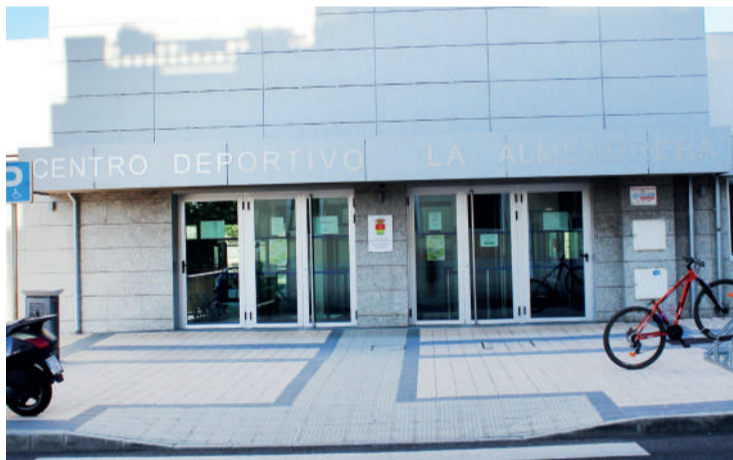
Entrada al Centro Deportivo La Almendrera. ENA

to inicial, más 8.956 euros correspondientes a la modificación contractual. Desde que se hiciera la reforma en 2016 los fallos de impermeabilización han sido constantes y desde hace 15 meses los usuarios no podían acceder a la zona de spa. «Antes de actuar», ha explicado el alcalde, el Ayuntamiento contrató un informe de valoración de daños y ahora se procede a su reparación».