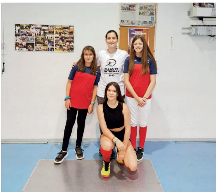
Las tiradoras, en el Campus celebrado en el Centro de Tecnificación Río Esgueva. ENA

de Castilla y León (FE-CYL) y dentro del marco de proyectos relacionados con la promoción de la igualdad de oportunidades entre mujeres y hombres, han puesto en marcha el campus 'Ellas te enseñan', coordinado y desarrollado por entrenadoras y monitoras de la federación. El campus está dirigido a menores de 15 años, en las categorías, M-11, M-13 y M-15, y en dos modalidades diferentes, interna, para los jóvenes deportistas de Valladolid y externa, para los deportistas que no viven en la ciudad.