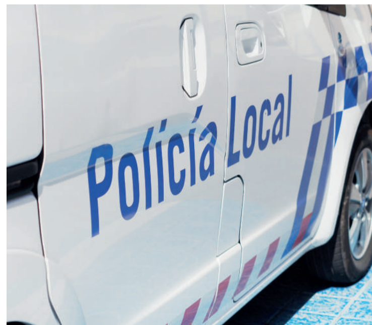
Vehículo de la Policía Local de Arroyo.

Horas antes, otra patrulla de la Policía Local de Arroyo también tuvo que detener a un hombre acusado de un delito de violencia de género, después de que, presuntamente, hubiera amenazado con un cuchillo a su pareja sentimental.