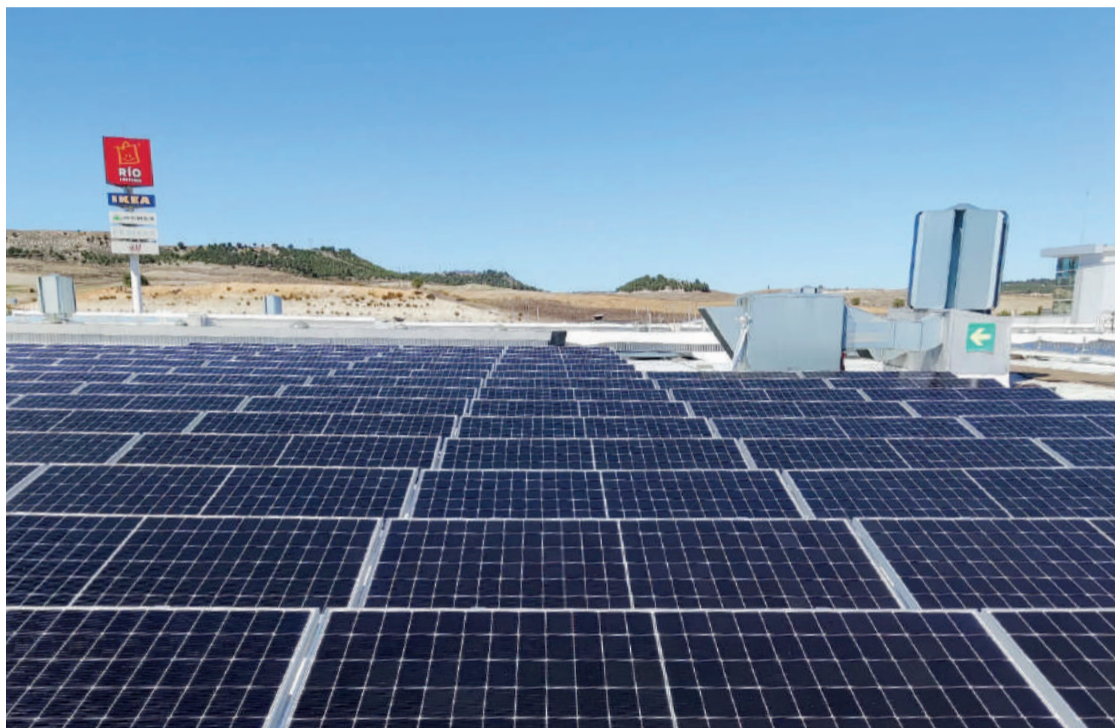
Placas solares instaladas en el centro comercial RÍO Shopping. ENA

Por esta razón RÍO Shopping apuesta por la gestión inteligente de los recursos utilizando electricidad 100% verde para el mantenimiento de sus instalaciones en las zonas comunes del edificio, trabajando hacia el objetivo de autoconsumo total en 2030 gracias a la producción de energía alternativa y limpia en el propio centro. En la actualidad cuenta con 1.344 placas solares fotovoltaicas instaladas en la cubierta de su azotea que generaron, sólo durante el año 2022, un total de 3.298.047 kwh. Este hecho ha evitado la emisión de 718,36 tone-