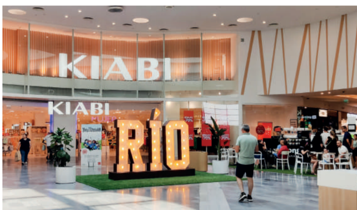
Foto de archivo del centro comercial.

ladas de CO 2 a la atmósfera durante los últimos 2 años. Actualmente, y desde 2013, la totalidad de la electricidad que se consume en RÍO Shopping es verde y el 84% de ella se genera por el propio sistema de placas fotovoltaicas, llegando incluso a alcanzar el 52% en junio de 2023, gracias a una inversión económica de 617.000 euros. Así, suma una