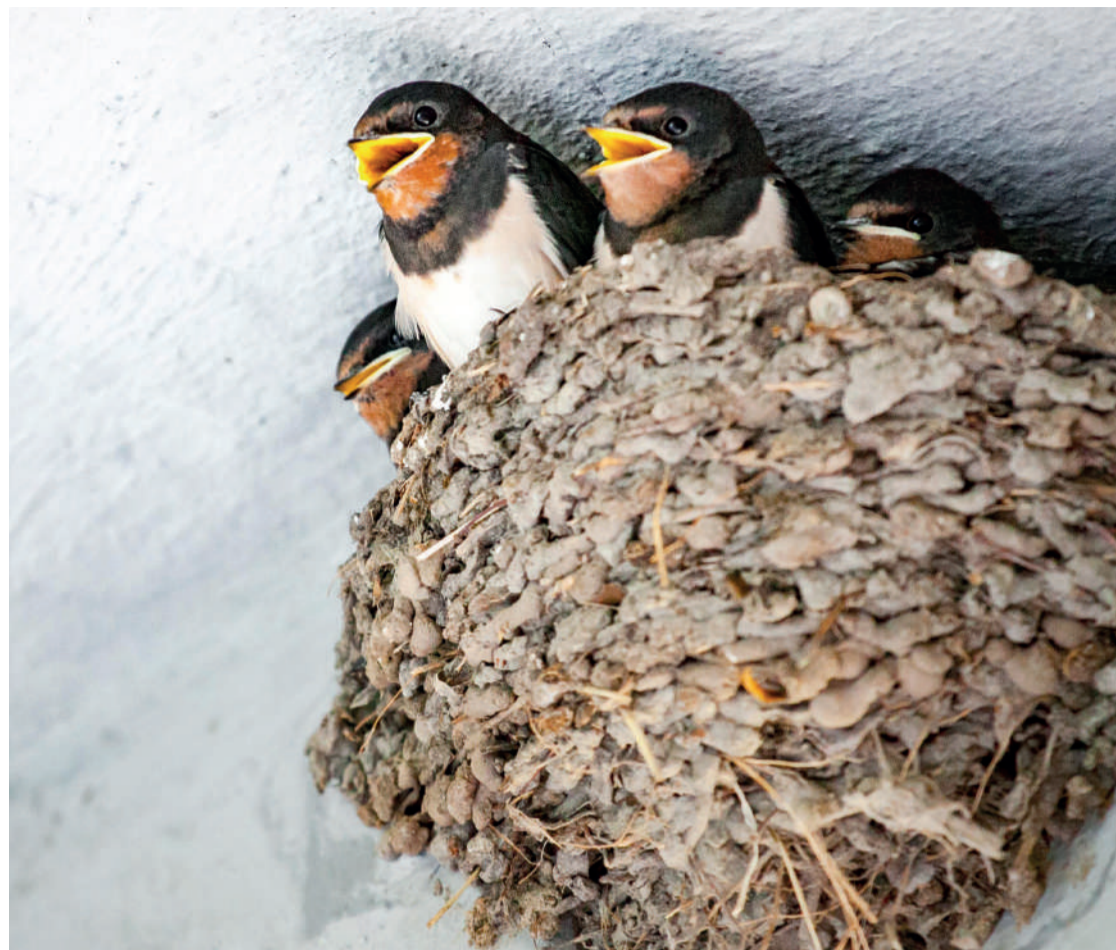
Los aviones vienen desde África para pasar el verano y eligen las fachadas de tejados de los edificios para construir sus nidos. ENA

La especie avión común ( Delinchon urbicum ), está incluida en el Anexo del Real Decreto 139/2011 de 4 de fe-