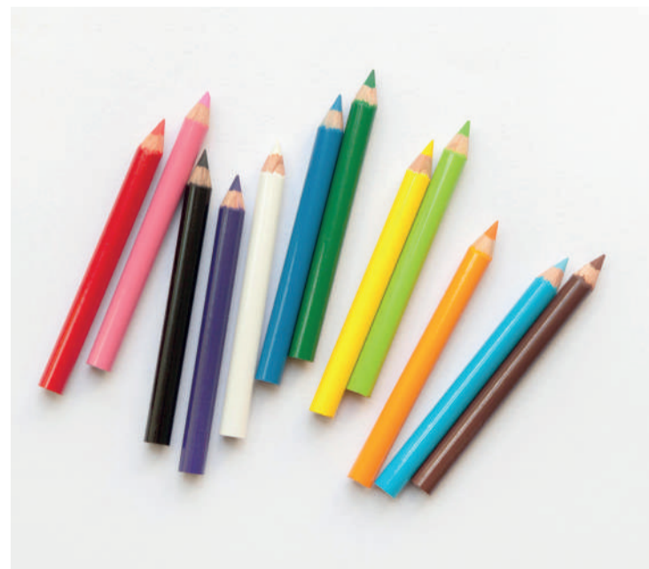
La subvención puede utilizarse para la compra de material escolar para el curso. ENA

Material informático: ordenador, tablet, cartuchos, impresoras, funda tablet, disco duro externo, auriculares sencillos, adaptador de red, micro SD, disco duro SSD, cristal templado IPAD, web-cam, smartphone, calculadora científica, paquete instalación antivirus, office 365, reposamuñecas.