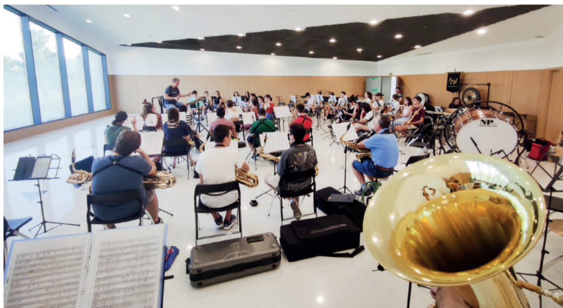
Foto de archivo de unos de los ensayos de la Banda Sinfónica en la Casa de la Música y la Cultura.