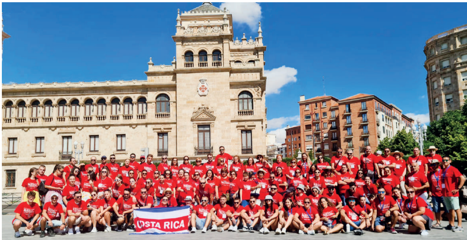
Los participantes del XV Festival de Folclore posan en la Academia de Caballería en la visita cultural a Valladolid.

En estos quince años por Arroyo han pasado grupos procedentes de todo el mundo. «Rara vez repetimos país y junto a los grupos interna-