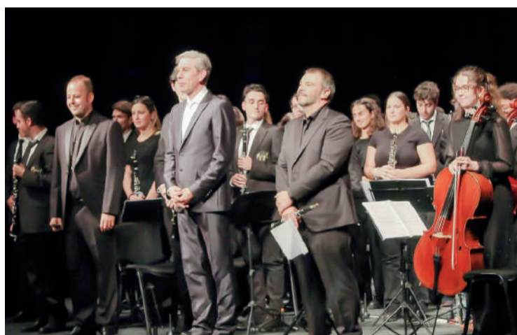
La Banda Sinfónica de Arroyo en uno de los conciertos.

Preparan con mimo tres importantes conciertos, el primero en Burgos el dos de septiembre, en la preciosa localidad de Frías, para participar en el III Festival Escenario Patrimonio de Castilla y León, organizado por la Junta de Castilla y León, la Fundación Siglo y la recién creada Fe-