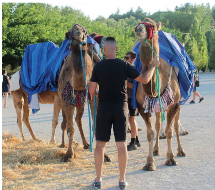
Imagen de archivo del Mercado Medieval celebrado el año pasado. ENA

ambientado en el siglo XII. Situado en un emplazamiento envidiable por su amplitud, los artesanos y mercaderes pueden poner sus puestos a lo largo de la gran explanada del Socayo, donde el camello ofrece paseo en camello del que disfrutan mayores y pequeños. Este año además habrá exhibiciones de aves de cetrería, una disciplina muy valorada en los países árabes