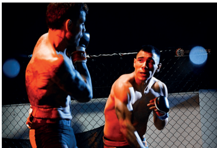
Dos momentos de la velada celebrada en las instalaciones de Pádel10z.

Precisamente el primer entrenamiento conjunto de