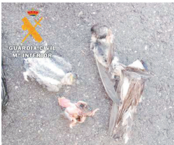
La Guardia Civil encontró dos ejemplares de adultos y dos crías muertas. ENA

brero de desarrollo del listado de Especies Silvestres en Régimen de Protección Especial y del Catálogo Español de Especies Amenazada. Igualmente se encuentra protegida por la Ley 42/2007, del Patrimonio Natural y de la Biodiversidad.