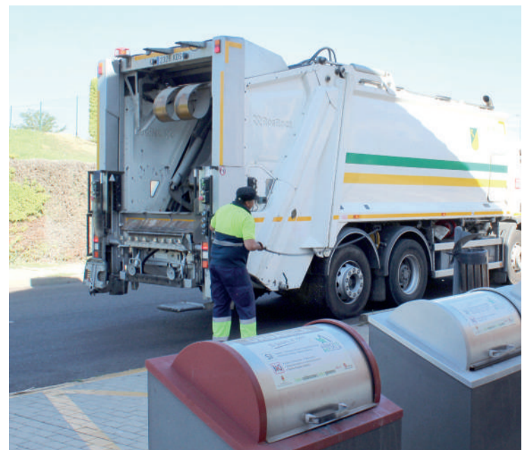
Un camión de recogida de residuos sólidos de la Mancomunidad de Torozos. ENA

ros, corresponde a las entidades locales, según la resolución publicada en el Boletín Oficial de Castilla y León el pasado 28 de julio. Por otra parte, la Mancomunidad de Interés General MIG de Valladolid y alfoz, del que forma parte Arroyo, ha quedado fuera de la convocatoria al no cumplir los requisitos para acceder a estas ayudas.