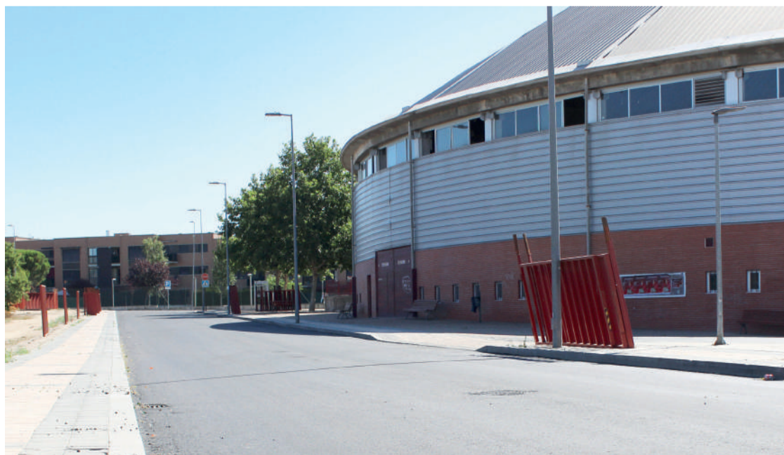
Una de las calles donde se ha actuado, a falta de pintar la señalización horizontal.

Tras concluir los trabajos de fresado y aglomerado, lo que ha supuesto algún corte de tráfico puntual, se está acometiendo la señalización horizontal, que ya se han iniciado y aunque ha sufrido un pequeño retraso esperan acabar antes de finales de agosto.