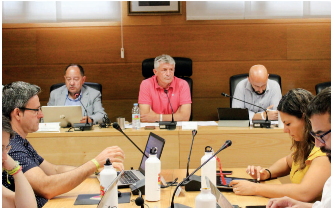
Un momento del pleno celebrado el pasado 28 de julio. ENA

El Pleno del Ayuntamiento, celebrado el pasado viernes 28 de julio, ha aprobado la desestimación de la solicitud de suspensión de la ejecución de la garantía de la empresa constructora del CDO La Almendrera para proceder a reparar subsidiariamente todos los desperfectos de la instalación deportiva. Era el primer punto del día del pleno correspondiente al mes de julio y se ha aprobado con los votos a favor de toda la Corporación municipal a excepción de los concejales de Vecinos que se han abstenido. En general los portavoces han señalado la importancia de acometer estos trabajos, aunque han insistido en que «se tenía que haber hecho hace tiempo». Los trabajos de reparación se valoran en algo más de 80.000 euros que se ejecutarán subsidiariamente a costa de la empresa EULEN. Para su financiación se ejecutará la garantía definitiva por el presupuesto de la obra de un aval presentado por 120.482 euros correspondientes al contra-