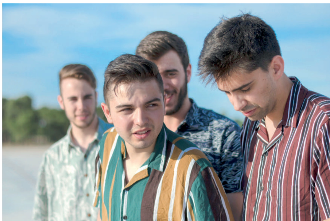
Los cuatro integrantes de la banda de música, Quinto Elemento. ENA

Se espera la presencia de grandes artistas del panorama nacional como Amaral, Trueno, Vetusta Morla o Ayax y Prok. Y entre ellos estará la banda Quinto Elemento, que tocará el domingo 13 de agosto en la plaza de la Sal a las 14,45 horas, con el vocalista Franc