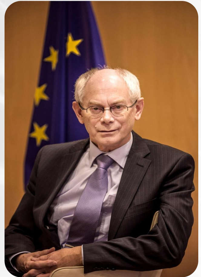
Herman Van Rompuy