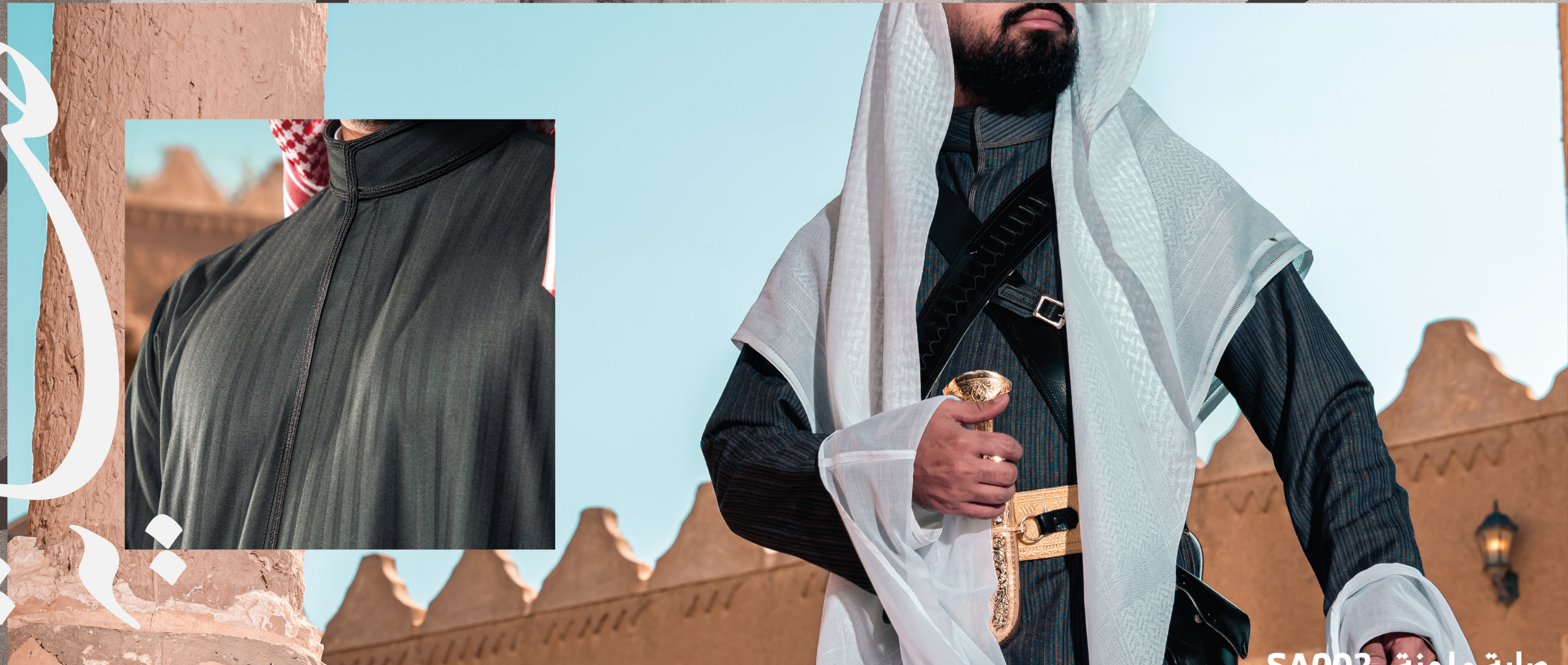
صاية ملونة SA002