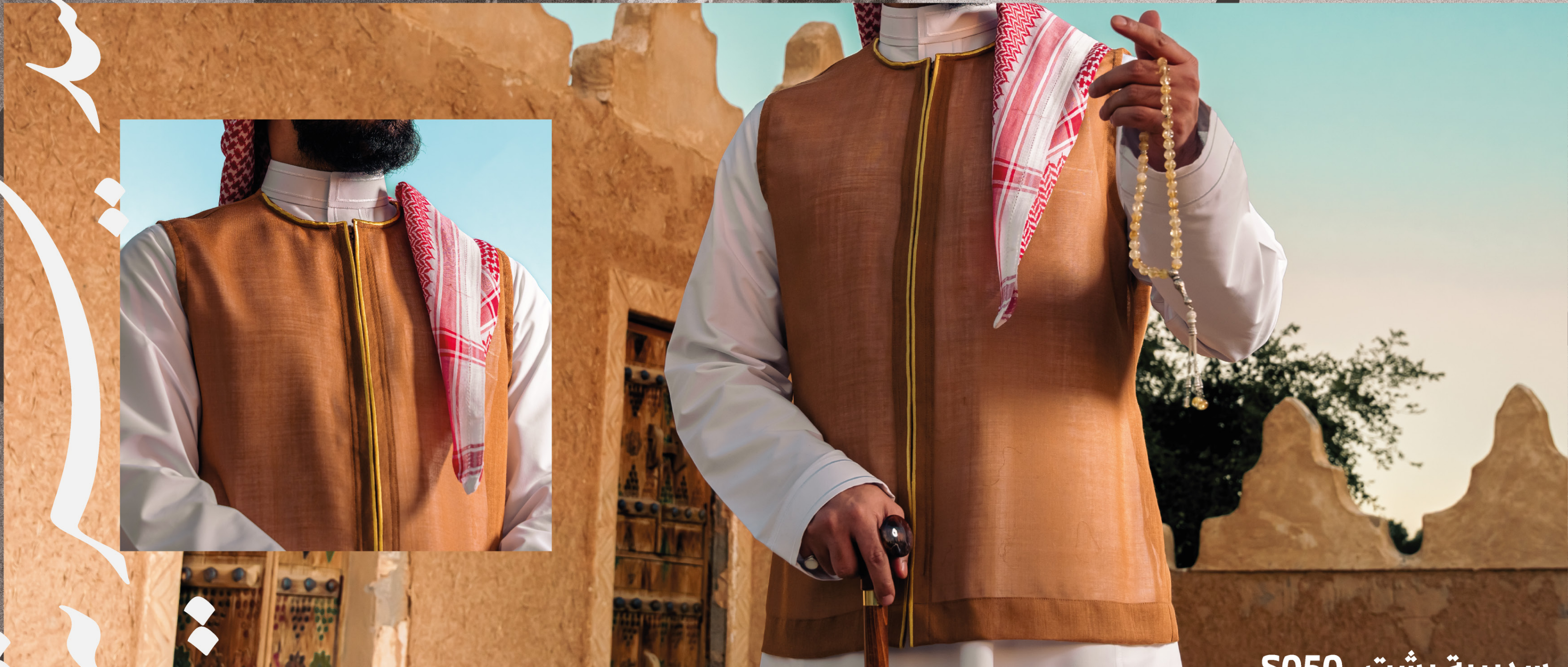
سديرية بشت S050