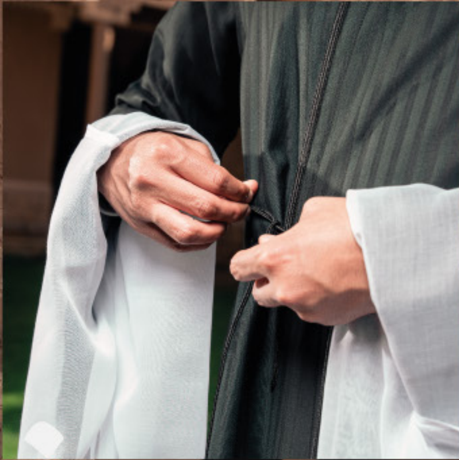
صاية ملونة SA002