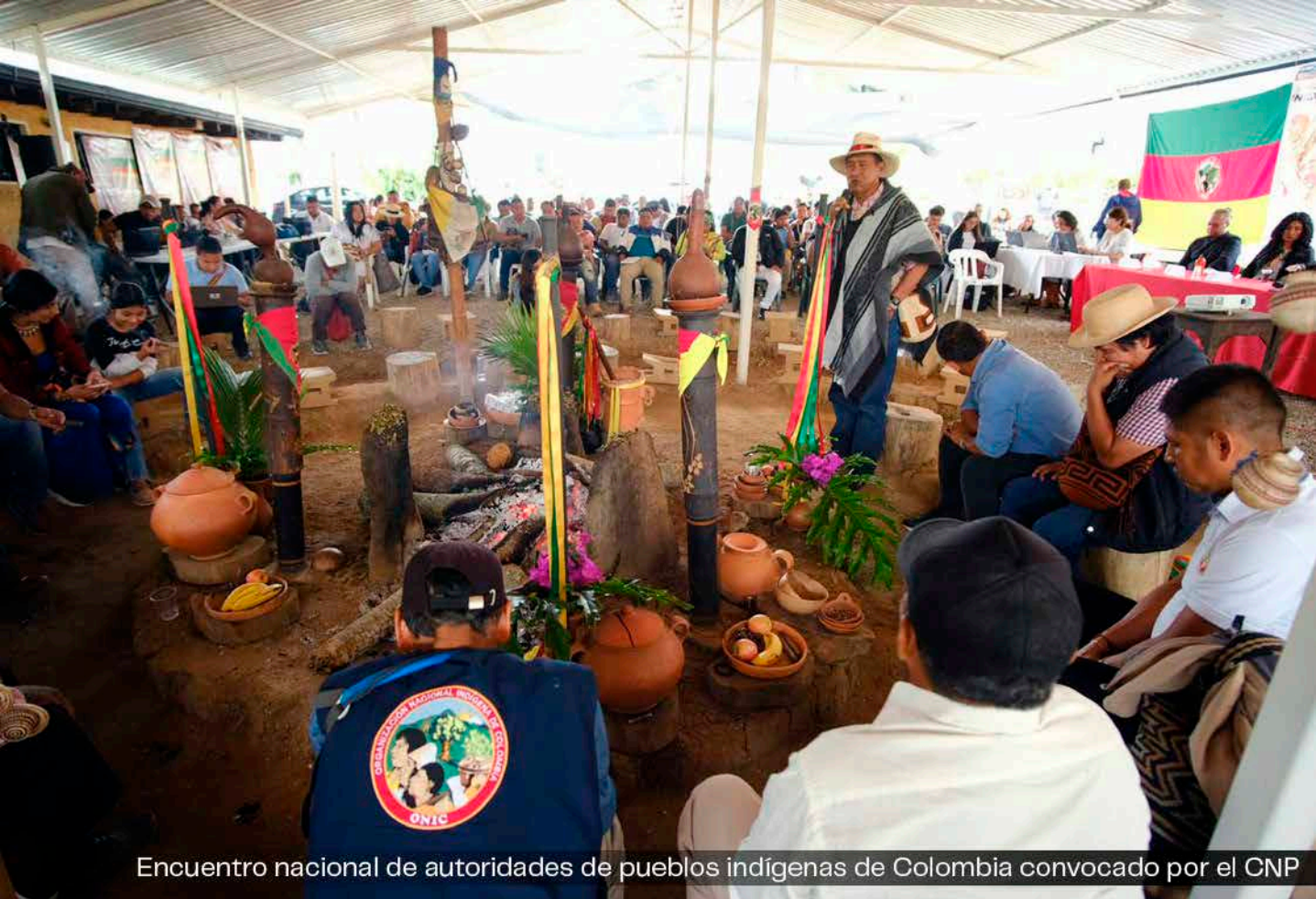
Encuentro nacional de autoridades de pueblos indígenas de Colombia convocado por el CNP

De igual manera, se ha explicado que el ELN ha estado dispuesto a realizar Ceses el Fuego de manera flexible, pero en varias oportunidades tanto los gobiernos de Colombia como la Comunidad Internacional, se han quedado cortos para buscar soluciones para la financiación de la guerrilla, que evite las ventajas que pretende el gobierno colocando al ELN en riesgo estratégico. Estas falencias afectaron la continuidad y proyección de un Cese el Fuego para hacerlo más estable, que contribuyera a la construcción de la paz. Esa ha sido la historia: sacar ventajas de los Cese el Fuego.