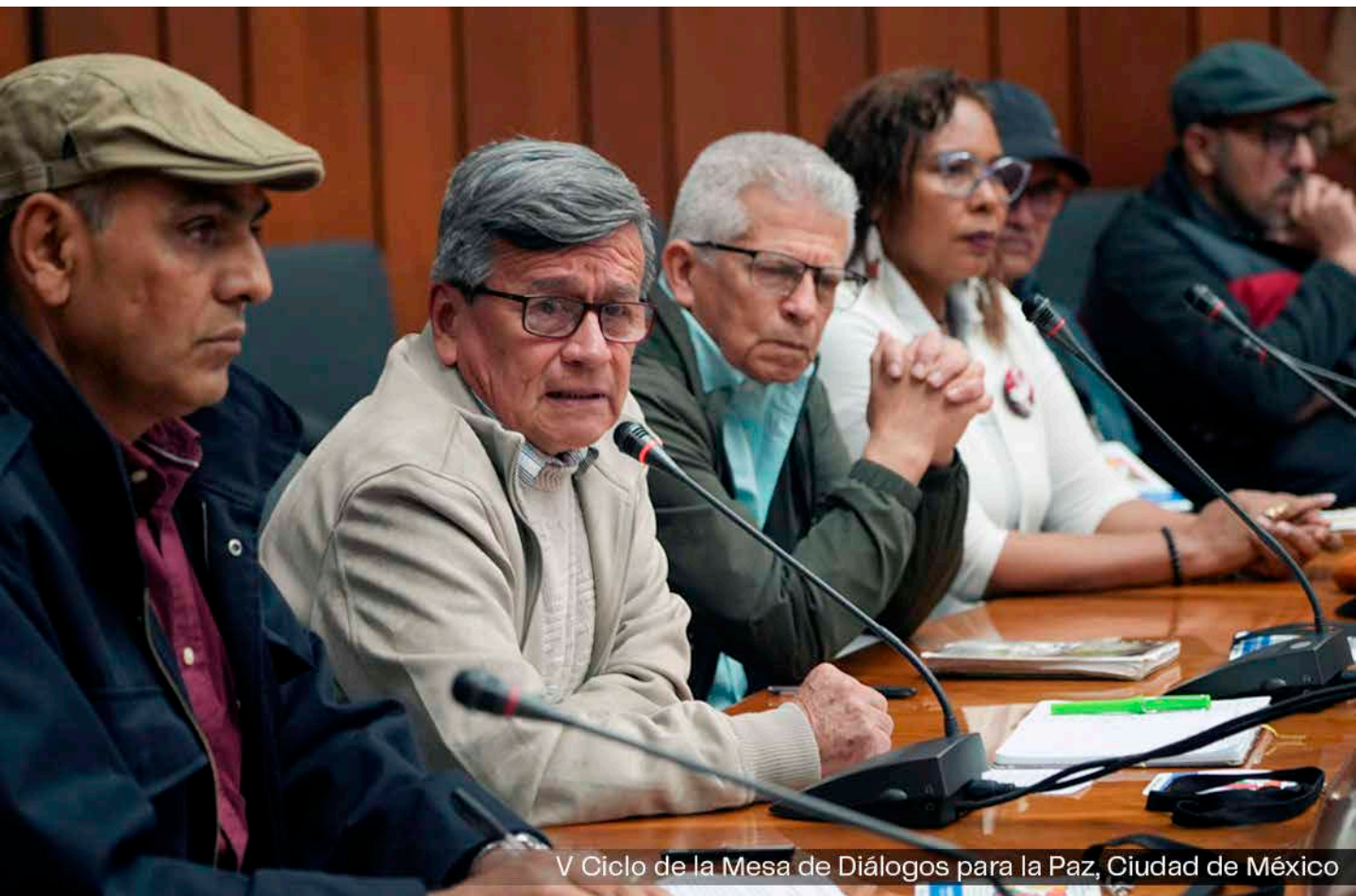
V Ciclo de la Mesa de Diálogos para la Paz, Ciudad de México