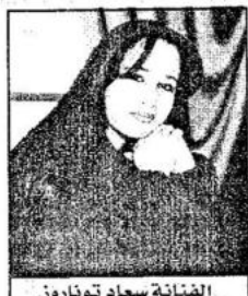
الفنانة سعاد توناروز

فعلا إلى كل الإقتضات والانساق ولأنه جمهور يتذوق الشعر والغناء ويحترم الفن- وليس الفنان- فكانت البداية- ومما أسوء البدايات في هذا الملصق-بشريط تضامني مع كل المستعرب