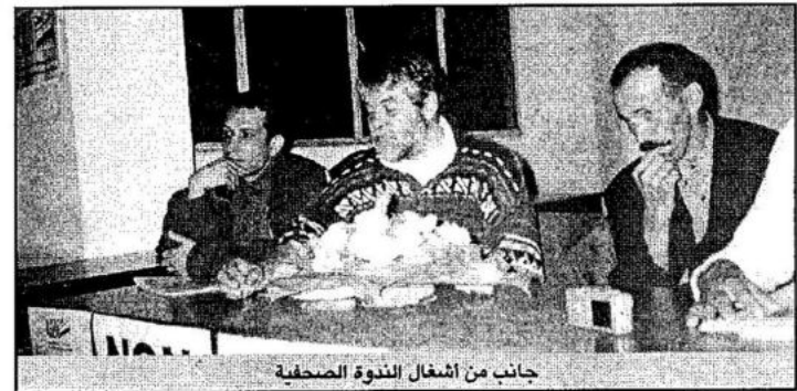
جانب من أشغال الندوة الصحفية

العائلات على مياه الشرب وتفصل الأطفال عن لنزع سياج محمية طبيعية أنشأتها السلطات المحلية بمنطقة Tasmmit الواقعة على بعد 15 كلم من بني ملال المركز. وجاء في مضمون مراسلات المحتجين أن إقدام السلطات المحلية في شخص والتي جهة تادلة أزبالل على تسييج حوالي 400 هكتار من الأراضي القابوية واستقدام وعول (Mouflons) محميات أخرى إليها بعد انتهاكها لحقوق الإنسان لا سيما وأن موقع المحمية المتمركز وسط تجمع سكاني (ثلاث دواوير) ساهم بدور كبير