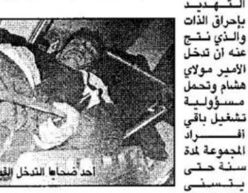
أحد ضحايا التدخل القمعي ضد المعاقين المصلين