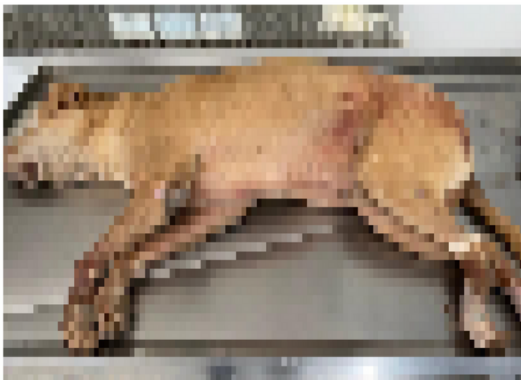
Foto 05 – Canino S/I com esparadrapo para acesso em membro posterior esquerdo