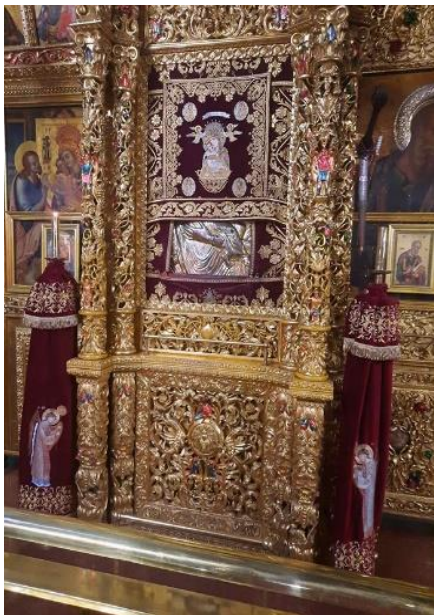
Η Παναγία του Κύκκου

Αφήνω τη σκέψη μου να γυρίσει πίσω στις λίγες ημέρες που γυρίσαμε στο νησί. Στη Μακεδονίτισσα, στους έγκλειστους τάφους, στις φυλακές των ηρώων, στις κρεμάλες, στη Μονή Κύκου και όλα τα άλλα αξιοθέατα του νησιού! Άραγε θα μου δοθεί πάλι η ευκαιρία να συναντηθώ με τους φίλους και αδερφούς συμφοιτητές; Ποιος ξέρει αν ξαναειδωθούμε...! Πάντως θα μείνει μία ανάμνηση μοναδική στη ζωή μου όπως και σε όλους, όσοι ακολούθησαν την εκδρομή αυτή! Ας δώσουμε μόνο μία ευχή! Ας φροντίσουν οι μεγάλοι που καθορίζουν τις τύχες των μικρών, ώστε ο κάθε Κύπριος να πάει το σπίτι του και να φύγουν γρήγορα οι κατακτητές από την Κύπρο!