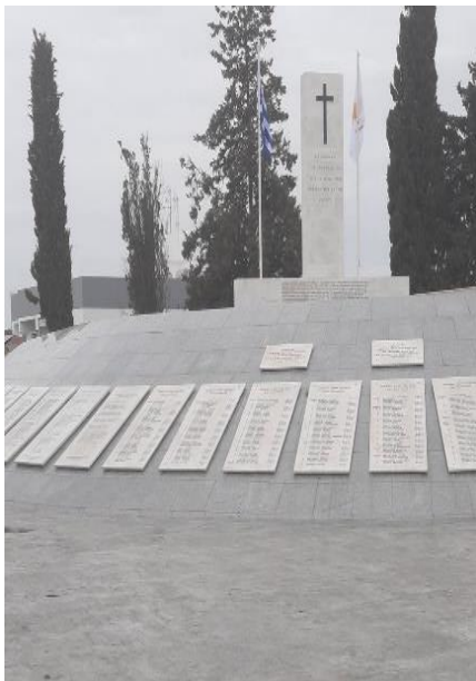
Τύμβος με τα ονόματα Των νεκρών Ηρώων του 1974