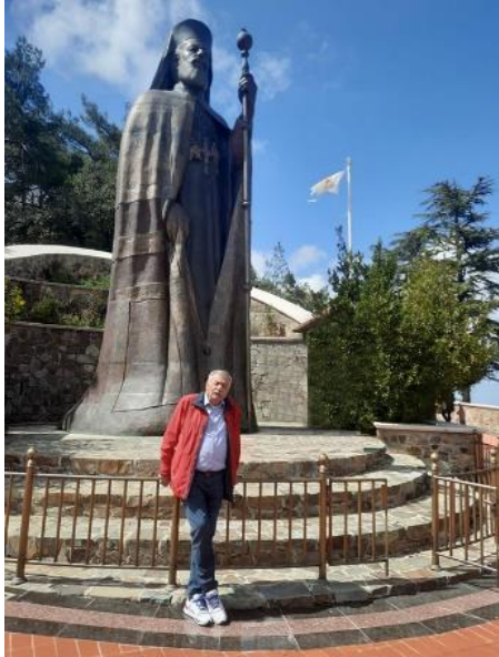
Ο Ανδριάντας του Μακαρίου