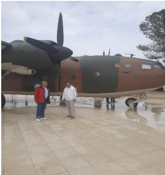
Η κατάρριψη του ελληνικού Νοράτλας (ανακατασκευάστηκε και διατηρείται ως μνημείο)