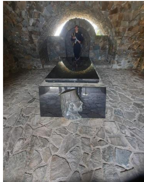
Ο Τάφος του Μακαρίου