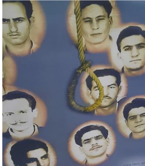
Οι απαγχονισθέντες Ήρωες στην κρεμάλα 1955-59