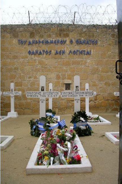
Οι έγκλειστοι τάφοι των νεαρών Ηρώων 1955-59.