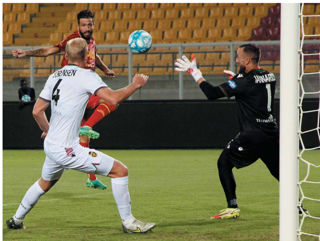
Il Catanzaro vince 2-1 Il primo gol calabrese. Poi pari di Raimondo e rigore di Vandeputte → alle pagine 31 e 32 Michele Fratto