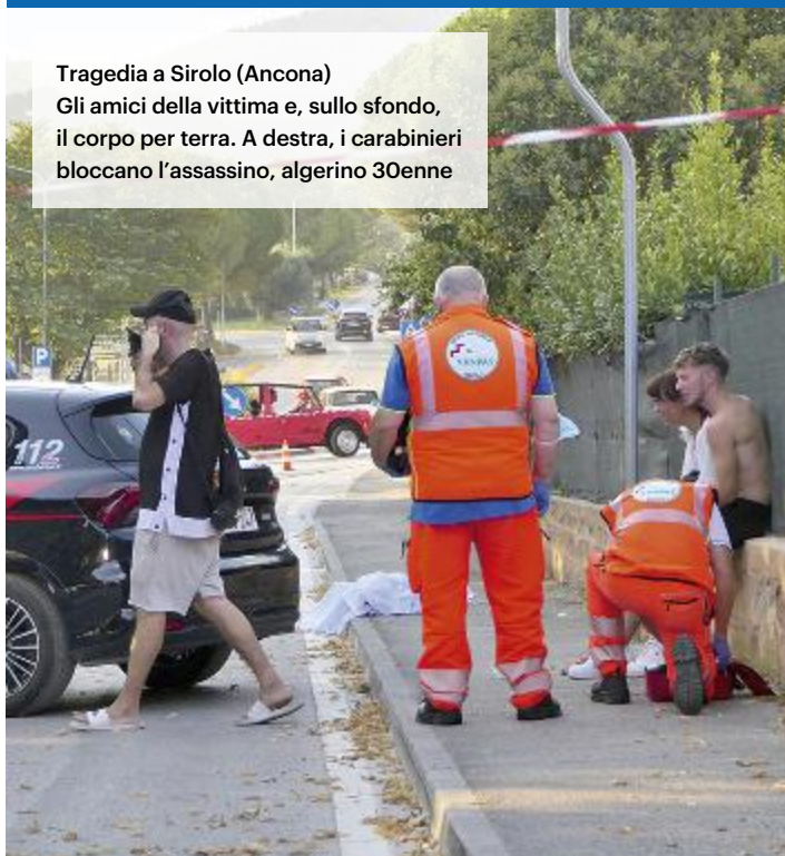
Tragedia a Sirolo (Ancona) Gli amici della vittima e, sullo sfondo, il corpo per terra. A destra, i carabinieri bloccano l'assassino, algerino 30enne