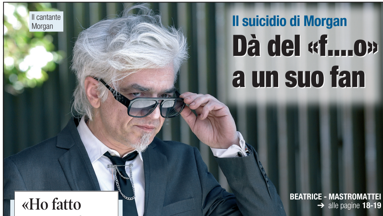
Il cantante Morgan