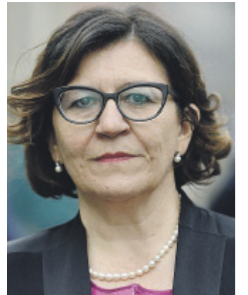
EX M5S Elisabetta Trenta, 56

● La critica a Crosetto: «Il generale non andava rimosso» ● Il sospetto: «Possibile gli sia costata cara la battaglia in difesa dei nostri soldati ammalatisi in missione» ● L'attacco: «Quella delle intossicazioni da metalli pesanti resta una pagina vergognosa, troppi miei predecessori hanno negato il problema»