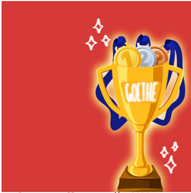
Зурсан : 11а ангийн Х.Хантуул