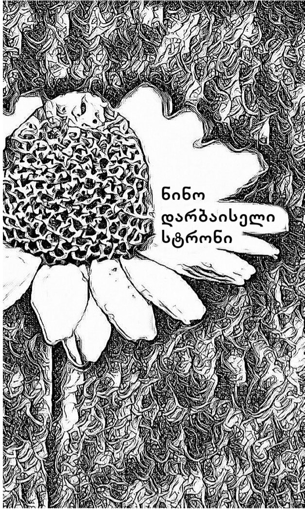
ნინო დარბაისელი სტრონი