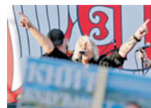
Bora Dorđević, rok muzičar

Ne želimo da sviramo za „žute“, koji su prodali Kosovo budžašto! Ne želimo da sviramo za onu što šamara nesrećnika sa Kosova. Čast nam je da delimo binu sa junacima sa Košara. Savest nam nalaže da pevamo za Srbiju.