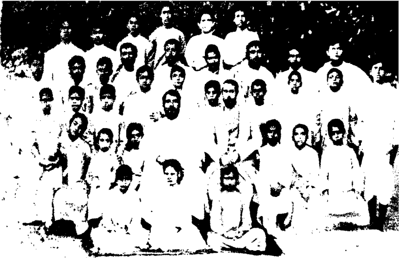
ব্রহ্মচর্য বিদ্যালয়ের ছাত্র ও অধ্যাপকগণসহ রবীন্দ্রনাথ