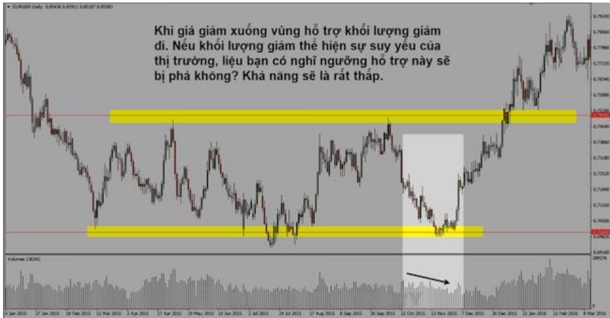
Minh họa về cách dùng Tick Volume Forex