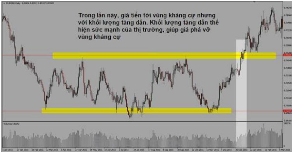
Minh họa tiếp theo về cách dùng Tick Volume để hiểu nhất