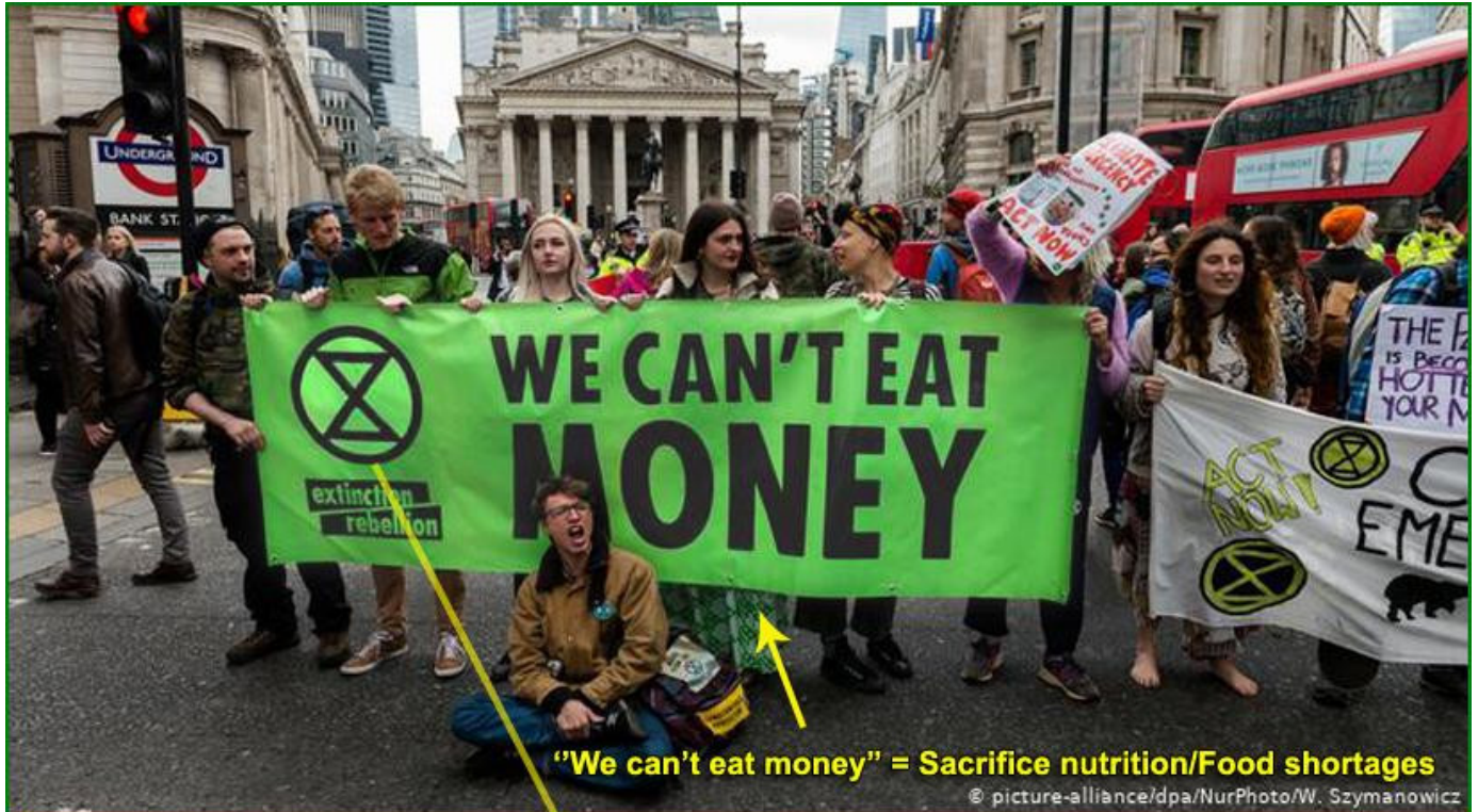
“We can't eat money” = Sacrifice nutrition/Food shortages