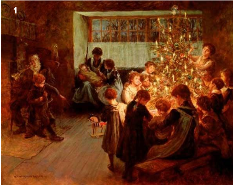
Το χριστουγεννιάτικο δέντρο, Albert Chevallier Tayler, 1911