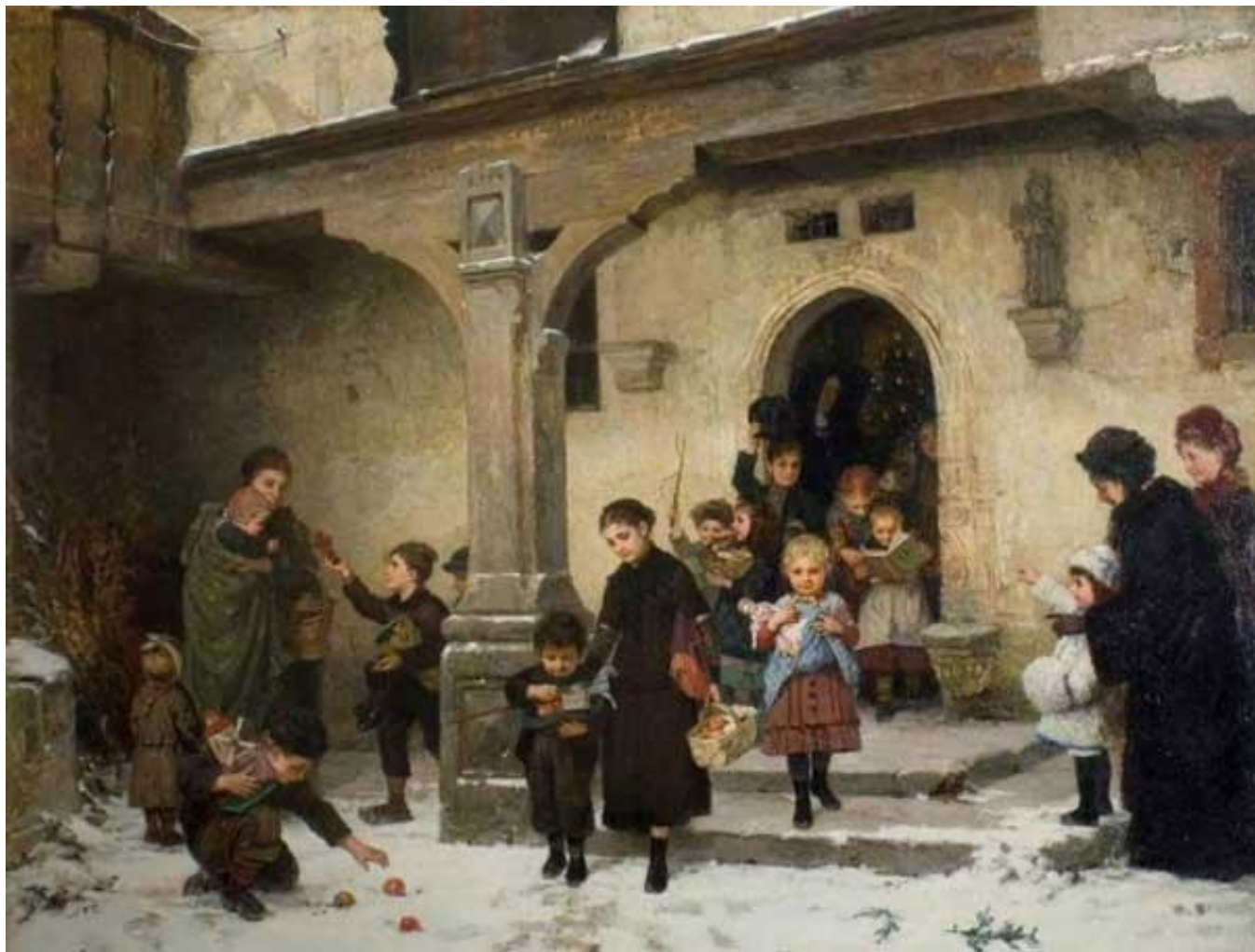
Χριστουγεννιάτικα δώρα, Hugo Oehmichen, 1882

Παρατηρώ τον πίνακα: Είναι μέρα ή νύχτα; Πόσα παιδιά υπάρχουν; Τι κρατάνε στα χέρια τους; Είναι χαρούμενα ή λυπημένα; Πού μπορεί να ήτανε; Πού πηγαίνουν;