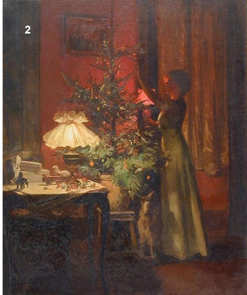
Στολίζοντας το Χριστουγεννιάτικο δέντρο, Marcel Rieder, 1898