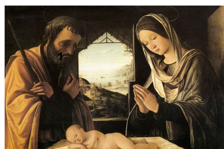
Γέννηση - Lorenzo Costa 1490

Παρατηρώ τους πίνακες: Σε ποιον πίνακα είναι νύχτα;