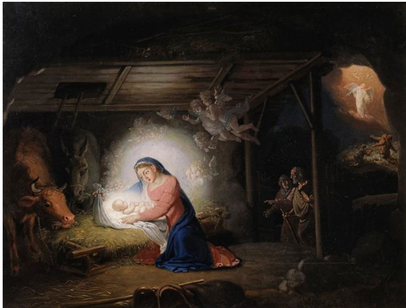
The nativity of Christ Vladimir Borovikovsky

Παρατηρώ τον πίνακα ζωγραφικής: Πόσα αγγελάκια έχει; Πόσους βοσκούς; Πόσα ζώα;