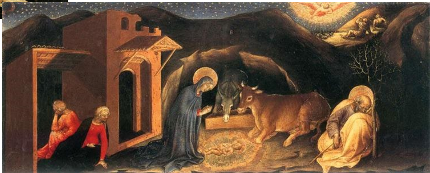
The Nativity -1423 Gentile da Fabriano