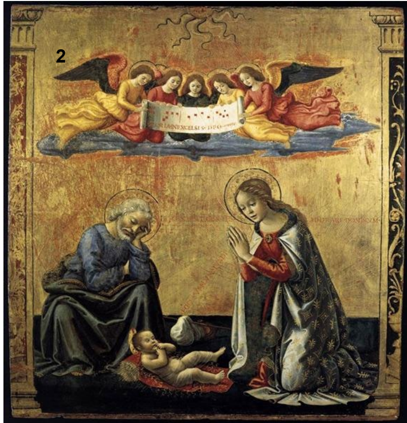
The Nativity, 1492, Domenico Ghirlandaio