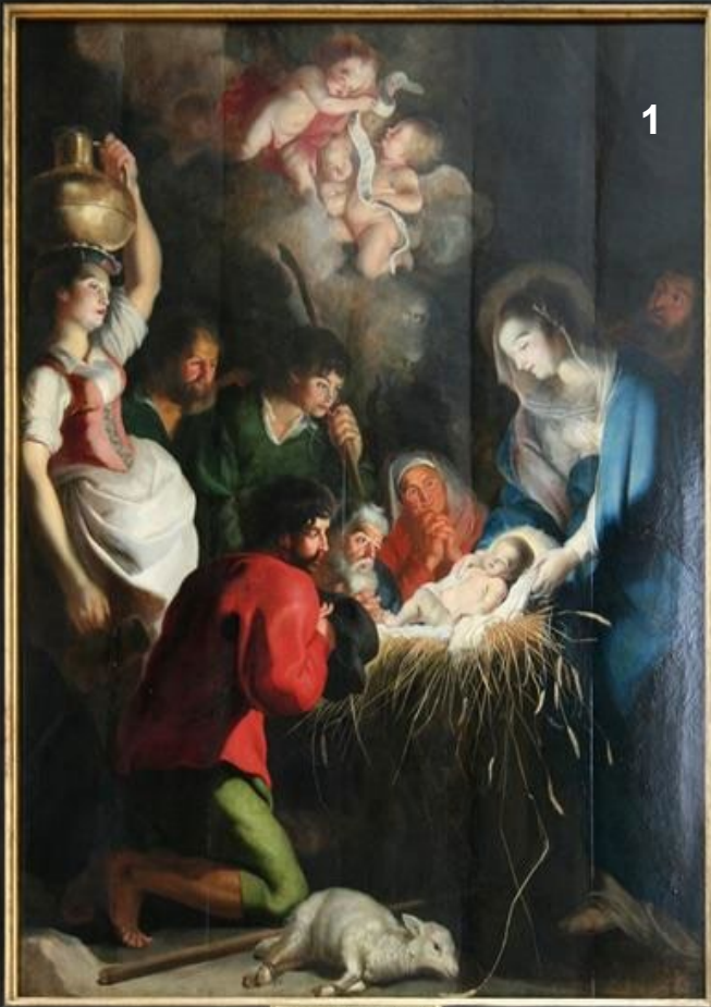
Cornelius de Vos