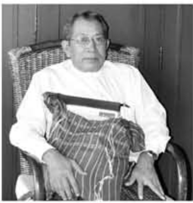
မောင်မြား

ဦးသန်းပေးသည့် offer ကို အဖေဘာမှ မတုံ့ပြန်သည့်အတွက် အဖေသဘောထားကို ကာလအတန်ကြာသည့်အခါ မိမိတို့သဘောပေါက်လိုက်ကြသော်လည်း ဦးသန်းခေါ်သည်ကို အဖေဘာကြောင့် မလိုက်ဆိုသည်ကို အဲဒီလိုပူပူနွေးနွေးကာလမှသည် နောက်နှစ်ပေါင်းများစွာတိုင်အောင် မိမိတို့ အဖေကို မမေးခဲ့ကြသလို အဖေကလည်းဘာကြောင့်မလိုက်ဆိုသည်ကို အဖေ