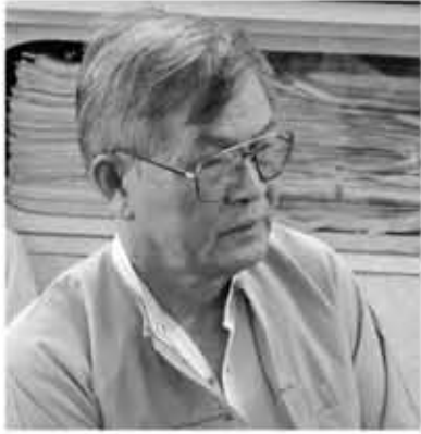
မြိုင်-တင်လှိုင်

ကို အပြိုင်အဆိုင်ရာလာကြလေတော့ သည်။ အဲဒီပြဿနာကအစ အခြားသော အကောင်အထည်မဖော်နိုင်သည့် ပြဿနာ များကြောင့် အမယ်ဘုတ်ကဲ့ သူ့ချည်ခင် ဘယ်သူထွင်မှရှင်းနိုင်မလဲဆိုပြီး နိုင်ငံ တော်၏ အထွတ်အထိပ်ဖြစ်တဲ့ သမ္မတ ကြီးက ရှင်းရမှာဆိုတော့ သမ္မတလောင်း ကြီးကို ၂၀၁၅ ရွေးကောက်ပွဲအထိ ကိုယ် တိုင်ဖွင့်ဟသွား နိုင်မည်ဟု ခန့်မှန်းသူ တွေပေါ်လာပါတယ်။