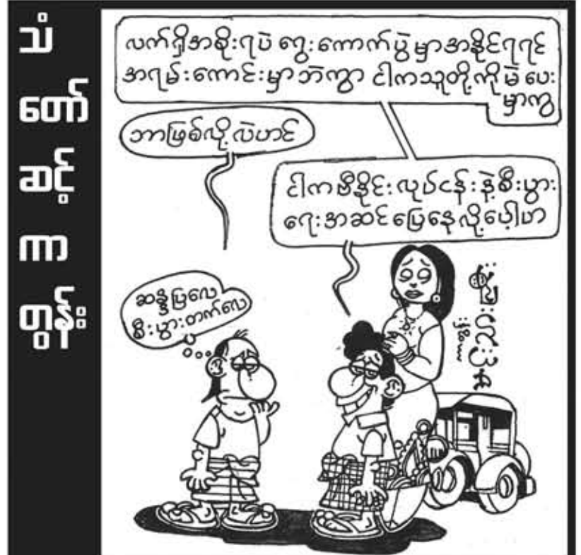
အပတ်စဉ်စနေနေ့တိုင်းထုတ်ဝေသည်

ယနေ့မြန်မာ့နိုင်ငံရေးနယ်တွင် နိုင်ငံရေးသမားများနှင့် နိုင်ငံရေးပါတီများ ရှင်သန်တည်ရှိနေရာတွင် တချို့နိုင်ငံရေးသမားများမှာ လက်ရှိအစိုးရသည် အရပ်ဝတ်စစ်အုပ်စုဖြစ်သည်ဟု နားလည်ထားကြသည်။ တချို့နိုင်ငံရေးသမားများနှင့် နိုင်ငံရေးပါတီများကမူ ယခုအစိုးရအဖွဲ့သစ်သည် အမှန်တကယ်ပြုပြင်ပြောင်းလဲဖို့ အားထုတ်နေသည်ဟု ယုံကြည်ကြလေ