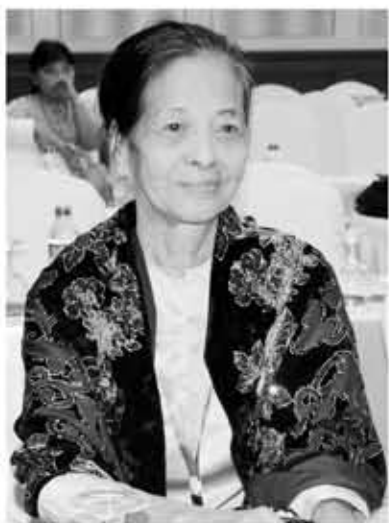
ရွှေကူမေနှင်း

ကမ္ဘာကျော် စာရေးဆရာကြီးများ၊ နိုင်ငံရေးသမားကြီးများ၏ ကိုယ်ရေးအတ္ထုပ္ပတ္တိ မှတ်တမ်းရုပ်ရှင်ကားများကို ကြည့်ခဲ့ဖူးပါသည်။ ၎င်းတို့ အသက်ထင်ရှား ရှိစဉ်က ပုံရိပ်များ၊ လှုပ်ရှားမှုများ၊ စွမ်းဆောင်ချက်များနှင့်တကွ ၎င်းတို့ကို သိမိလိုက်သော ယခုလက်ရှိလူများကိုပါ တွေ့ဆုံမေးမြန်း အတည်ပြုချက်ယူပြီး မှတ်တမ်းတင်ကြခြင်းဖြစ်သည်။ ကျန်ရစ်ခဲ့သော လက်ရာများ၊ ဇာတိမြေ၊ နေထိုင်ခဲ့သော အိမ်၊ မိသားစုစသည့် ကိုယ်ရေး အချက်အလက်များကိုလည်း ထည့်သွင်းခဲ့ကြ၏။ ကိုယ်တိုင်ရေး အတ္ထုပ္ပတ္တိများရှိသော်လည်း စာအုပ်ဖြစ်နေ၍ အချိန်ကြာကြာ ဖတ်ရခြင်း၊ အချို့မှာ မှန်ကန်ခြင်းမရှိဘဲ ပုံမှန်မဟုတ်ဘဲ ဝါမှ၊ ဖန်တီးမှုများပါနေသဖြင့် သမိုင်းအမှား ဖြစ်နေတတ်သည်။ အခြားသူများက ရေးပေးသောအခါမှာလည်း "ဘုံခန်းလည်း မြောက်လွန်းသည်" ဆိုသော စကားကဲ့သို့ အကောင်းတွေချည်းပါတတ်ကာအမှန်များ ကျန်ရစ်တတ်၏။