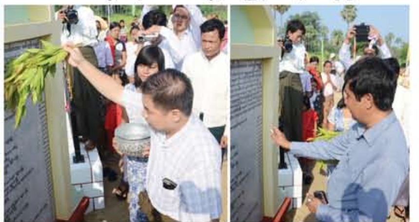
မြန်မာသံတော်ဆင့် အယ်ဒီတာချုပ်နှင့် စင်ကာပူနိုင်ငံမှ အလှူရှင်တို့က စည်သူတံတား မော်ကွန်းကျောက်စာအား အမွှေးနံ့သာရည်များ ပက်ဖျန်းကြစဉ်