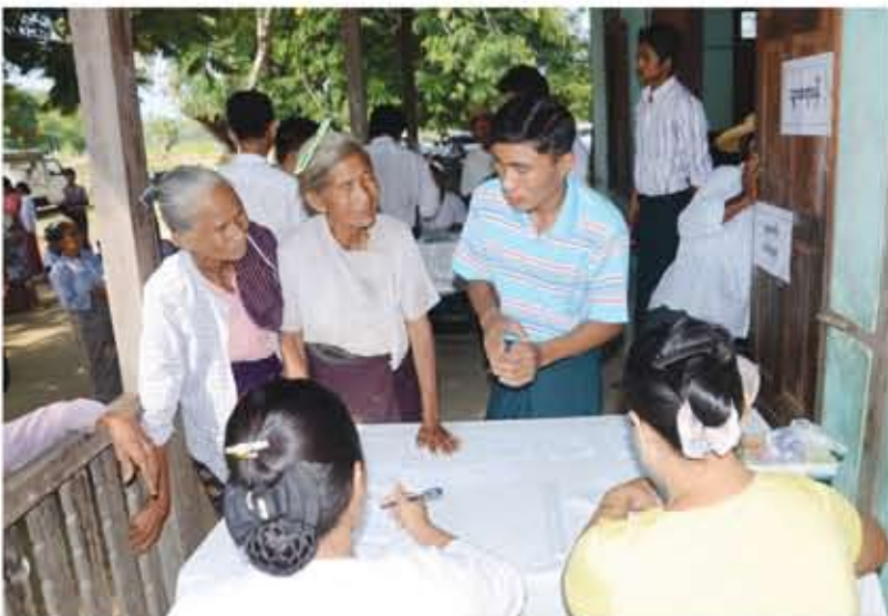
လေးမျက်နှာဆရာတော်ဘုရားကြီး၏ ဇာတိ ဝမ်းတွင်းမြို့နယ်၊ အင်းကုန်းကျေးရွာ၌ စည်သူတံတားဖွင့်ပွဲအထိမ်းအမှတ် ဇီဝိတဒါန ဆေးကုသမှုဆောင်ရွက်စဉ်