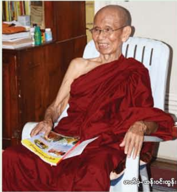
အဘိဓမ္မ-ဆန်းဝင်းထွန်း

(နိုင်ငံတော် ဩဝါဒါစရိယမြတောင်ဆရာတော်ဘုရားကြီး)