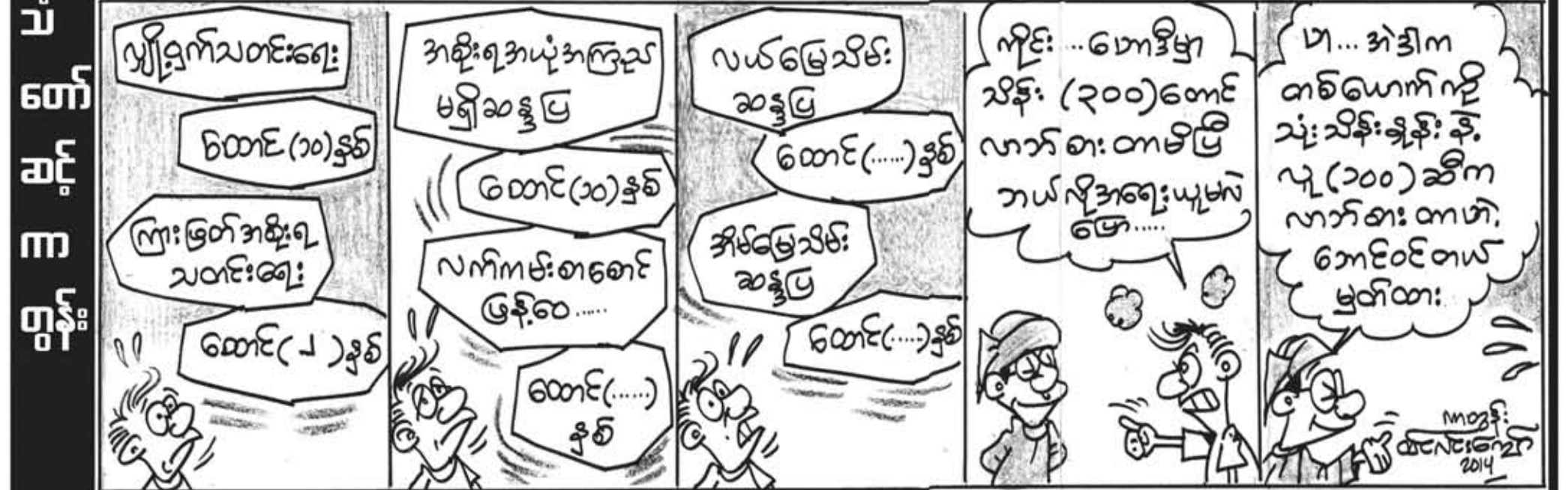
အပတ်စဉ်စနေနေ့တိုင်းထုတ်ဝေသည်

“ဟဲ့.. အပေါင်းအသင်း.. အဲ သလို မဟုတ်ဘူးလေကွာ.. အသက် ၁၅ နှစ်ပြည့် တိုင်းရင်းသားကပြားတစ်ဦး ဟာ မိမိနှစ်သက်ရာ မျိုးနွယ်တစ်ခုကို လွတ်လွတ်လပ်လပ်ရွေးဖြေနိုင်တယ်။ သူမရွေးတတ် မဖြေဘူးဆိုရင် မိဘနှစ်ဦး က တိုင်ပင်ပြီး သဘောတူတဲ့လူမျိုးကို ထည့်နိုင်တယ်။ မိဘက ဘယ်လိုမည့်မရ ရင်တော့ ဖခင်ဘက်မျိုးနွယ်ကို လဝက (သို့မဟုတ်) စာရင်းကောက်က ရေးသွင်း ပေးရမယ်ဆိုတာ ဥပဒေရှိပြီးသား။ ညွှန် ကြားပြီးသားပဲ။ ခင်ဗျားပြောတဲ့ ကိစ္စမှာ မိဘများက စေ့စပ်လို့မရတော့ရင် စာရင်း ကောက်က “ကရင်လူမျိုး”လို့ပဲ စာရင်း ရေးသွင်းရမယ်ဆိုတာ သူတို့ကို သင်တန်း ပို့ချထားပြီးသား..” “ဪ.. ဒီလိုလား” ကျွန်တော် သူငယ်ချင်းကိုယ်တိုင်က ထိုသတ်မှတ်ချက်ကို မသိကြောင်း ထင် ရှားသည်။ ဘွဲ့ပြီးသား။ အသက် ၇၃ နှစ်၊ ပါတီတစ်ခု၏ အကြီးအကဲဖြစ်သော် လည်း ထိုကိစ္စကို မလေ့လာမသိရှိပါလျှင် တောသူတောင်သား စာမတတ်ပေ မမြင် များမူ ဆိုဖွယ်ရာမရှိတော့ပြီ။ သို့သော် စိတ်ထဲ၌ မကျေနပ်မှု၊ သံသယဖြစ်မှုတို့နှင့် နှစ်ဖက်လုံးနေမည်မှာ ကေနိမလွဲမှုဖြစ်ပါ သည်။ တိုင်းရင်းသားအချင်းချင်း လူမျိုး ရေးအရ ဝါးမျိုးနေကြသည်လားဟူသည့် သံသယ... *** ဝေသန္တရာဇာတ်တော်ကြီးကဲ့သို့ ရှည်လျားမြားမြော်လှသော သာဓကများ ၊ ဥပမာဥပမေယျများ ဆက်လက်ရေးသား ဖော်ထုတ်ရန် ရှိနေမည်လည်း စာရေးသူ၏ အမြင်နှင့် စာရှုသူ၏ အမြင် ဆန့်ကျင်ပြီး ဝိရောဓိဖြစ်နေလျှင် အထက်ဖော်ပြပါ သံ