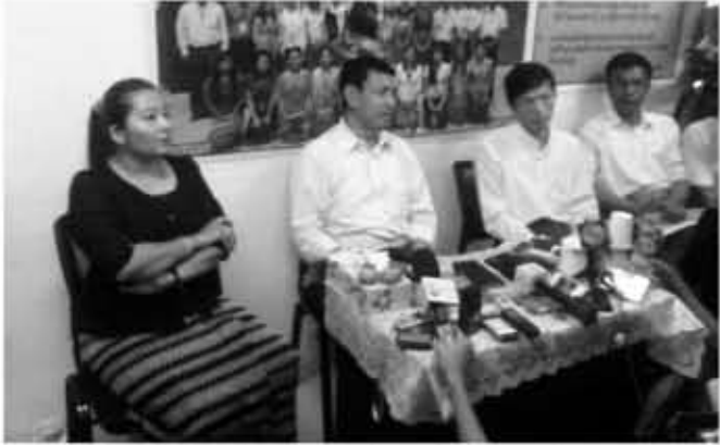
MJN ရုံးခန်းတွင် ပြုလုပ်သည့် သတင်းစာရှင်းလင်းပွဲတွင် တွေ့ဆုံသော (ဝဲဘက်) ဒေါ်ရွှေမုန့်၊ ဝန်ကြီးဦးရဲထွဋ်နှင့် MJN အထွေထွေအတွင်းရေးမှူး ဦးမြင့်ကျော်

ရန်ကုန်၊ အောက်တိုဘာ ၂၁ - ပြည်တွင်းမိဒီယာအချို့တွင် သမ္မတ ငိုကြွေးခဲ့သည်ဟု ရေးသားဖော်ပြမှုများ ရှိခဲ့သည့်အတွက် သမ္မတ ဦးသိန်းစိန်နှင့် ပြည်တွင်းအခြေစိုက်မိဒီယာများ ထပ်မံတွေ့ဆုံရန်မလွယ်တော့ကြောင်း ပြန်ကြားရေးဝန်ကြီး ဦးရဲထွဋ်က အောက်တိုဘာလ ၂၁ ရက်နေ့တွင် ပြုလုပ်သည့် မြန်မာ့ဂျာနယ်လစ်ကွန်ဂရက် MJN တာဝန်ရှိသူများနှင့် တွေ့ဆုံစဉ်ပြောကြားခဲ့ကြောင်း MJN တွဲဖက်အတွင်းရေးမှူး(၁) ဦးအောင်သူက ပြန်မာသံတော်ဆင့်သို့ ပြောသည်။