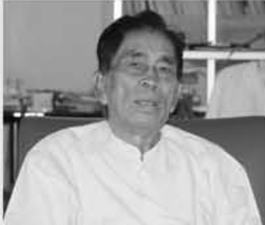
မောင်ကျောက်တိုင်

မြန်မာနိုင်ငံတွင် အင်အားစိုးရ လက်ထက်၌ ထောင်ကျရဟန်းတော်များ အား သက်နိုးဝတ်ခွင့်မပြုသဖြင့် ဆရာ တော် ဦးစိစာရသည် အစာငတ်ခံဆန္ဒပြခဲ့ ရာ အင်အားစိုးရကလည်း မလိုက်လျော သဖြင့် ရက်ပေါင်း (၁၆၀) ကျော်သောအခါ ဆရာတော်ဦးစိစာရ ပုံလွန်တော်မူခဲ့သည်။