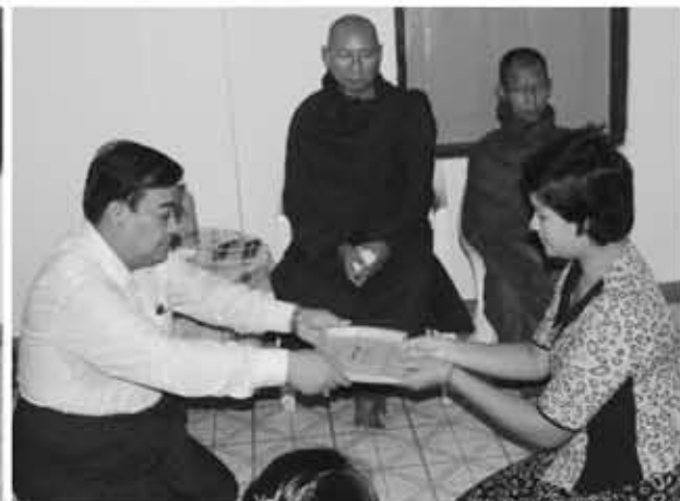
မြန်မာသံတော်ဆင့်(ရွှေပေါ်ကျွန်း)အဆင့်မြင့်ပညာသင်ဆုများကိုတာဝန်ရှိသူများက ဒုတိယအကြိမ်ပေးအပ်နေစဉ်