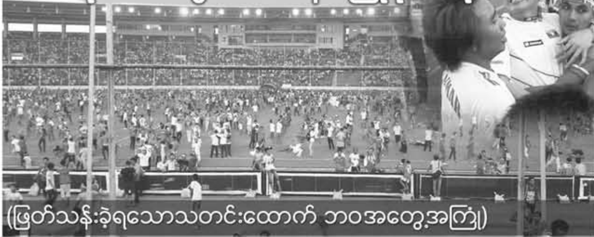
(ဖြတ်သန်းခဲ့ရသောသတင်းထောက် ၁၀အတွေ့အကြုံ)

အသက် ၁၉ နှစ်အောက် မြန်မာလူငယ်ဘောလုံးအသင်းအနေနဲ့ AFCU - ၁၉ ဘောလုံးပြိုင်ပွဲမှာ UAE အသင်းကို ၁-၀ နှင့်နိုင်လိုက်တဲ့အတွက် ဆီမီးဖိုင်နယ်ကို တက်ရောက်ခွင့်ရသလို ၂၀၁၅ ခုနှစ် နယူးဇီလန်မှာကျင်းပမယ့် U-၂၀ ကမ္ဘာ့ဖလားပွဲကိုလည်း ဝင်ခွင့်ရသွားခဲ့ပါပြီ။ ဒီအတွက်ပျော်သူတွေလည်း ပျော်ကြသလို မော်သုတွေလည်း မော်ကြကုန်လေပြီ။ နှစ်ပေါင်းများစွာကြာမှ ကမ္ဘာ့ဖလားပွဲကို ဝင်ကန်ရဖို့ဆိုတော့ ပျော်သူလည်း အပြစ်မရှိသလို မော်သူလည်း အပြစ်ကင်းတယ်မလား။ ဒီမောင်လည်း ပျော်မိတာတော့ အမှန်ပေါ့။ ၁၉၉၆ ခုနှစ် ကမ္ဘာ့ဖလားကို မြန်မာတွေရှုံးကတည်းက မြန်မာအသင်းပွဲဆိုရင် ဆန်ရှင်လုပ်ထားတာ။ အခုမှပြန်ကြည့်မိတယ်ဆိုတော့ ကြံဖန်ပြီး ဂုဏ်ယူမယ်ဆိုရင် ဂုဏ်ယူလိုက်စမ်းပါမောင်တို့ရယ်။