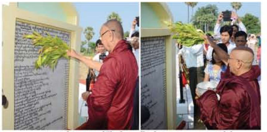
လေးမျက်နှာဆရာတော်ကြီးနှင့် ရွှေပေါ်ကျွန်း ပဓာနနာယကဆရာတော်တို့ မော်ကွန်းကျောက်စာအား အမွှေးနံ့သာရည်များ ပက်ဖျန်းတော်မူစဉ်

စည်သူဆည်မြောင်းလမ်း တံတားကို ရွှေကျင်ဂိုဏ်းလုံးဝန်ဆောင်နာယက လေးမျက်နှာဆရာတော်ကြီး၏ သက်တော် ၉၂ နှစ်ပြည့်အထိမ်းအမှတ်တပည့်သံဃာတော် အရှင်သူမြတ်များနှင့် အလှူရှင်များ၊ အင်းကုန်းကျေးရွာသူ၊ ကျေးရွာသားများစုပေါင်း၍ တည်ဆောက်ဖွင့်လှစ်ခဲ့ခြင်းဖြစ်သည်။