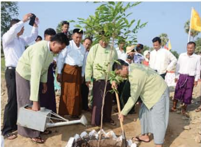
စည်သူတံတားဖွင့်ပွဲအထိမ်းအမှတ် မိတ္ထီလာခရိုင်အုပ်ချုပ်ရေးမှူး၊ မလှိုင်မြို့နယ်နှင့် ဝမ်းတွင်းမြို့နယ် အုပ်ချုပ်ရေးမှူးများ အမှတ်တရ သစ်ပင်စိုက်ပျိုးကြစဉ်

စည်သူဆည်မြောင်းလမ်း တံတားကို ရွှေကျင်ဂိုဏ်းလုံးဝန်ဆောင်နာယက လေးမျက်နှာဆရာတော်ကြီး၏ သက်တော် ၉၂ နှစ်ပြည့်အထိမ်းအမှတ်တပည့်သံဃာတော် အရှင်သူမြတ်များနှင့် အလှူရှင်များ၊ အင်းကုန်းကျေးရွာသူ၊ ကျေးရွာသားများစုပေါင်း၍ တည်ဆောက်ဖွင့်လှစ်ခဲ့ခြင်းဖြစ်သည်။