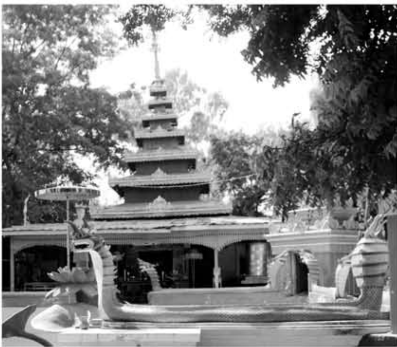
ကျေးဇူးတော်ရှင်အရှင်ဇေယျသိဒ္ဓိဓမ္မဉာဏိက ရွှေပေါ်ကျွန်းဆရာတော်ဘုရားကြီးစံကျောင်းတော်