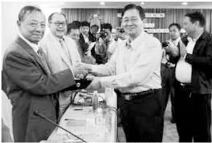
UNFC ခေါင်းဆောင်အချို့နှင့် ငြိမ်းချမ်းရေးစင်တာမှ ဝန်ကြီး ဦးအောင်မင်းအား ငြိမ်းချမ်းရေး ဆွေးနွေးပွဲတစ်ခုတွင် တွေ့ရစဉ်

စစ်ဖြစ်ပေါ်နေရသည်။ ထို့ပြင် တွင်းစစ်ကြောင့် လူမျိုးစုံပြည်သူများ ဆင်းရဲဒုက္ခကျိုးစုံနှင့် ရင်ဆိုင်နေပြီး ဒီမိုကရေစီနှင့် လူ့အခွင့်အရေးများလည်း ဆုံးရှုံးနေရသည်။ လက်ရှိအနေအထားတွင် ၂၀၀၈ ဖွဲ့စည်းပုံအခြေခံဥပဒေကို အခြေအနေနှင့် ကိုက်ညီစွာ ပြင်ဆင်ပြောင်းလဲမှု မပြုနိုင်သမျှ ဤအကျပ်အတည်းမှ ရုန်းထွက်နိုင်မည် မဟုတ်ဟု ရှုမြင်သည်"ဟု ဖော်ပြသည်။