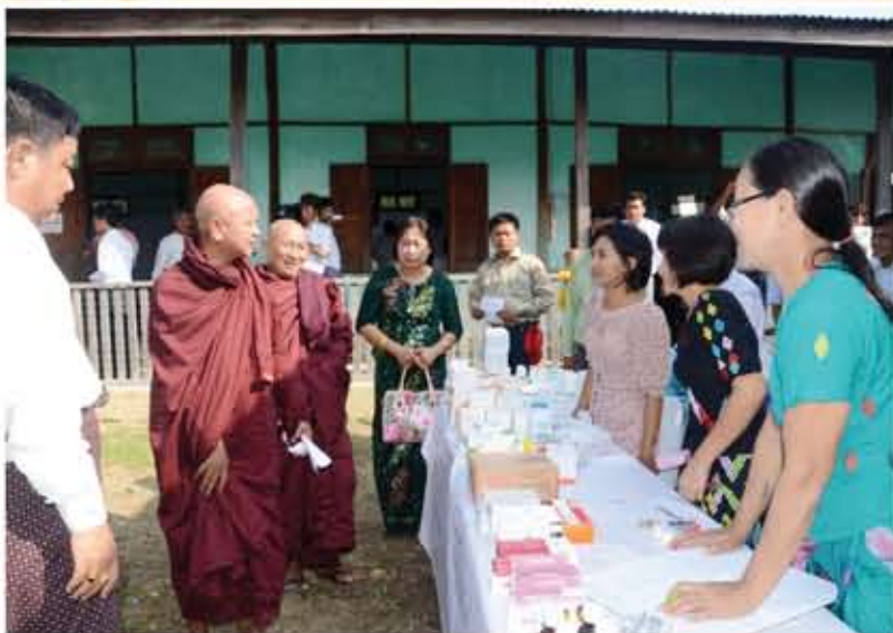
ရှစ်မျက်နှာကျောင်းတိုက်ဆရာတော်နှင့် ရွှေပေါ်ကျွန်းသာသနာပြုစခန်းပဓာနနာယက ဆရာတော်များ ဇီဝိတဒါန ဆေးကုသမှုကို လှည့်လည်ကြည့်ရှုအားပေးစဉ်