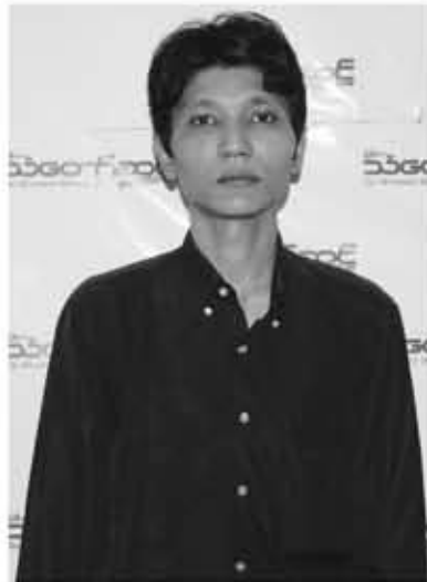
လင်းထိုက်(Y.I.T)

အရပ်သားတစ်ပိုင်းအစိုးရတက်လာပြီး ၃ နှစ်ခွဲကျော်ကာလဖြစ်တဲ့ ၂၀၁၄ နှစ် လယ်လောက်ကစပြီး မြန်မာနိုင်ငံရေးအခင်းအကျင်းမှာ ရှေ့မတိုးသာ နောက်မဆုတ်သာ အကျပ်အတည်းကြီး (Political deadlock) တစ်ရပ်ပေါ်ပေါက်လာပါတယ်။ အာဏာပိုင်နဲ့ အတိုက်အခံတို့ရဲ့ ရှေ့မတိုးသာ နောက်မဆုတ်သာ အခြေအနေမှာ အာဏာပိုင်တွေဘက်ကတော့ အဘက်ဘက်က တစ်ပန်းသာနေတဲ့အနေအထားမှာရှိပြီး အတိုက်အခံများဘက်ကသာ တကယ့်ကို ရှေ့မတိုးသာ နောက်မဆုတ်သာ အခြေအနေတစ်ရပ်အတွင်း ကျရောက်နေတာပဲ။ Political deadlock လို့ခေါ်တဲ့ နှစ်ဖက်မျှခြေညီတဲ့ အကျပ်အတည်းကြီးတော့ မဟုတ်ပါဘူး။ သီအိုရီတွေအရဆိုရင်တော့ နှစ်ဖက်မျှခြေညီတဲ့ အကျပ်အတည်းတစ်ရပ်ပေါ်ပေါက်ရင် စစ်မှန်တဲ့ တွေ့ဆုံညှိနှိုင်းစားပွဲခိုင်း (Dialogue) တစ်ခု ပေါ်ပေါက်ရပါတယ်။ လက်ရှိအခြေအနေကတော့ အကျပ်အတည်းက နှစ်ဖက်မျှခြေမညီတဲ့အခါ ဒေါ်အောင်ဆန်းစုကြည်တောင်းဆိုတဲ့ လေးပွင့်ဆိုတဲ့ တွေ့ဆုံဆွေးနွေးခြင်းမျိုး၊ ပြည်တွင်းငြိမ်းချမ်းရေးအတွက် အားလုံးပါဝင်တဲ့ နိုင်ငံရေးတွေ့ဆုံဆွေးနွေးပွဲကြီးတစ်ရပ် ပေါ်ပေါက်ဖို့ကတော့ ၂၀၁၅ မတိုင်ခင် ဖြစ်နိုင်ခြေအင်မတန်နည်းပါးပါတယ်။