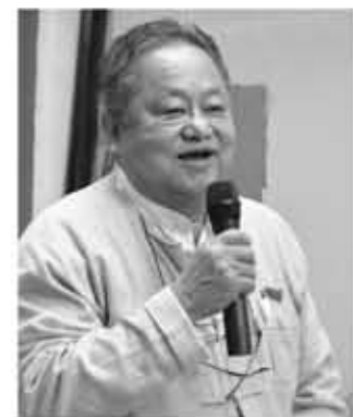
ဦးလှိုင်ထိန် (ဗဟိုအလုပ်အမှုဆောင် အဖွဲ့ဝင်၊ NLD ပါတီ)

ထိုသို့ ဝေဖန်သုံးသပ်မှုများကို နှိုင်းယှဉ်လေ့လာနိုင်ရန်အတွက် သက်ဆိုင်ရာ နယ်ပယ်များမှ တာဝန်ရှိသူ အသီးသီး၏ ပြောဆိုချက်များကို မြန်မာသံတော်ဆင့်မှ စုစည်းတင်ပြလိုက်ပါသည်။