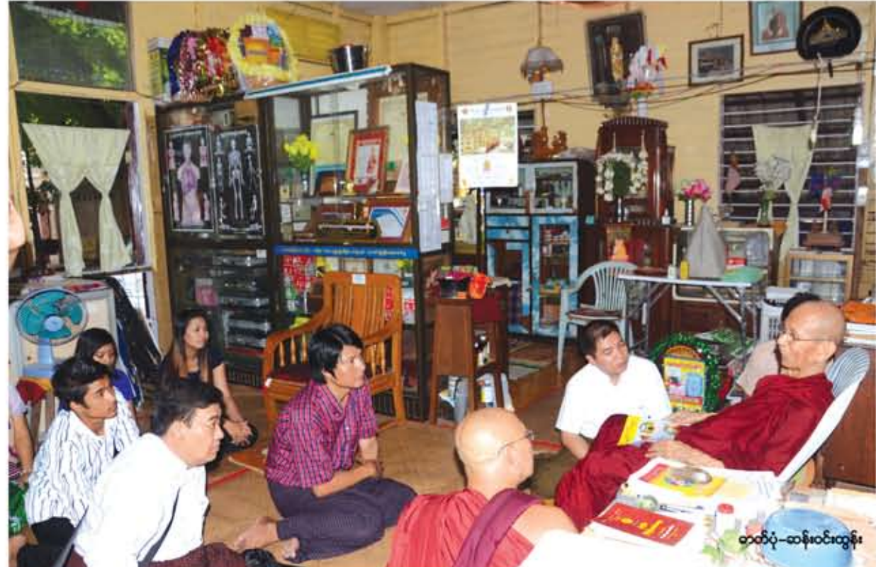
နိုင်ငံတော်ဩဝါဒါစရိယ အဘိဇေမဟာရဋ္ဌဂုရု မြဲတောင်တိုက် ရွှေဝါဝင်းကျောင်းဆရာတော်ဘုရားကြီးထံမှ မြန်မာသံတော်ဆင့် အယ်ဒီတာအဖွဲ့နှင့် စီမံရေးရာတာဝန်ရှိသူများ ဩဝါဒခံယူနေကြစဉ်။