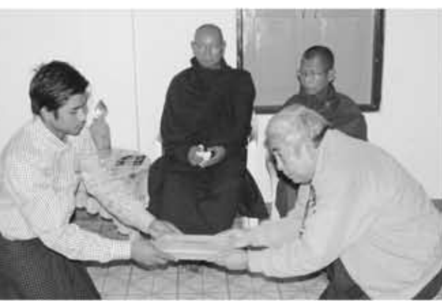
ရွှေပေါ်ကျွန်းသာသနာပြုစခန်း အလယ်တန်းကျောင်းခွဲဆရာ၊ ဆရာမများ ဝတ်စုံစိုစိုနှင့် လမ်းခင်းကုသိုလ်ရင်များအတွက် အလှူငွေများကို ပေးအပ်စဉ်