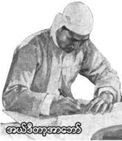
အောင်မြင်စွာအောင်မြင်

မြန်မာနိုင်ငံ၌ နှစ်ပေါင်း ၅၀ ကျော် ကာလအတွင်း အုပ်ချုပ်သော အစိုးရ အဆက်ဆက်၏ မကောင်းမှုကြောင့် နိုင်ငံ နှင့် ပြည်သူ့နာလန်မထူနိုင်အောင် ဆင်းရဲ ဒုက္ခများ ရောက်ခဲ့ကြရသည်မှာ အားလုံး အသိပင်ဖြစ်သည်။ ယနေ့ထိတိုင်လည်း အဂတိတရား လွှမ်းမိုးခြင်း၊ စီမံခန့်ခွဲမှု အားနည်းညံ့ဖျင်းခြင်း၊ အာဏာအလွဲသုံး ချွှဲ ကိုယ်ကျိုးရှာမှုများနေခြင်းနှင့် အာဏာ ဆက်လက် ကိုင်စွဲနိုင်ရေးအတွက် ဦးစား ပေး လုပ်ဆောင်နေခြင်းတို့ကြောင့် ပြည် သူလူထု၏ဘဝများဆင်းရဲဒုက္ခနွှဲထဲမှ ရုန်း မထွက်နိုင်သေးဘဲအချို့ဆိုလျှင်ပိုမို ဆိုးဝါး သော အခြေအနေများကို ရင်ဆိုင်တွေ့ကြုံ နေကြရသည်။