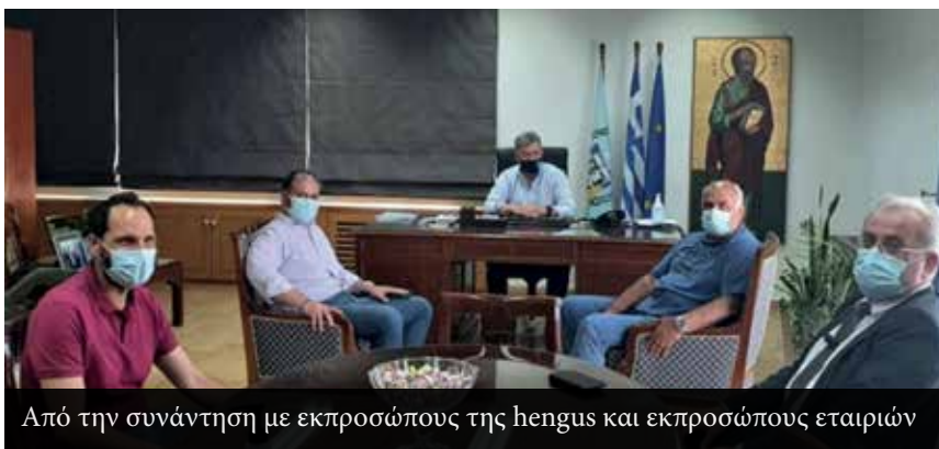
Από την συνάντηση με εκπροσώπους της hengus και εκπροσώπους εταιριών

το παλαιοκομματικό που παραλάβαμε! Οι κατάλληλοι άνθρωποι μπήκαν στις κατάλληλες θέσεις. Οι υπάλληλοι πλέον γνωρίζουν την περιγραφή της εργασίας, συνομιλούν με το Δήμαρχο και τον συναντούν, μετέχουν προτείνοντας ιδέες που υιοθετούνται, είναι αποτελεσματικότεροι. Οι επιλογές μου στα πρόσωπα των Αντιδημάρχων δικαιώθηκαν! Ο Γενικός Γραμματέας έχει αρμοδιότητες και σημαντικό ρόλο στο Δήμο. Οι Ειδικοί Συνεργάτες δεν είναι «φαντάσματα» όπως στο παρελθόν αλλά εργάζονται 8 ώρες επί συγκεκριμένου αντικείμενου. Η συνεργασία και ο συντονισμός προσώπων και δράσεων λειτουργούν προς τον κοινό στόχο, την παραγωγή έργου υπέρ του δήμου και των πολιτών. Οι επιλογές μου δεν έχουν διαψευστεί.»