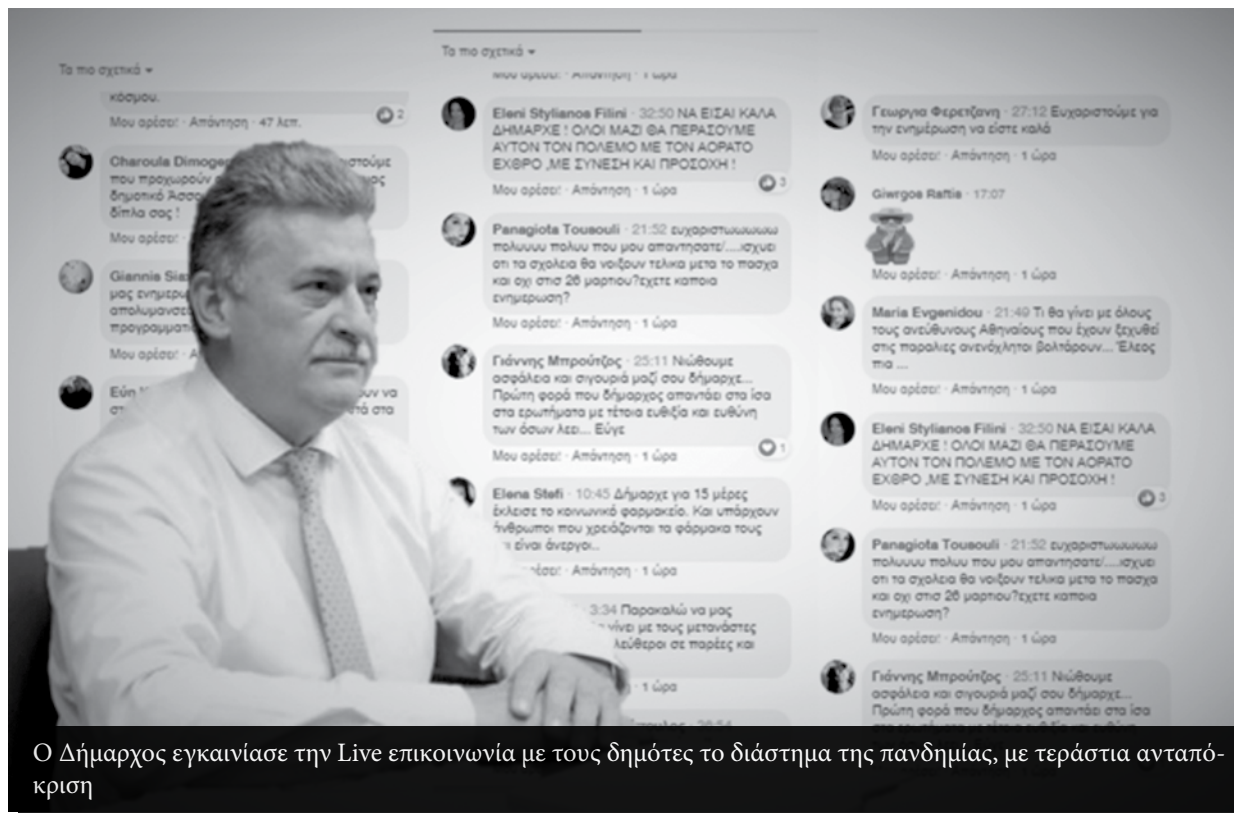
Ο Δήμαρχος εγκαίνιασε την Live επικοινωνία με τους δημότες το διάστημα της πανδημίας, με τεράστια ανταπόκριση