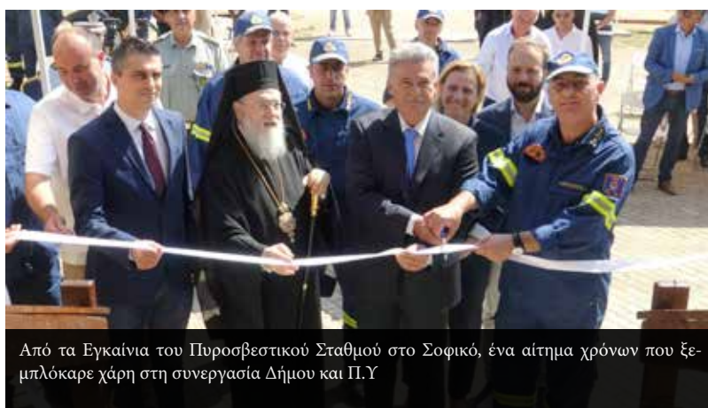
Από τα Εγκαίνια του Πυροσβεστικού Σταθμού στο Σοφικό, ένα αίτημα χρόνων που ξεμπλόκαρε χάρη στη συνεργασία Δήμου και Π.Υ

Παραδόθηκε ο δρόμος Αγ. Ιωάννου - Αγγελοκάστρου αίτημα 15ετίας για την περιοχή, σε χρή-