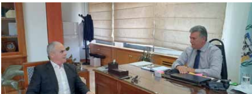
Οι συναντήσεις με τον Υπουργό Νίκο Ταγαρά είναι συνεχής και η συνεργασία φέρνει αποτελέσματα

«Ξεκινήσαμε από την Αρχή!» θα πει ο ίδιος. «Αντικαταστήσαμε με σύγχρονο μοντέλο διοίκησης