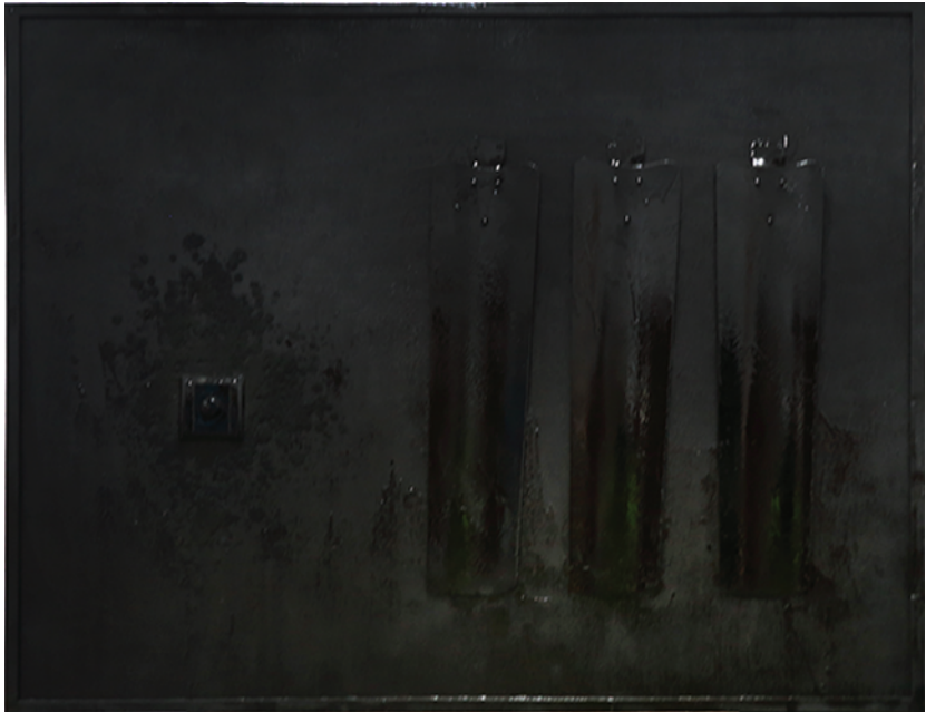
Najib Tareque, Nirman B 08, mixed media, 95 cm X 122 cm, 2017

নাজিব তারেক, নির্মান খ ০৮, মিশ্র মাধ্যম, ১২২ সেমি X ৯৫ সেমি, ২০১৭