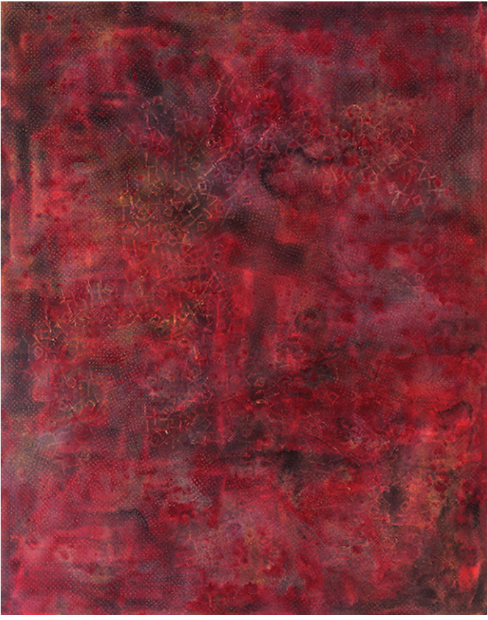
Farhana Afroz, Impression 11, acylic canvas, 122 cm X 152 cm, 2017

ফারহানা অরোজ, 'ইমপ্রেশন ১১', অসিলিক ক্যানভাস, ১২২ সেমি X ১৫২ সেমি, ২০১৭