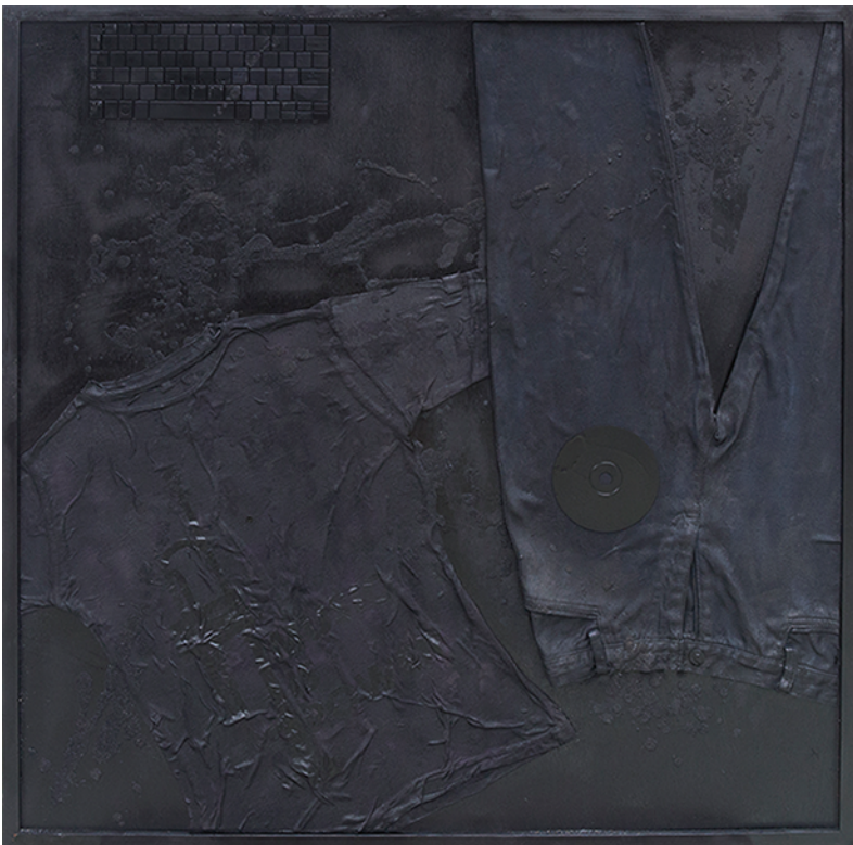
Najib Tareque, Nirman B 02, mixed media, 96 cm X 96 cm, 2017

নাজিব তারেক, নির্মান খ ০২, মিশ্র মাধ্যম, ৯৬ সেমি X ৯৬ সেমি, ২০১৭