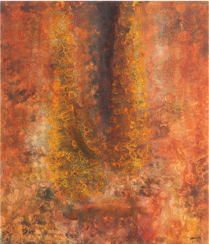
Farhana Afroz, Impression 02, acrylic canvas, 61 cm X 71 cm, 2017

ফরহানা আল-ফরোজ, 'অপ্রিয় ০২', ৬১ সেমি X ৭১ সেমি, ২০১৭