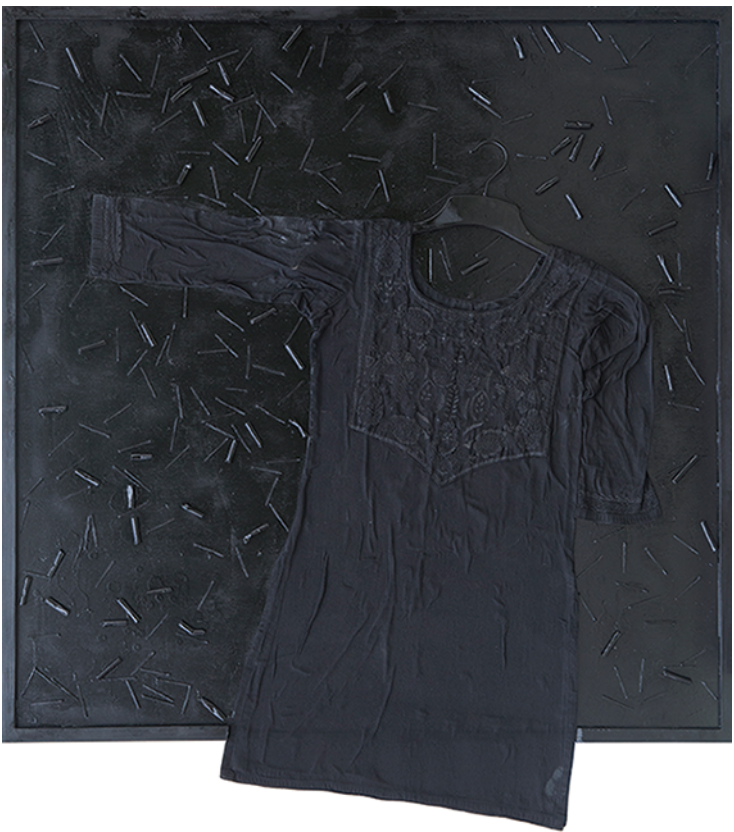
Najib Tareque, Nirman B 04, mixed media, 96 cm X 107 cm, 2017

নাজিব তারেক, নির্মান খ ০৪, মিশ্র মাধ্যম, ৯৬ সেমি সেমি, ২০১৭