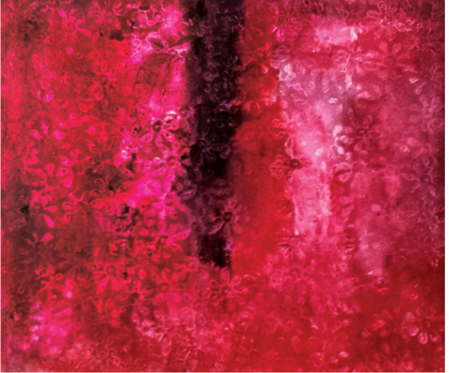
Farhana Afroz, Impression 01, acrylic canvas, 71 cm X 61 cm, 2017

ফারহানা আফরোজ, প্রতিচ্ছায়া ০১, ক্যানভাসে এক্রিলিক, ৭১ সেমি X ৬১ সেমি, ২০১৭