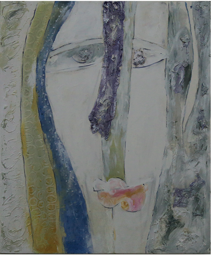
Farhana Afroz, Woman 01, acrylic canvas, 51 cm X 61 cm, 2017

ফারহানা আফ্রোজার 'নারী ০১' ক্যানভাসে অ্যাক্রিলিক, ২০১৭ X ৬১ ৬১ সেমি, ২০১৭