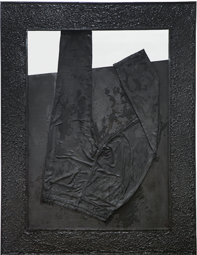
Najib Tareque, Nirman B 09, mixed media, 109 cm X 139 cm, 2017

নাজিব তরেক, 'নির্মান B 09', '১০৯ স্মার্টস', '১৩৯ সেমি X ১৩৯ সেমি', ২০১৭