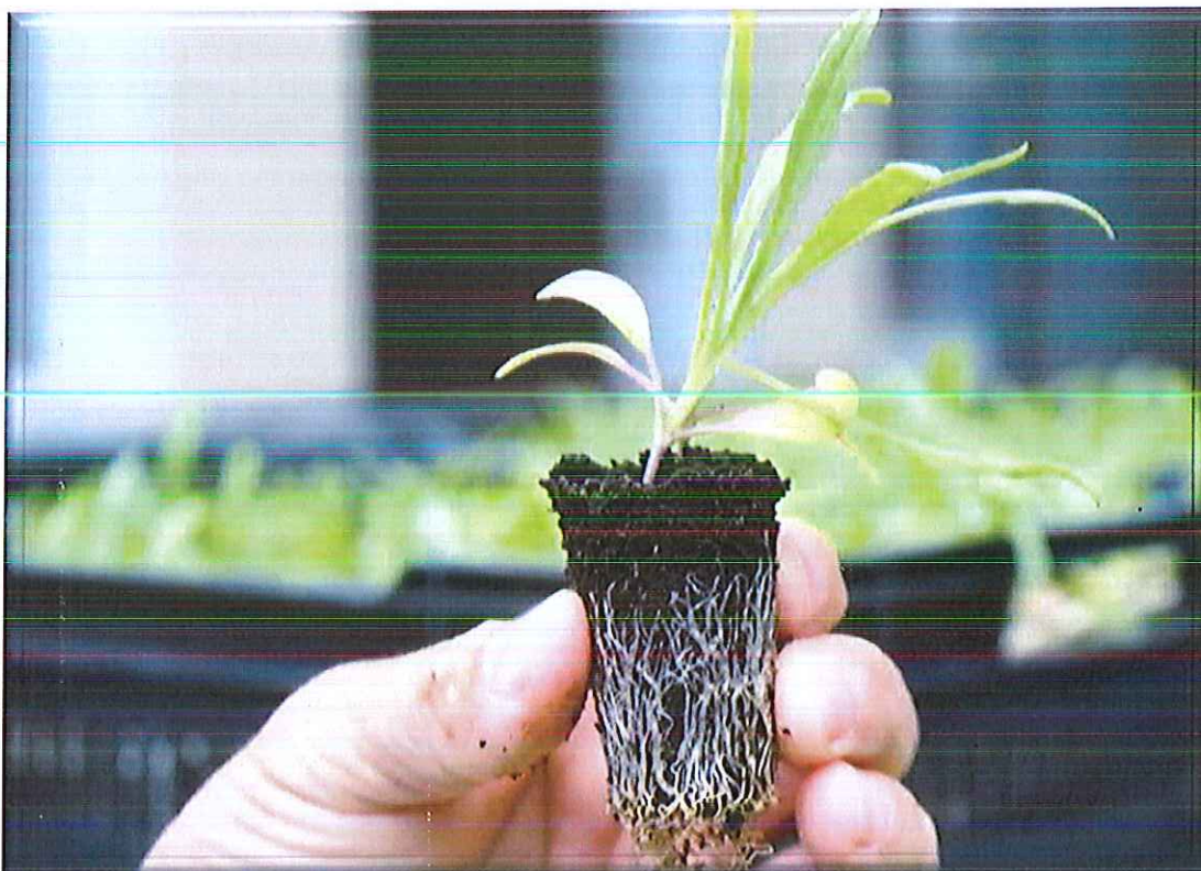
Fidanët e rinj të certifikuar të mbjellë në Luginën e Zhupës