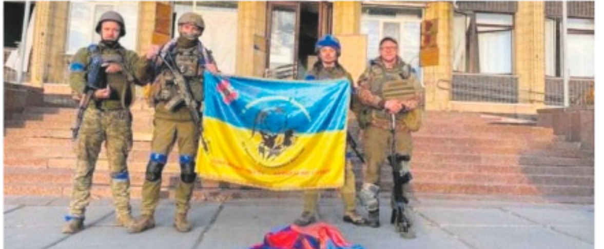
TRIONFO Soldati ucraini a Kupiansk