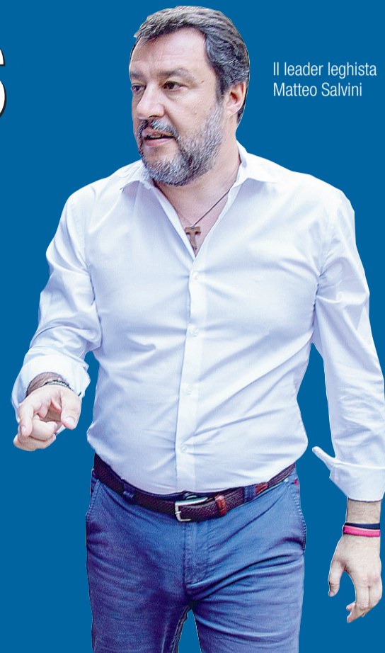
Il leader leghista Matteo Salvini