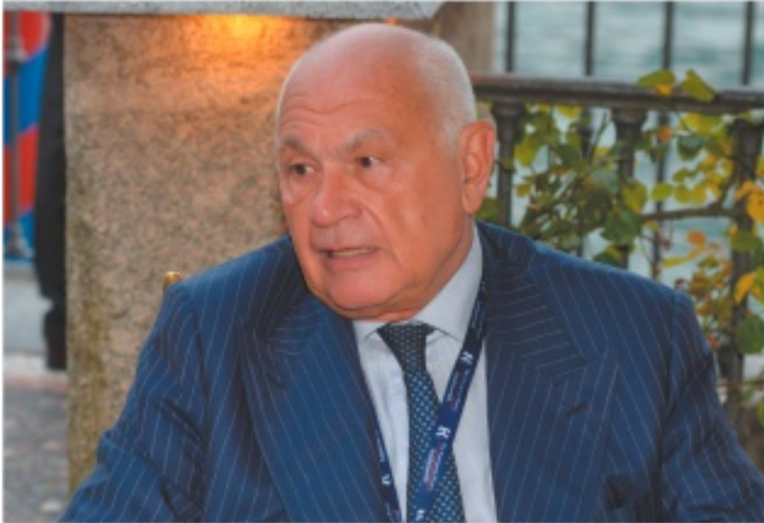
IN CAMPO L'ex magistrato Carlo Nordio è candidato con Fratelli d'Italia