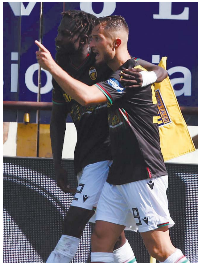
→ all'interno e alle pagine 35 e 36