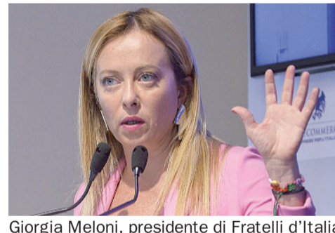
Giorgia Meloni, presidente di Fratelli d'Italia