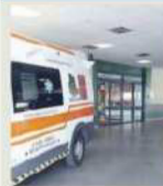
Il Pronto soccorso di Perugia

Alcol e risse, movida violenta nei bar di paese