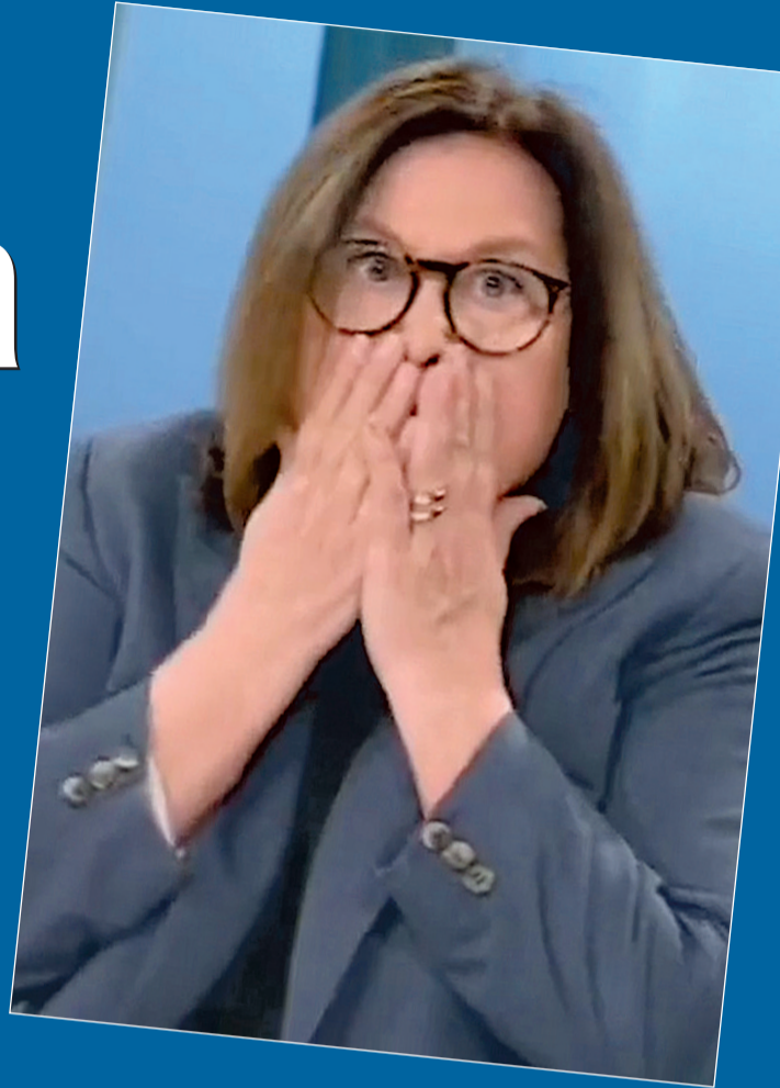
Lucia Annunziata si copre la bocca dopo aver detto una parolaccia alla ministra Roccella nel corso di "Mezz'ora in Più" su Rai 3

La giornalista Rai si crede ancora sul palco della Cgil e aggredisce in diretta tv il ministro Roccella sulle gravidanze all'estero per conto terzi: «Dovete fare questa legge, c...o»