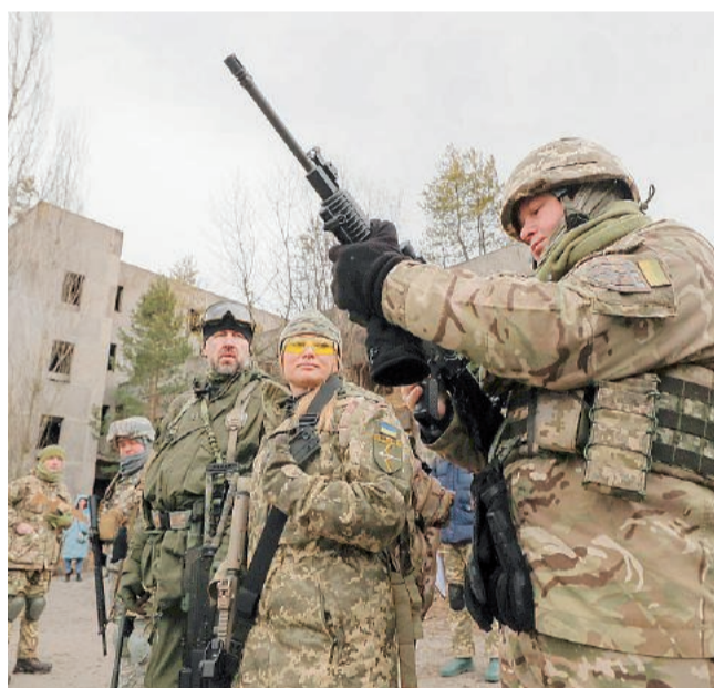
Armi&militari Esercitazioni dei soldati ucraini

■ Il leader M5S: "Passo dopo passo, armamenti su armamenti, ci ritroviamo totalmente immersi nel conflitto senza negoziati". Gasparri, FI: "Fare di più per il dialogo". Malan, FdI: "Normale"