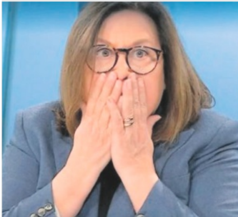
GAFFE L'espressione di Lucia Annunziata dopo la parolaccia in diretta