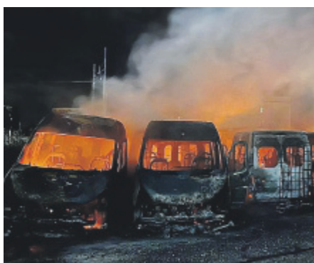
MINACCIA Uno dei roghi a Roma

«Per il compagno Cospito abbiamo bruciato a Roma 16 auto delle Poste»