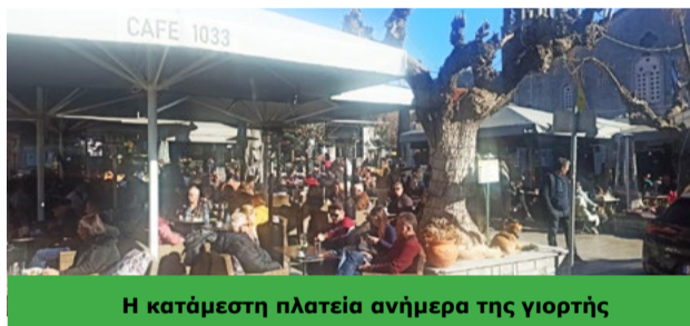
Η κατόμεστη πλατεία ανήμερα της γιορτής

να εορτάσουν τα Χριστούγεννα στον τόπο τους. Ο «όμιλος κυριών» οργάνωσε την «9η εβδομάδα τέχνης» στο κτίριο της Τριανταφυλλιδείου σχολής, η οποία λειτούργησε από τις 23 Δεκεμβρίου μέχρι τις 3 Ιανουαρίου και παρουσιάστηκαν σε αυτήν έργα ντόπιων καλλιτεχνών και δόθηκε η ευκαιρία να την επισκεφθούν μόνιμοι κάτοικοι και ξένοι παρρηπιδημούντες. Και για να μην ξεχνάμε την παράδοση όλα τα σπίτια ετοιμάστηκαν να γιορτάσουν με