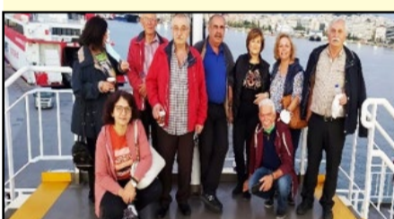
Οι Βυτινραίοι εκδρομείς επιβιβάζονται στο πλοίο