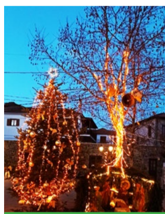
Το δένδρο της πλατείας

Οι ετοιμασίες της γιορτής άρχισαν μια βδομάδα πριν από τα Χριστούγεννα με την ανάλογη διακόσμηση των καταστημάτων, των δρόμων και των πλατειών. Το τοπικό δημοτικό συμβούλιο σε συνεργασία με τον σύνδεσμο φιλοπροόδων έστησε το παραδοσιακό έλατο στην κεντρική πλατεία διακοσμημένο με τη χριστουγεννιάτικη φάτνη. Παράλληλα φρόντισε για τον εορταστικό στολισμό των δρόμων, ενώ ο «όμιλος κυριών» φρόντισε, όπως κάνει συνήθως, τη δεύτερη μεγάλη πλατεία, την πλατεία «Οικονομίδη». Όλα τα ξενοδοχεία, τα μικρά καταλύματα, τα εστιατόρια και τα καταστήματα στολίστηκαν ανάλογα δίνοντας έντονο χριστουγεννιάτικο χρώμα στον χώρο τους. Ο καιρός όλη την εβδομάδα πριν από τη γιορτή ήταν αίθριος, τη νύχτα όμως η θερμοκρασία κατέβαινε χαμηλά (μισοβδόμαδα σημειώθηκε η χαμηλότερη -7ο C) αλλά την ημέρα έφτανε τους 16 - 17 βαθμούς.