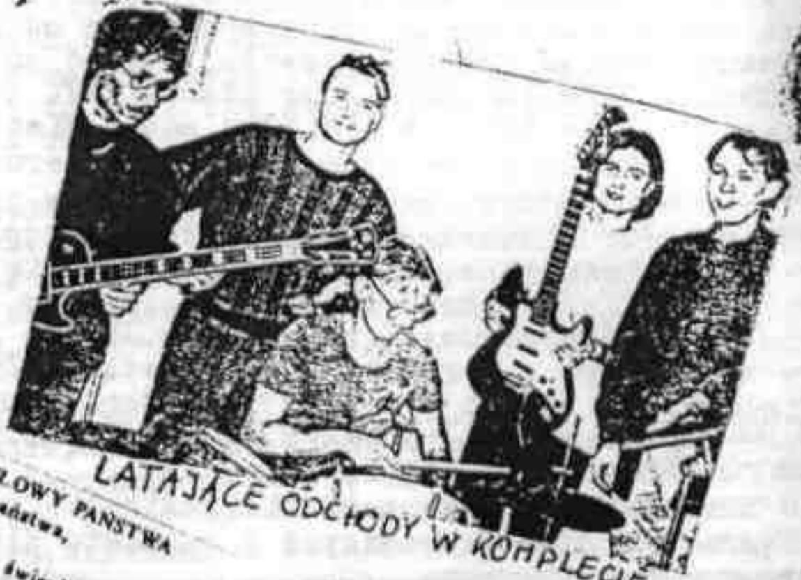
LATAJACE ODCHODY W KOMPLECIE

TABLE Bie, bie, bie, gdzie jest wódeczka Bie, bie, bie, gdzie ja schowałem Bie, bie, bie, czy mam sklerozę Bie, bie, bie, czy zapomniałem Gadajcie, gdzie wódka jest, Bo będzie bardzo źle i zabije cie