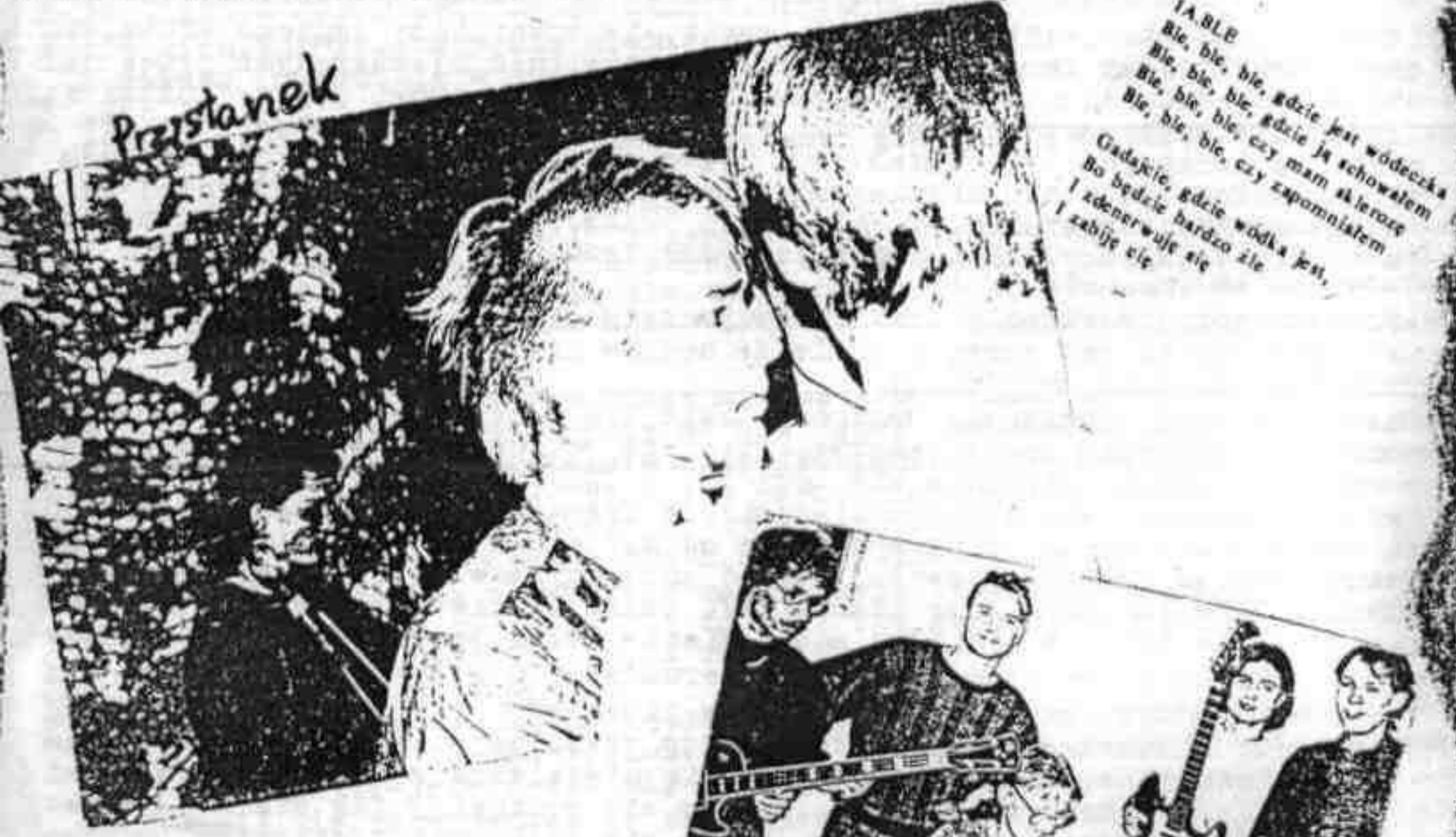
TABLE Bie, bie, bie, gdzie jest wódeczka Bie, bie, bie, gdzie ja schowałem Bie, bie, bie, czy mam sklerozę Bie, bie, bie, czy zapomniałem Gadajcie, gdzie wódka jest, Bo będzie bardzo źle i zabije cie