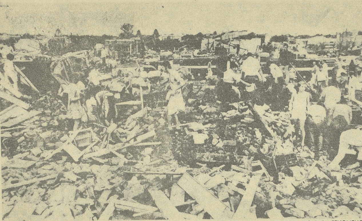
ESCOMBROS, PRIMER IMPACTO DE LA DESOLACION Y ANGUSTIA DE LO QUE SIGNIFICO PARA SAN JUSTO EL FENOMENO ATMOSFERICO DE LA VISPERA. ALLI, FAMILIARES Y AMIGOS EN LA BUSQUEDA ESPERANZADA, O EN LA DESESPERACION DE LO IRREPARABLE

Recién a la 1 de la mañana fue restablecido el servicio eléctrico y supera todo lo imaginable lo visto en las horas en que las sombras (veros aventadas por focos de vehículos y faros de gas. A la angustiosa interrogación de quienes buscaban a sus familiares, se sumaba la ordenada labor de soldados,